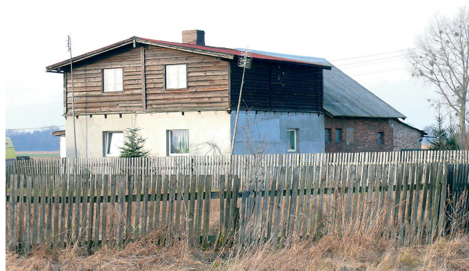
Negatywny przykład przebudowy pierwotnego układu i zmiany wielkości otworów okiennych, pokrycie ścian zewnętrznych tynkiem we wsi Młodzianów

An example of proper preservation of the initial set and size of window openings and external walls in Młodzianów village