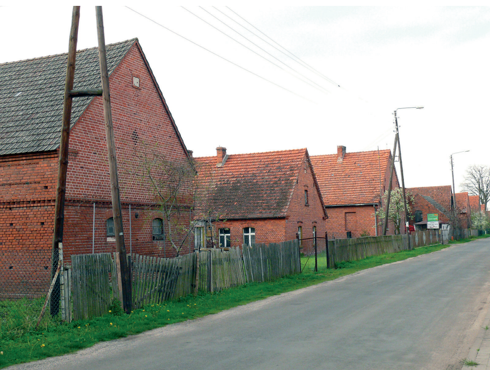
Szczytowy układ zabudowy we wsi Żeleźniki

Dziedzictwem opisywanego obszaru są także układy przestrzenne wsi, architektura a szczególnie obiekty zabytkowe. Budownictwo wiejskie kształtowane zgodnie z zasadą użyteczności i praktyczności rozwiązań technicznych. Kształt wznoszonych obiektów, ich konstrukcja i materiał, z jakich były realizowane był zależny od lokalnych warunków. W historycznym rozplanowaniu wsi wyraźnie widoczna jest regularna linia zabudowy, układ budynków