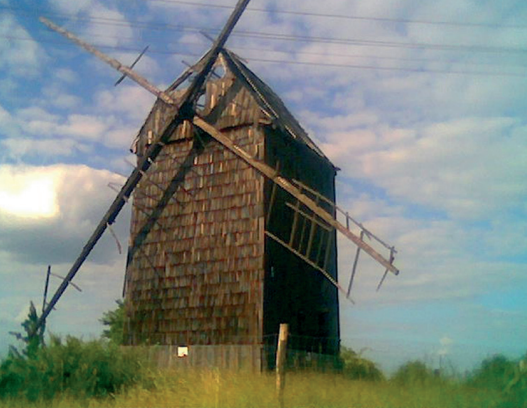
Zniszczony drewniany wiatrak typu koźlak we wsi Duchowo

Destroyed wooden post mill in Duchowo village