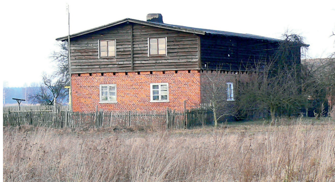
Przykład prawidłowego zachowania pierwotnego układu i wielkości otworów okiennych oraz ścian zewnętrznych we wsi Młodzianów

An example of proper preservation of the initial set and size of window openings and external walls in Młodzianów village