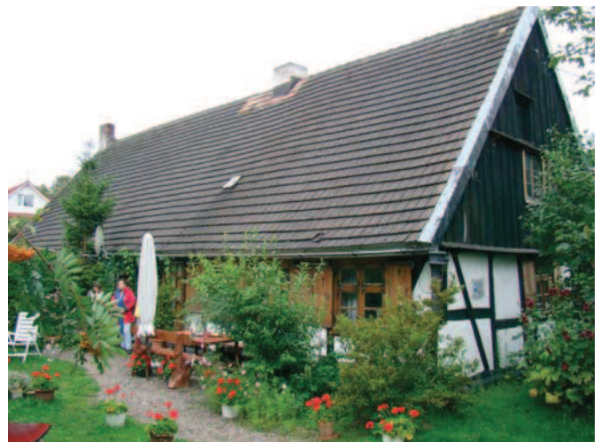
Ryc. 3a. Zabytkowa chałupa z XIX wiekunr 75-76