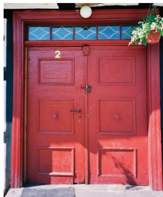
Fig. 4. The front door from the XIX century – cottage No. 2

przypadkach zachowały się w nich fragmenty ścian ryglowych. Jednym z głównych elementów zagród chłopskich są budynki bramne (stodolno-inwentarskie), z szerokimi wrotami i inskrypcjami na nadprożach. (np. w zagrodzie nr 2, 17, 55, 70). Na uwagę zasługują także wielkokubaturowe (2-3-klepisowe) stodoły, w tym najstarszy obiekt z 1797 roku w zagrodzie nr 18.