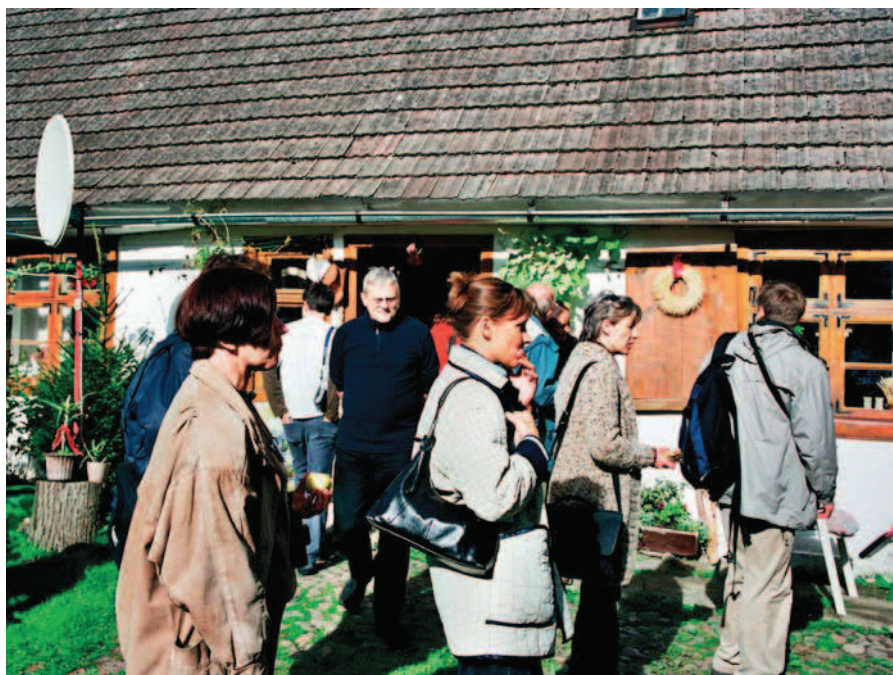
Ryc. 5. Europejskie Dni Dziedzictwa, Antikon 2004