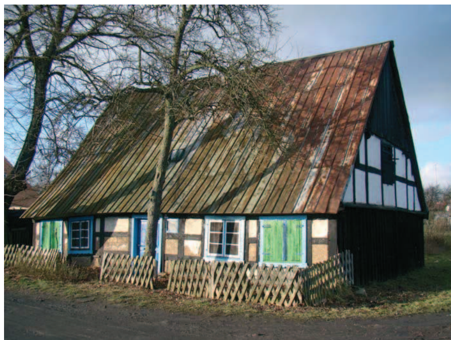
Ryc. 16 Warsztaty „malowane domy” 2008

mieszkańców wsi. Zgodnie z założeniami ściana miała pełnić funkcje edukacyjno-ekspozycyjne, stąd poszczególne pola międzyryglowe zostały wypełnione w sposób zróżnicowany: strychuły, cegła gliniana (tzw. peca), cegła ceramiczna, plecionka. Na każdym etapie wypełniania ścian, każdy mógł samodzielnie przygotować budulec i wmontować go w ścianę. Równocześnie z budową ściany ukończono montaż