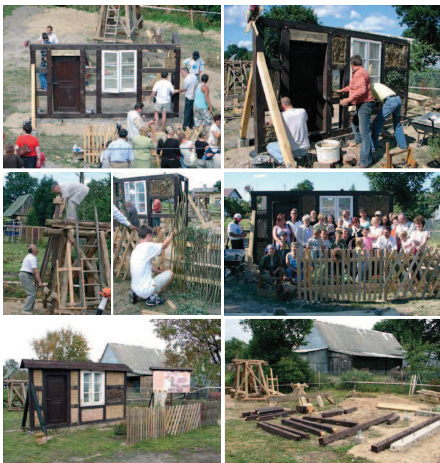
Ryc. 6-11. Warsztaty konserwatorsko-budowlane 2007

W otoczeniu placu budowy umieszczono wystawę o krajobrazie kulturowym wsi Słowino, ustawiono namioty z etnograficzną ekspozy-