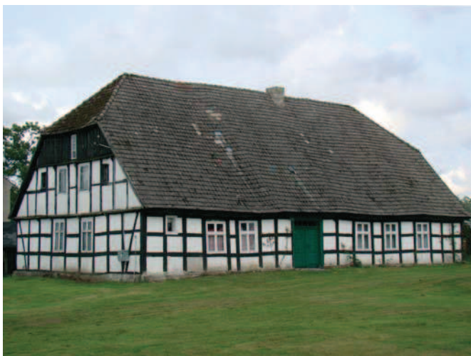
Ryc. 3. Chałupa nr 60 z 1857 r.

Budynki gospodarcze utraciły obecnie swą pierwotną funkcję. Na przestrzeni lat rozbudowywane i przemurowywane, jednak w wielu