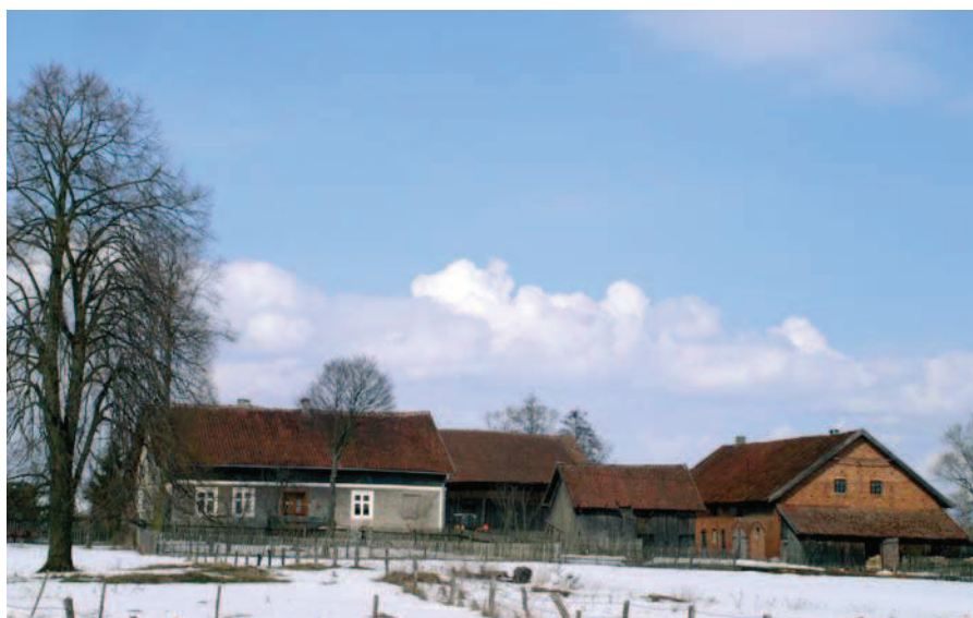
Ryc. 2. Prasłity, pow. olsztyński, gospodarstwo kolonijne z typowym, czworobocznym układem zagrody i budynkami

mia różnorodność form – od terenów płaskich po tereny moren o deniwelacji nawet ponad 100 m, wyróżnia bardzo bogata sieć wodna, którą tworzy największa w Polsce liczba jezior polodowcowych i olbrzymia ilość cieków wodnych. Cechą charakterystyczną jest gospodarka rolna (przeważa na terenach północnych i centralnych) i leśna (głównie południowa część województwa). Występują trzy zasadnicze typy krajobrazu: równiny, pojezierza i doliny oraz wzniesienia. Wśród układów przestrzennych wsi najczęściej występują owalnice i wielodrożnice – najwięcej w zachodniej, północnej i centralnej części województwa – oraz ulicówki (największe ich zagęszczenie przypada na południowo-wschodni obszar województwa). Rzadziej spotykanymi układami są widlice, wsie placowe, rzędowe i szeregówki. Sporadycznie pojawia się zabudowa kolonijna, szczególnie z największym zagęszczeniem na Warmii (ryc. 1). Na obszarze całego regionu, we wszystkich typach wsi, występują małe i średnie zagrody w formie mniej lub bardziej wydłużonego prostokąta z domem ustawionym kalenicowo w stosunku do drogi (ryc. 2). Domy ustawione szczytowo do drogi, na długich wąskich działkach występują coraz rzadziej, głównie na terenie powiatu szczycieńskiego i piskiego. Zagrody na planie zbliżonym do kwadratu z bardziej rozluźnioną zabudową występują w kolonijnych zagrodach jednodworczych w całym regionie