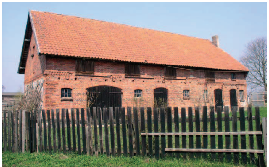
Ryc. 4. Zawady, pow. ostródzki, typowy budynek gospodarczy