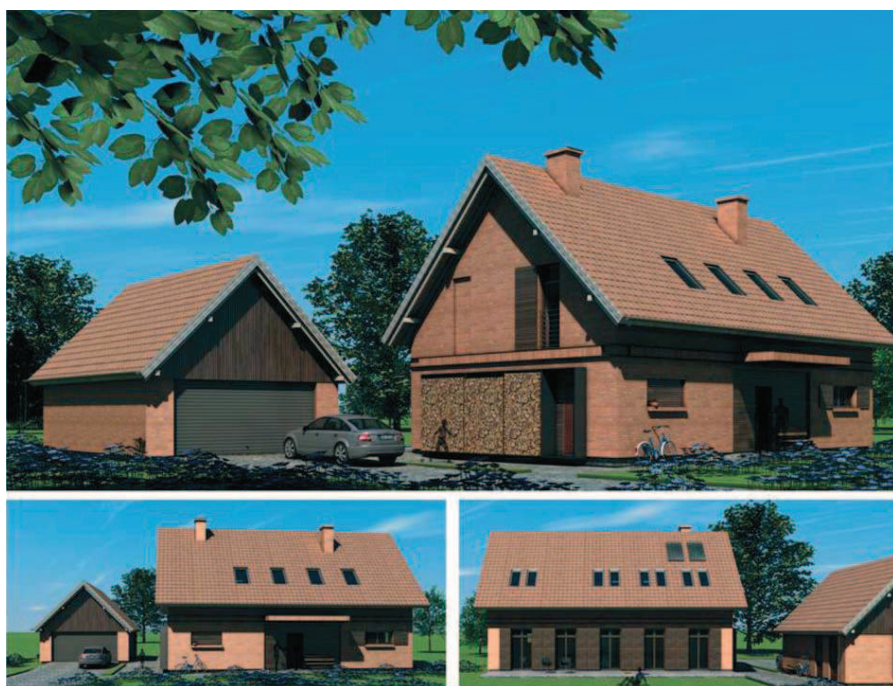
Fig. 13. One of the projects awarded in the competition „Your home – a dialogue with tradition”

zwykle solidnie i trwale. Były murowane z cegły licowej lub murowane, tynkowane. W obiektach murowanych ściankę kolankową i szczyt realizowano często w technologii lekkiej. Jest to najczęściej szkielet drewniany opierzony deskami lub konstrukcja ryglowa (przy budynkach tynkowanych szachulec, przy cegle licowej mur pruski). Stodoły są przeważnie drewniane, w konstrukcji szkieletowej, opierzone poziomo lub pionowo deskami. Na terenach, gdzie występuje duża ilość głazów narzutowych, budynki gospodarskie często murowano z kamienia, czasami łączonego z cegłą (ozdobne opracowanie otworów i narożników, dekoracyjne uzupełnienia górnych