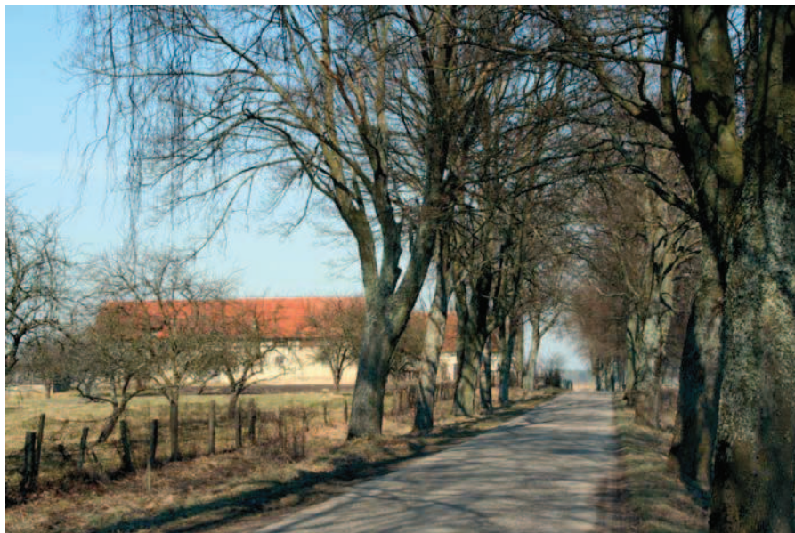
Fig. 6. A typical view – a roadside alley and rural farm