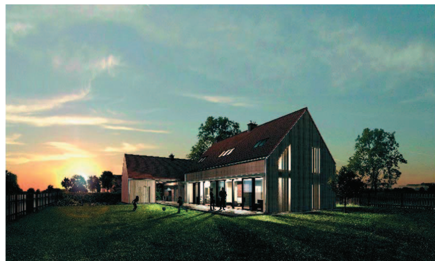
Ryc. 7. I nagroda w konkursie „Twój dom – dialog z tradycją”