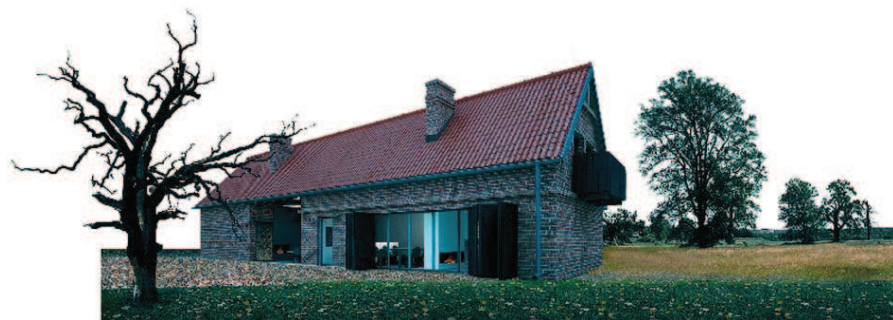
Ryc. 8. II nagroda w konkursie „Twój dom – dialog z tradycją”