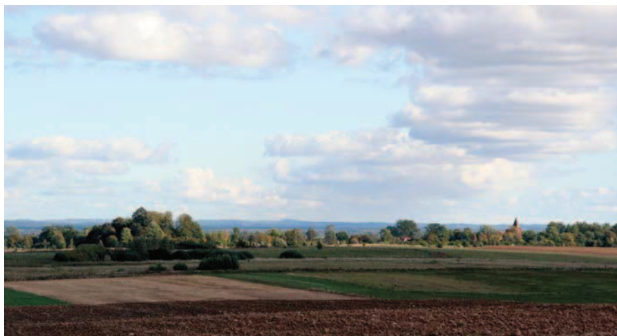
Fig. 1. The vast agricultural landscape with panorama of the village Olszewki Węgorzewskie, recognized by the two dominants church tower and rural cemetery

i rozwoju historycznego, form i rodzajów występowania, nasycenia i stanu zachowania. W pierwszej fazie zdefiniowano kod krajobrazowy regionu. Za jego podstawowe elementy uznano: rozplanowanie wsi, kształt i rozplanowanie siedlisk, bryły domów mieszkalnych, bryły i formy budynków gospodarskich, materiały budowlane i wykończeniowe, detal architektoniczny, małą architekturę, zieleni. W drugim etapie dokonano syntezy, charakteryzując