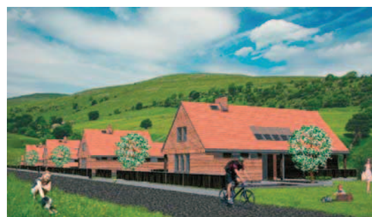
Ryc. 11. Jeden z projektów wyróżnionych w konkursie „Twój dom – dialog z tradycją”