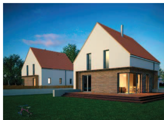
Fig. 11. One of the projects awarded in the competition „Your home – a dialogue with tradition”