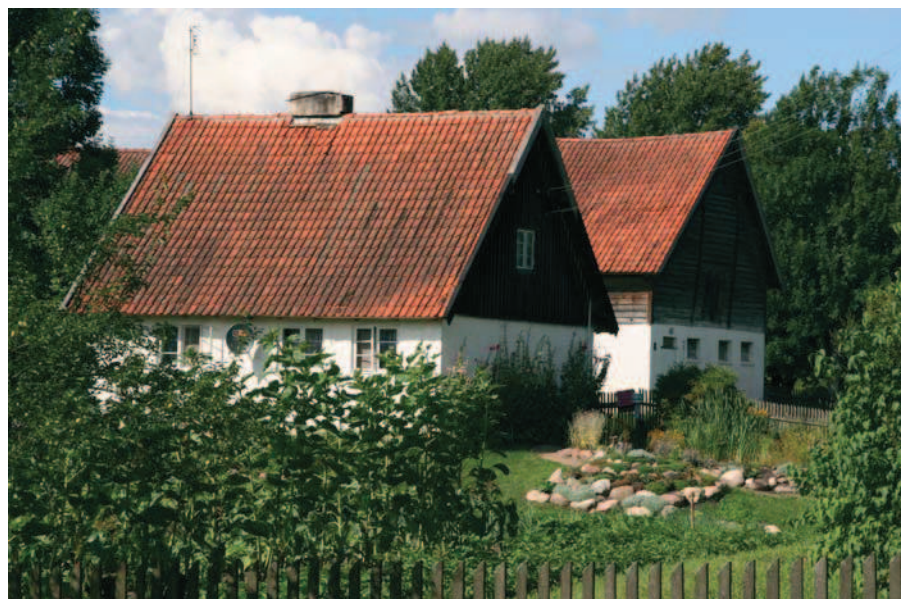
Ryc. 5. Pilwa, pow. giżycki, typowa zabudowa z lat 30. XX w., wznoszona wg projektów powtarzalnych