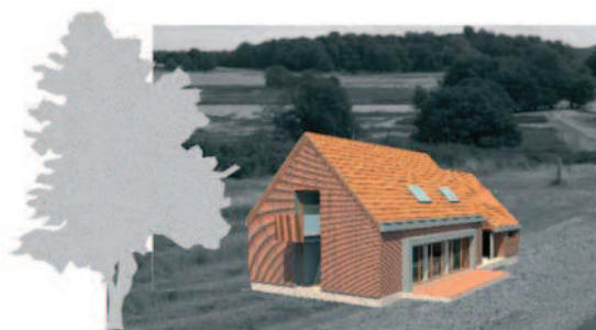
Ryc. 10. III nagroda w konkursie „Twój dom – dialog z tradycją”