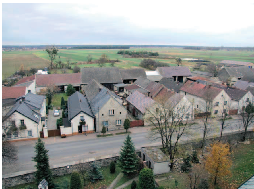
Fig. 5. Jemielnica – legible historic village structure with visible transformations of the front elevation

Urzędu Ochrony Zabytków w Opolu brak było do roku 2009 materiałów dotyczących wyżej wymienionych obszarów, tylko w przypadku Ścinawy powstało studium z wytycznymi konserwatorskimi 4 . Dodatkową trudnością w ochronie zasobów są same wpisy do rejestrów, dokonane w latach 50. i 60. XX w. w dużym stopniu nieprecyzyjne, nie mające żadnych załączników graficznych w decyzjach tych opis ogranicza się do lakonicznych stwierdzeń typu: