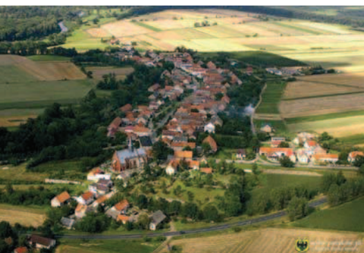
Fig. 11. Stary Paczków – a village of outstanding values

tle wartościowych elementów np. maszty telekomunikacyjne, silosy, hale przemysłowe obserwowane z tras komunikacyjnych, punktów widokowych, tablice reklamowe na budynkach, ogrodzeniach, w pasie drogowym [Sałyga-Rzońca 2010].