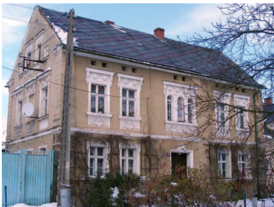
Ryc. 3. Złotogłowice – przykład dekoracji architektonicznej budynku mieszkalnego

i kozielskiego. Natomiast na terenie lewego brzegu Odry występowało budownictwo szkieletowe i murowane. Przy czym domy murowane powiatu brzeskiego, nyskiego, prudnickiego i głubczyckiego charakteryzowały się wyjątkowo starannym wykonaniem [Gładyszowa 1978]. Bardzo często były to domy piętrowe, o wysokich walorach architektonicznych (ryc. 3). Należy pamiętać, że na tych terenach już od XVIII wieku rozwijało się budownictwo frankońskie z charakterystycznym typem zagrody zamykanej bramą o reprezentacyjnych i bogatych formach elewacji szczytowych.