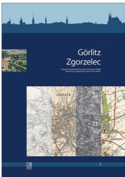
Ryc. 2. Okładka drukowanej wersji Historyczno-topograficznego atlasu miast śląskich . Tom 1: Görlitz/Zgorzelec . Po rozłożeniu okładki widoczny w lewym górnym rogu fragment fotografii okazuje się częścią małego kolażu map i zdjęć lotniczych, przypominającego intro wersji internetowej; © Herder-Institut

Właśnie w tym okresie w miastach Europy Środkowo-Wschodniej rozpoczęły się dynamiczne zmiany, w czasie których widoczne niegdyś z daleka średniowieczne mury i bramy miejskie, przez długi czas stanowiące barierę dla rozwoju przestrzennego, zniknęły z krajobrazu miejskiego większości ośrodków, a w pozostałych z reguły przestały stanowić element dominujący (ryc. 2).