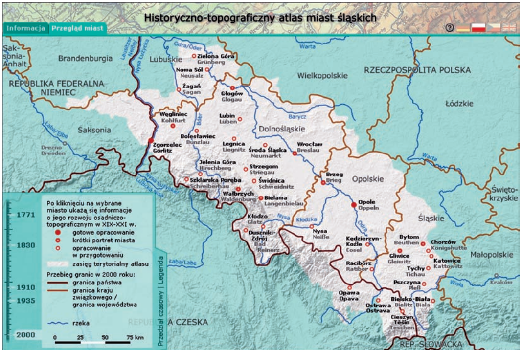
Ryc. 3. Mapa przeglądowa wersji internetowej Historyczno-topograficznego atlasu miast śląskich z wysuniętą legendą (stan na początek 2012 r.); © Herder-Institut

z nich jest tekst o rozwoju przestrzennym miasta oraz dokumentacja rozwoju zasiedlenia, gospodarki i sieci transportowej miasta wraz