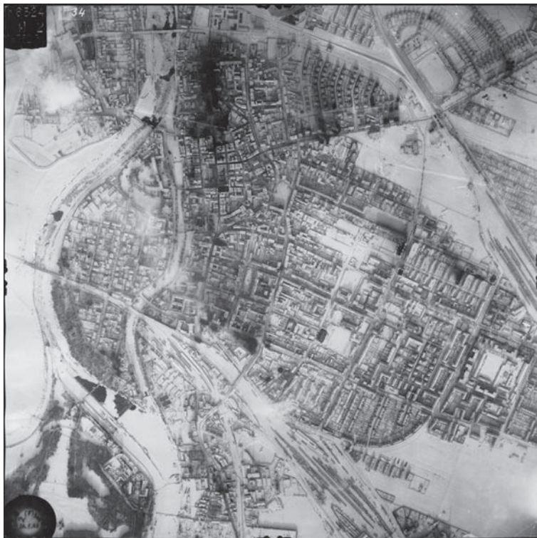
Ryc. 1. Pionowe zdjęcie lotnicze Luftwaffe z 26 stycznia 1945 r. pokazuje stopień zniszczeń jeszcze przed rozpoczęciem działań wojennych w Opolu (zerwane mosty na Odrze oraz ślady pożarów i bombardowań). Po zakończeniu wojny zniszczenia sięgały ok. 30% przedwojennej zabudowy; © Herder-Institut

map topograficznych. W przypadku miast znajdujących się na terenie dawnego Księstwa Śląskiego, które wchodziło w skład monarchii habsburskiej, pomocne są tu wyniki kartowań austriackich z lat 1845 i 1880. Dalsze fazy rozwoju pozwalają prześledzić mapy topograficzne wydane w Polsce oraz Czechosłowacji względnie w Republice Czeskiej, a w przypadku podwójnego miasta Görlitz/Zgorzelec, także mapy