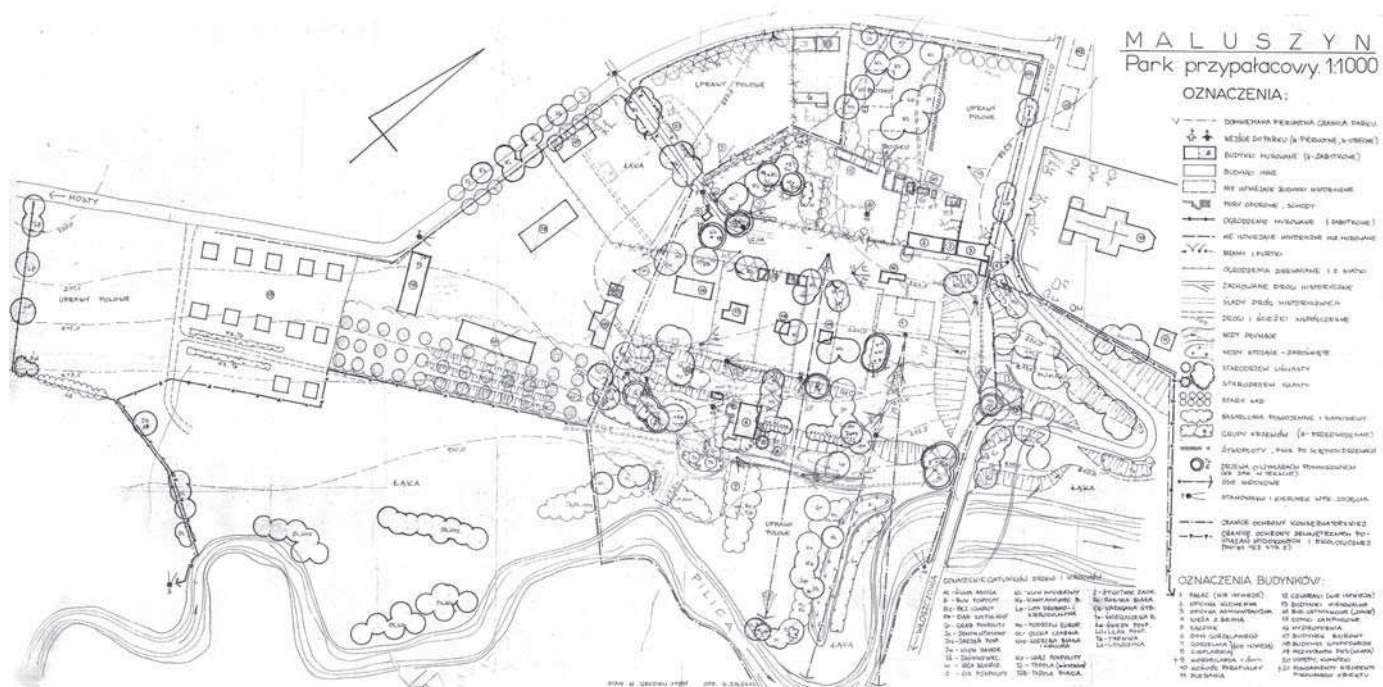
Fig. 2. Graphic appendix to the records of the park in Maluszyn [Zaleski 1989]

dokonywaniu masowych nasadzeń roślin, współczesnych zarówno pod względem kompozycyjnym, jak i gatunkowym oraz wprowadzaniu nowych elementów wyposażenia, niezwykle ważne jest przypomnienie o obowiązku ochrony autentyczności [Milecka 2009].