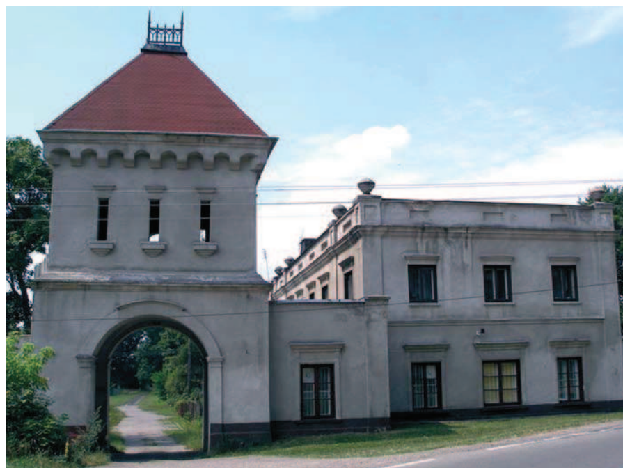
Ryc. 1. Wieża bramna w zabytkowym założeniu pałacowo-parkowym w Maluszynie

Przemiany gospodarcze i polityczne, jakie dokonały się w Polsce w ciągu ostatnich lat pozwoliły, aby część ogrodów wróciła do dawnych, bądź znalazła nowych właścicieli. Niestety ci drudzy nie zawsze są właściwie przygotowani do objęcia mecenatu nad tego typu obiektami, coraz częściej zatem występują konflikty interesów pomiędzy podstawowymi zasadami użytkowania założeń ogrodowych, a proponowanymi przez właściciela sposobami zagospodarowania parku (a więc nim samym). Już w chwili obecnej obserwuje się niezgodne z zastanymi zasobami sposoby zagospodarowania historycznych założeń. Ogrody jednak są żywymi dziełami sztuki, mają naturalne prawo przekształcać