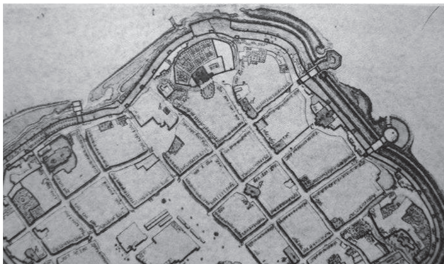
Fig. 1. Historical plans of the Reformati gardens from the year 1785, and 1800 and the map from the end XX c.

ściennie-filarowym 9 . Ściana szczytowa zwieńczona została stromym dachem, nawa kościoła trójprzęsłowa ze sklepieniem kolebkowym i lunetami. Do bryły budynku w 1901 roku dobudowano kaplicę Pana Jezusa Miłosiernego 10 .