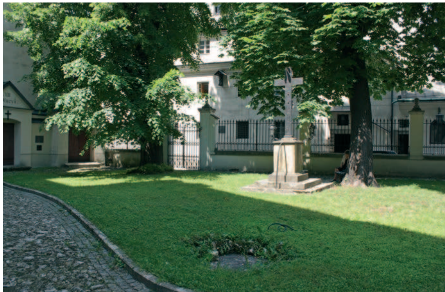
Fig. 2. Calvary in Reformacka Street

niesiono figurę Matki Bożej umieszczając ją na dłuższej osi od północy. Wcześniejsza kompozycja (czterokwaterowa) została zatarta nie dość czytelnym układem geometrycznym oraz nasadzeniami z krzewów róż, lilaków i pnączem na ścianach. Obecnie do wnętrza wprowadzono, od strony północno-wschodniej, formę smukłej, wieżowej dobudowy zwieńczonej hełmem (klatka schodowa), (ryc. 3). Kompozycja wirydarza uległa przekształceniu, główna oś została zachowana ze studnią oraz figurą, a narys ścieżek oparty został na krzyżu świętego Antoniego. Elementy podkreślone zostały nasadzeniami z bukszpanu, przy prostokątnym niewielkim placu oraz na narożach kwater. Tam znalazły się ławki, a w centralnym punkcie pozo-