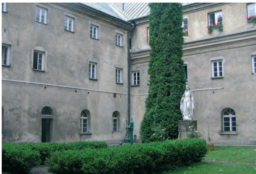
Fig. 3. Cloister garth of monastery of the Reformati