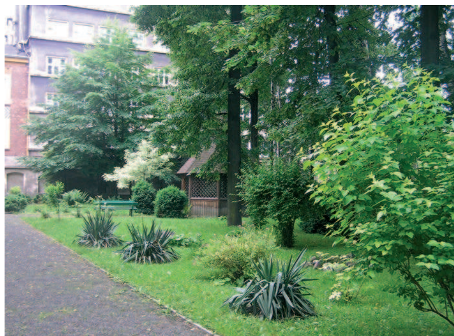
Ryc. 4. Ogród klasztorny