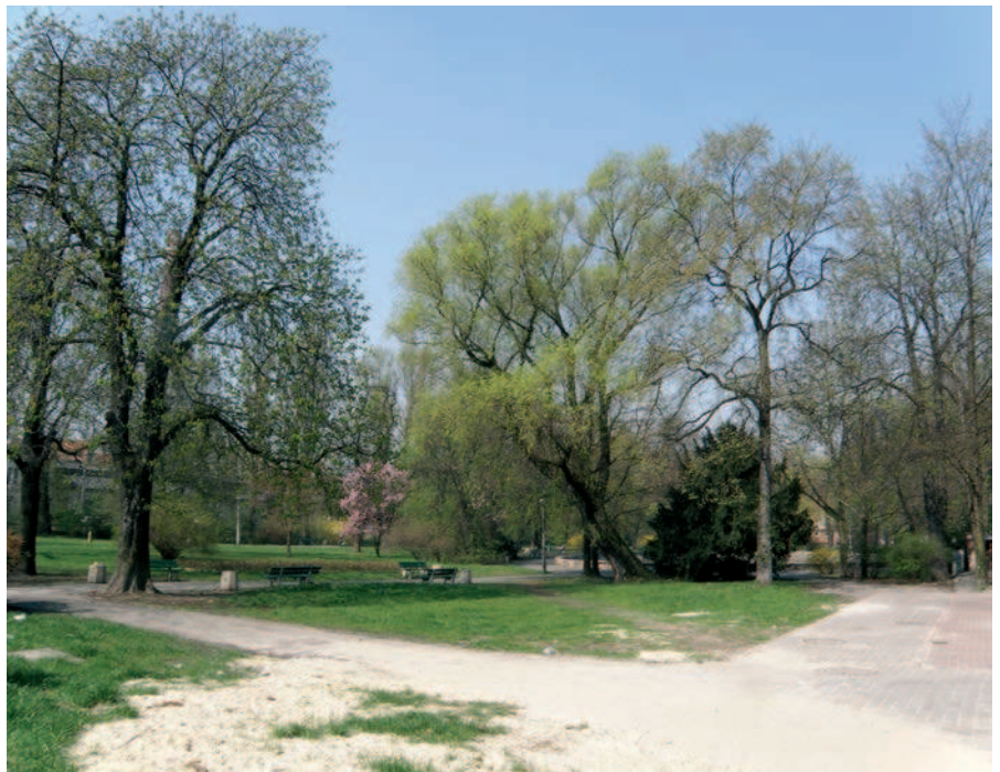
Fig. 3. Katowice, Nikiszowiec housing estate

Wśród ogrodów wypoczynkowo-produkcyjnych, nazywanych pracowniczymi ( Arbeiersgärten ), wyodrębnić można trzy główne grupy. Pierwsza z nich to niewielkie ogrody przydomowe, zazwyczaj towarzyszące niskiej zabudowie, o charakterze wiejskim, składające się z ozdobnego przedogródka oraz właściwego ogrodu użytkowego z zabudowaniami gospodarczymi za domem (Zabrze, Rokitnica). Odmiennie funkcjonowały ogrody blokowe. Wyróżnić wśród nich można ogrody: 1. śródblokowe (otoczone z czterech stron blokami zabudowy,