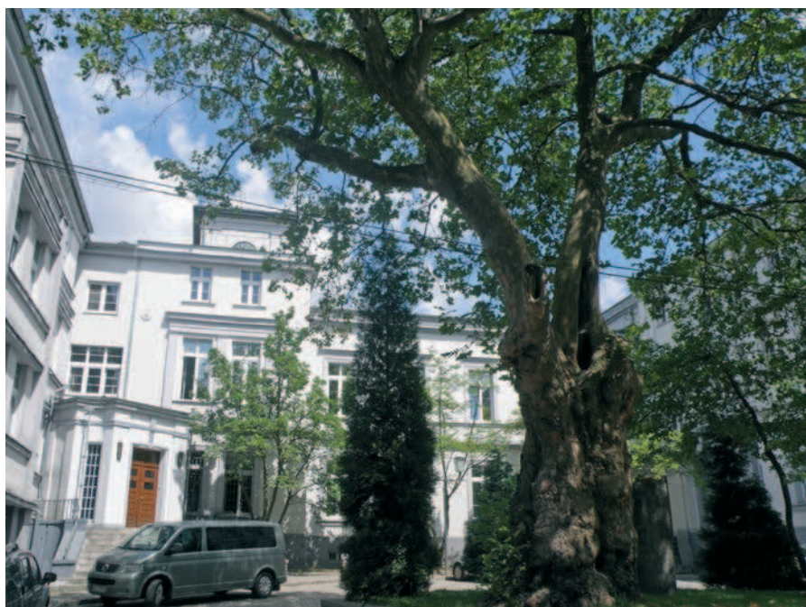
Ryc. 1. Zabrze, Zieleń przy budynku Zarządu Koncernu Borsiga

wpływało na lokalizację zakładów i ich kolonii w pobliżu obszarów zalesionych. Zastosowanie węgla jako paliwa do pieców hutniczych, wprowadzenie maszyn parowych do użytku w kopalniach, wynalezienie nowych metod wytopu cynku (opracowanych pod koniec XVIII wieku), skutkowało lokowaniem hut w bezpośrednim sąsiedztwie kopalń. Zieleń urządzona o charakterze reprezentacyjnym zaczęła towarzyszyć rezydencjom ich właścicieli lub dyrektorów oraz siedzibom spółek i zarządków. Zmniejszenie kosztów utrzymania oraz przywiązanie pracownika do zakładu zapewnić miały ogródki przydomowe w pierwszych osadach robotniczych o formie ulicówek, ogrody pracownicze wewnątrz zabudowy koszarowej, jak i duże zespoły ogrodów szreberowskich. Duża koncentracja ludności ośrodków przemysłowych, lokalizowanie osiedli przy zakładach, prowizoryczne i ciasne mieszkania przykładowe potęgowały narastające problemy społeczne, sanitarno- higieniczne i urbanistyczne. Zaradzić im miały ustawy i rozporządzenia regulujące warunki mieszkaniowe robotników oraz pojawiające się od początku XIX wieku idee utopijnego socjalizmu [Syrkus 1984]. Doprowadziło to szerszego zainteresowania urbanistyką i architekturą układów przemysłowych, a przez to do powstania szeregu teoretycznych koncepcji, jak i realizacji kolonii robotniczych, w których zieleni posiadała walor nie tylko kompozycyjny, kulturowo-