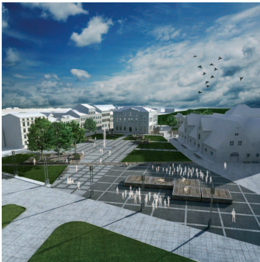
Ryc. 4. Widok placu od strony północnej. Platformy pozwalają na różnorodne wykorzystanie przestrzeni publicznej.

wojskowym przenoszone na placu przed zbrojownią, są teraz elementem modyfikowalnej aranżacji placu. Użytkownicy mogą przemieszczać platformy i zestawiać je zależnie od potrzeby. Raz platformy zsunięte na środek placu są sceną widowiskową lub parkietem tanecznym, innym razem stają się wybiegiem mody, kiedy indziej swobodnie rozsunięte są intymnymi gabinetami ze stolikami gdzie pijąc herbatę przyglądamy się