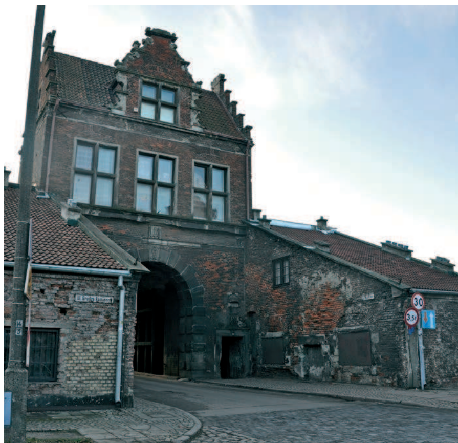
Ryc. 1. Brama Nizinna widziana od strony północnej

Na wstępie warto wyraźnie podkreślić tożsamość lokalną Placu Wałowego jako miejsca o niezatartej własnej odrębności przy jednoczesnym bardzo silnym powiązaniu z centrum Gdańska. Związek ten czytelny jest zarówno w sferze symbolicznej – Plac Wałowy jako brama