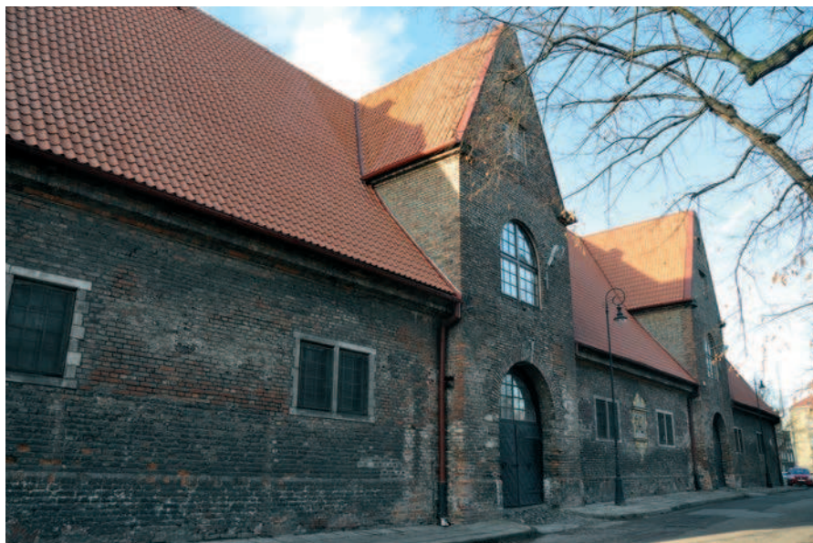
Fig. 2. Small Armoury building, built in the years 1643-1645 originally served as military headquarters. Now is the seat of Gdansk Academy of Fine Arts. Is an important element in Wałowy Square urban composition