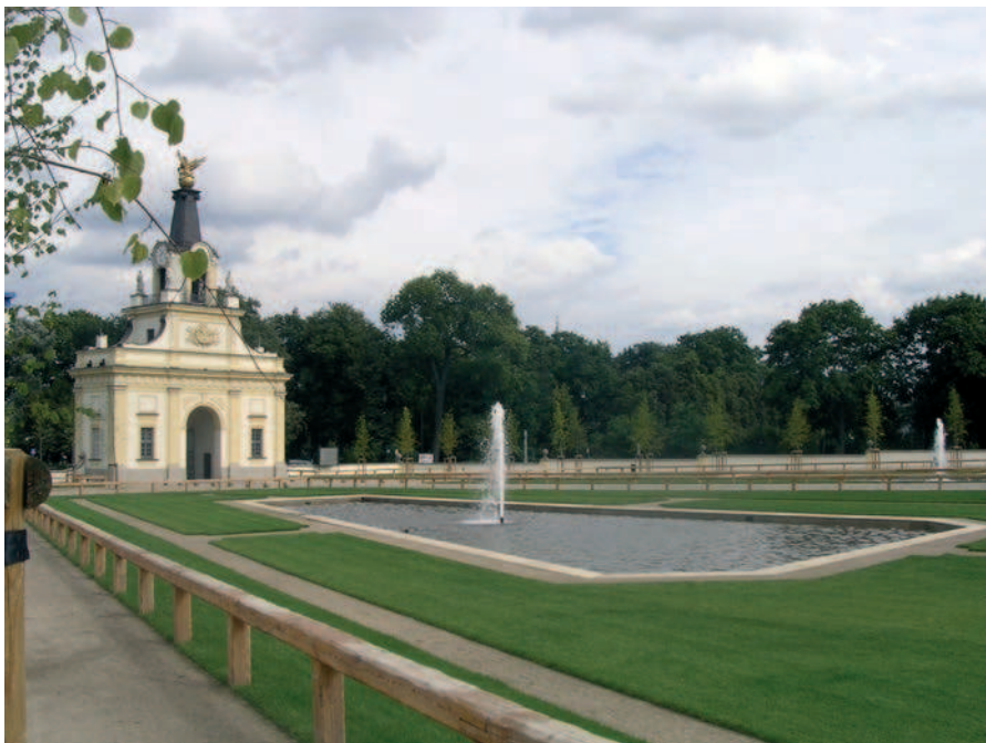
Ryc. 2. Avant court po zakończeniu prac konserwatorskich, 2010 r.