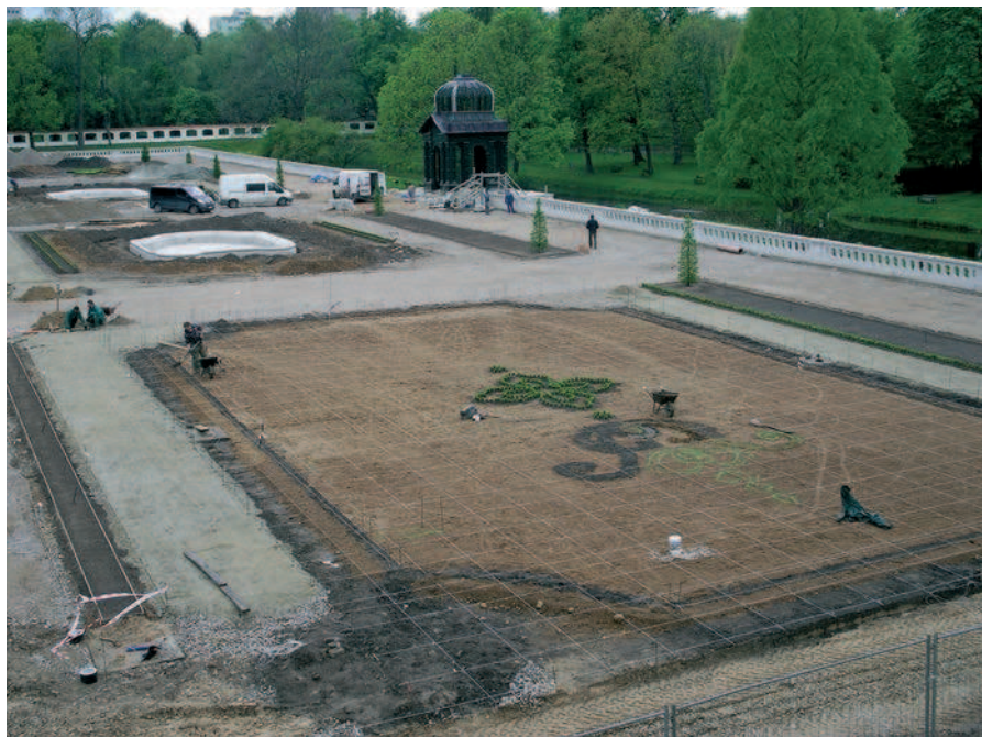
Fig. 4. Planting of the broderie parterres, 2011

taras dawnego Pawilonu Chińskiego, fundamenty Pawilonu nad Kanalem, kamienne obrzeża dróg w boskie-tach. Nawarstwienia dziewiętnastowieczne to przede wszystkim ponad stuletni samosiew oraz budynek Instytutu Panien Szlacheckich, bezpośrednio przylegający do ogrodu. Nawarstwienia dwudziestowieczne to głównie obiekty powstałe w wyniku prac konserwatorskich, przeprowadzonych po II wojnie światowej: most nad kanałem, Pawilon Toskański, Pawilon Włoski (z wbudowanymi relikwiami osiemnastowiecznymi), betonowe fontanny i betonowa balustrada w salonie ogrodowym, ogrodzenie Ogrodu Branickich. Ogólny stan techniczny ogrodu i jego wyposażenia oceniano w końcu lat 90. XX w. jako zły, co stało się przyczyną podjęcia ponownych prac konserwatorskich.