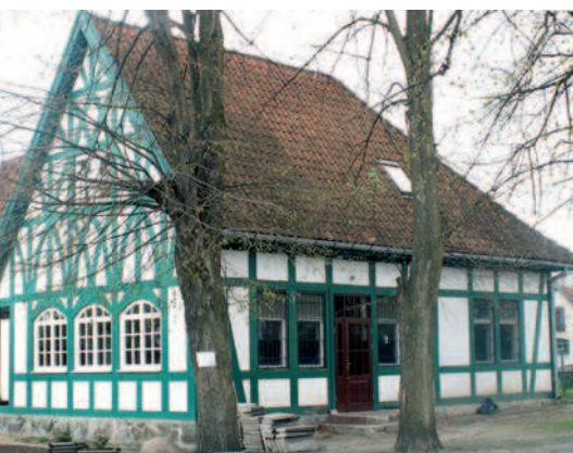
Ryc. 6. Kadyny. Dawna gospoda wzniesiona w konstrukcji ryglowej