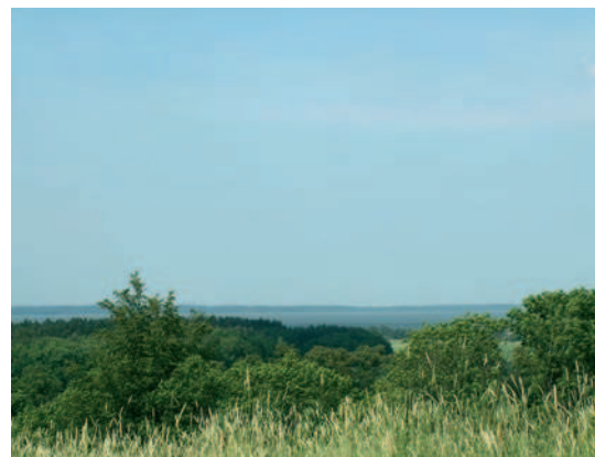
Fig. 8. The open view from Muldenberg Hill toward Vistula Lagoon