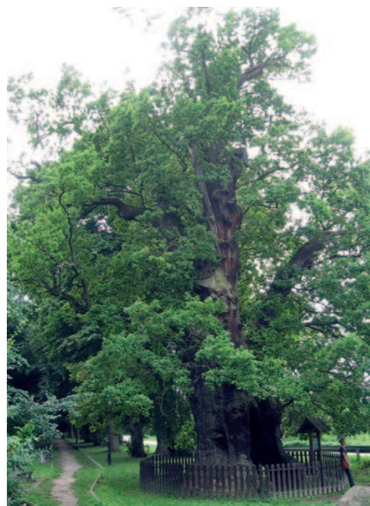
Ryc. 9. Kadyny. Pomnikowy Dąb Jana Bażyńskiego