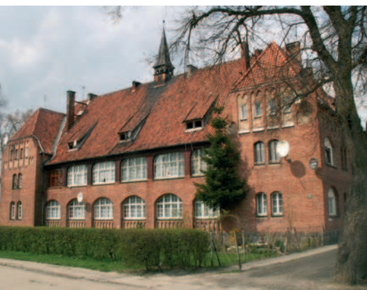
Ryc. 5. Kadyny. Dawny dom starców, wg projektu Steinbrechta