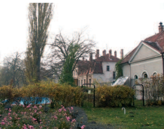
Fig. 10. The view of palace. Present state of former French style garden

wyjściu ze wzniesienia Muldenberg na polanę, rozciąga się przepiękny widok w kierunku Zalewu Wiślanego (ryc. 8).