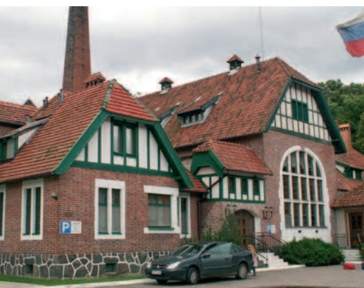
Ryc. 7. Kadyny. Gorzelnia w zespole zabudowy folwarczej