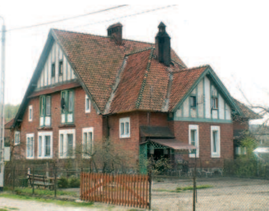
Ryc. 4. Kadyny. Przykładowa zabudowa wzniesiona w stylu gotyku angielskiego