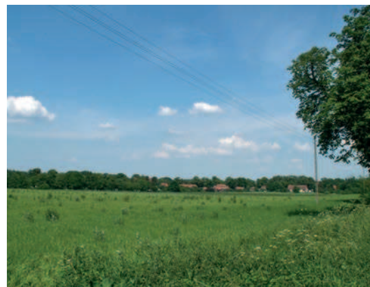
Fig. 2. Panorama of Kadyny village, view from Elbląg's Road

utworzonego w 1972 roku rezerwatu „Kadyński Las”.