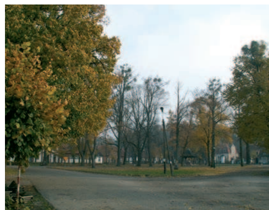
Ryc. 3. Kadyny. Widok na plac centralny stanowiący węzeł kompozycyjny układu przestrzennego wsi

Miejscowość składa się z dwóch wyodrębnionych układów przestrzennych. Pierwszy znajduje się na północnym zachodzie i tworzy go zabudowa wiejska usytuowana na terenach nizinnych zajętych przez podmokłe łąki oraz naturalny masyw leśny. Część południowo-wschodnią Kadyn tworzy zespół pałacowo-parkowy wraz z rozległym folwarkiem.