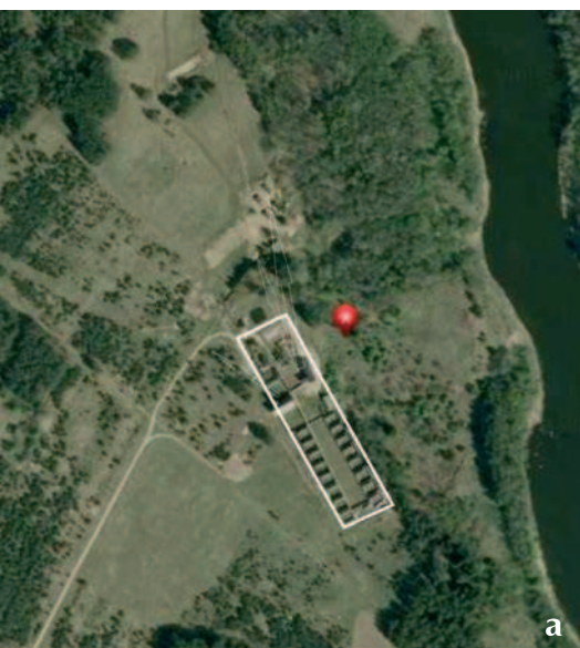
Fig. 1. Monastic Community of Bethlehem closter in Paparčiai, Lithuania, a – diagram showing area of the monastery and the landscape developed by the Sisters marked by the arrows (B. J. Gawryszewska based on orthophotos from Maps.lt); b – hermitage with a small garden; c – view of the monastery buildings