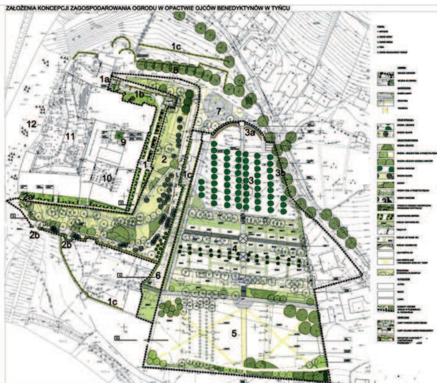
Fig. 4. Guidelines for conception of restoration of Benedictine Abbey Gardens in Tyniec (Gawryszewska B. J., Skibińska M., Podstolski W., 2008/09)