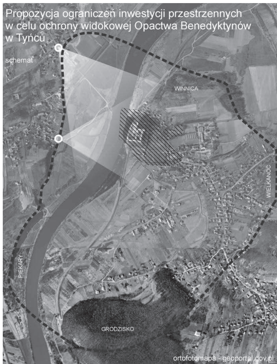
Fig. 3. Proposal of space investment limitation for scenic protection of Benedictine Abbey in Tyńiec (Skibińska M., Gawryszewska B. J., Rylke J., 2009)