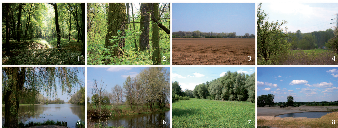
Fig. 1. Landscape and natural values of the Vistula valley in Wilanów region: 1 – Natolin Reserve; 2 – Morysin Reserve; 3 – Morysin fields; 4 – Warsaw Scarp; 5 – Wilanów Lake; 6 – the Wilanówka River; 7 – Riparian forests in the Wilanówka River valley; 8 – the Vistula River bank

Łukasza Drewny) i Nowoursynowska oraz system dawnych dróg lokalnych, który stał się podstawą dla współczesnej siatki ulic.