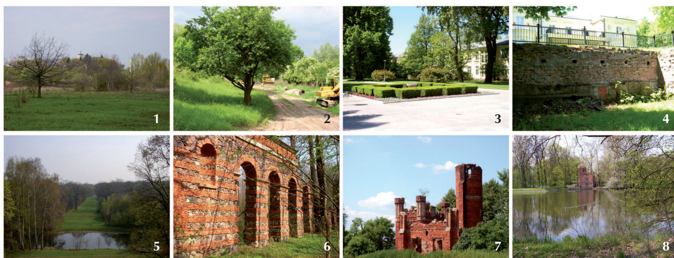
Ryc. 2. Wartości kulturowe i zabytkowe obszaru doliny wiślanej w rejonie Wilanowa: 1 – Kościół Świętej Katarzyny i ogród „Gucin-Gaj”; 2 – Ogród „Gucin-Gaj”; 3 – Park w Ursynowie; 4 – Pałac i taras w Ursynowie; 5 – Park w Natolinie; 6 – Akwedukt w Natolinie; 7 – Neogotycka brama w Morysinie; 8 – Budynek pompowni w parku w Wilanowie

niające wymogi ochrony jego wartości przyrodniczych i kulturowych. W planie ochrony Morysina należy uwzględnić zarówno zachowanie najważniejszych elementów jego kompozycji parku krajobrazowego, jak i pielęgnację upraw leśnych. Sąsiadujące z parkiem łąki, zlokalizowane na północ i północny zachód od niego oraz po wschodniej stronie Jeziora Wilanowskiego, mogą służyć jako miejsce imprez plenerowych oraz rekreacji i wypoczynku dla mieszkańców Wilanowa. Teren przedpola pałacowego powinien wypełnić program związany z recepcją i obsługą turystów oraz funkcjami pomocniczymi dla muzeum. Korzystne byłoby też usytuowanie parkingów dla gości odwiedzających historyczną rezydencję po jej północnej i południowej stronie.