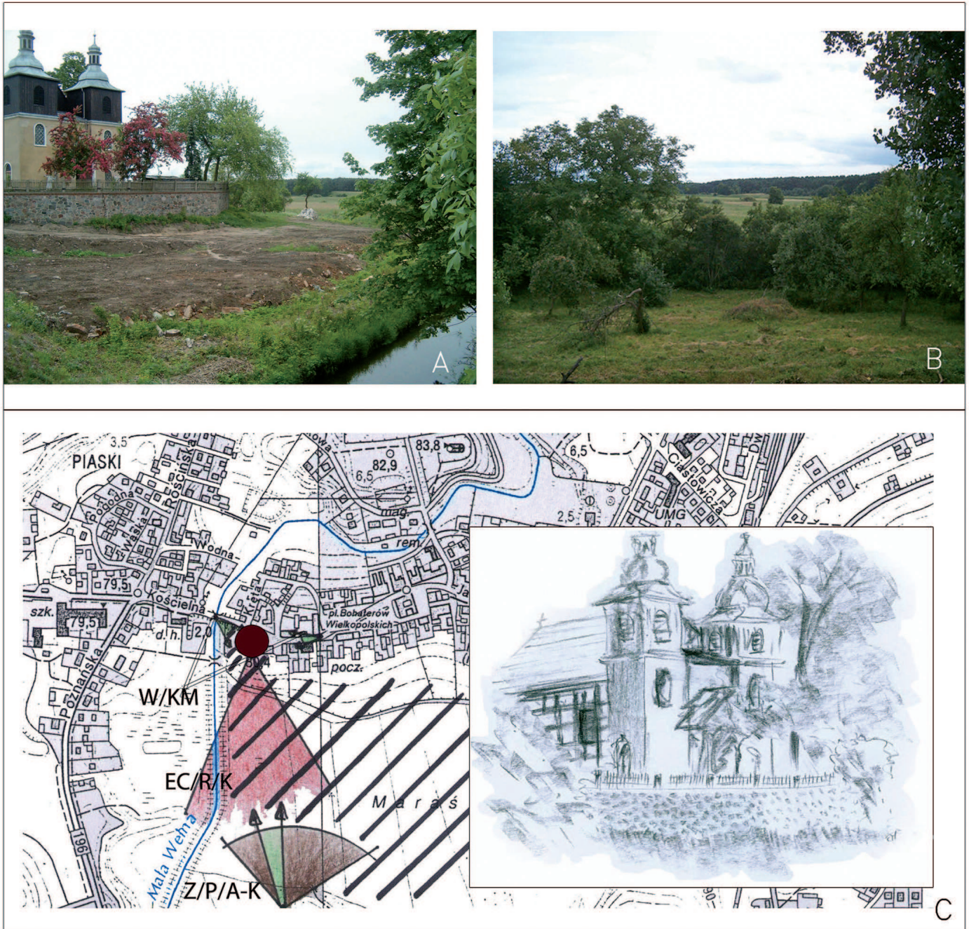
Ryc. 1. Skoki – bezpośrednia relacja widokowa, element wody widoczny: A – widok na kościół, B – widok spod kościoła, C – analiza cech ekspozycji krajobrazowej Fig. 1. Skoki – direct visual relation with visible water element: A – view towards the church, B – view from the church, C – the analysis of landscape exposition