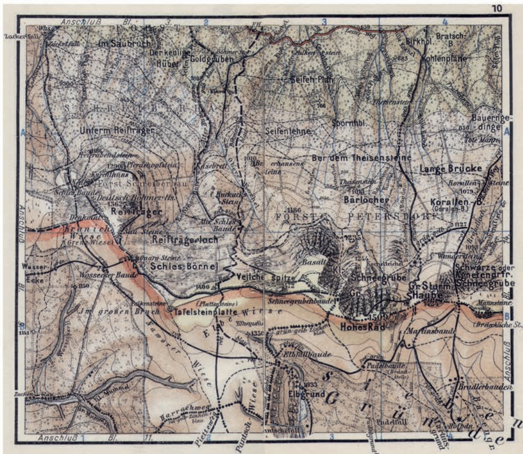
Ryc. 1. Mapa z Flemming Wanderatlas vom Riesengebirge sowie vom Isergebirge, Landeshuter und Raben- gebirge, 1:40 000, Rubezahl-Kunstverlag Höckendorf & Co., 1924 (zmniejszenie 1,4)