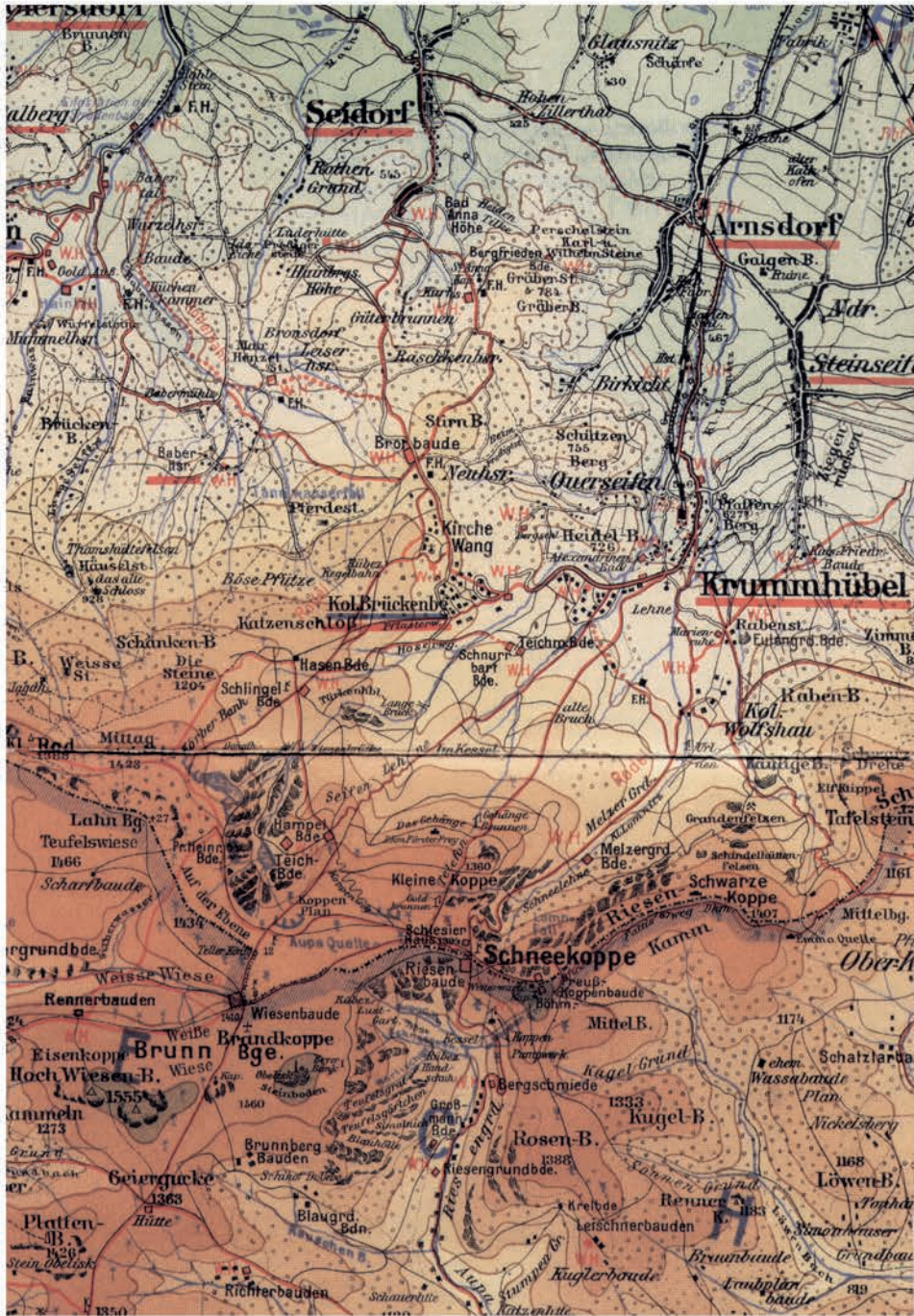
Ryc. 3. Fragment Köhlers Karte des Riesengebirges, 1:75 000, A. Köhler, Dresden [ok. 1926] (skala oryginalu)