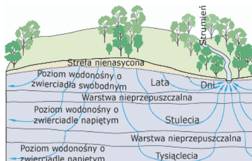
Rys. 2. Poziomy wód gruntowych w zależności od czasu przenikania wody Fig 2. Ground water level in depend on time of penetration