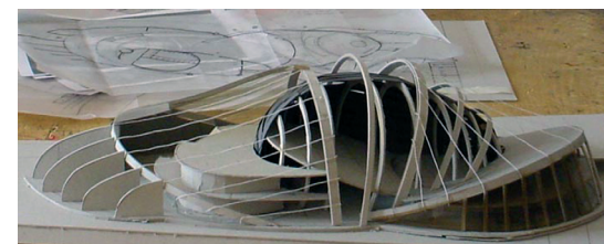
Rynek Sienny – projekt sali koncertowej Oprac. stud. Piotr Banasik pod kier. J. C. Żarnowieckiej

Sienny Market – southern frontage (2006)