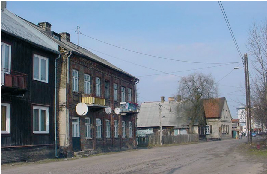
Pierzeja ulicy Młynowej (2006 r.)