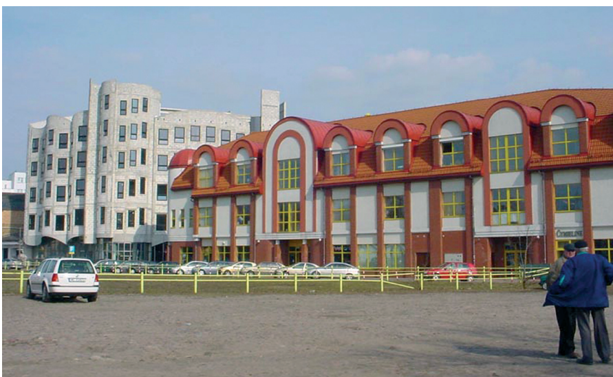
Rynek Sienny – pierzeja południowa (2006 r.)