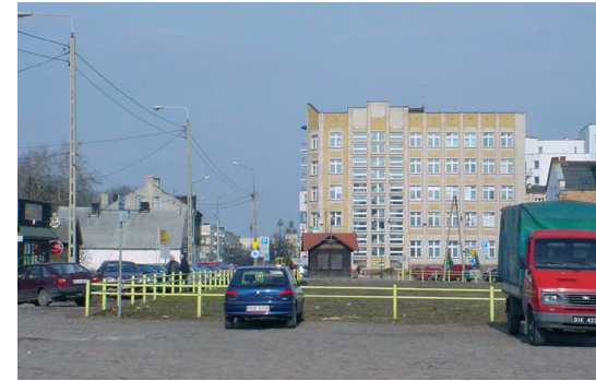
Rynek Sienny – pierzeja wschodnia (2006 r.)