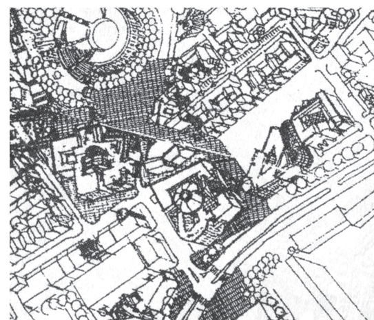
Fragment pracy konkursowej z 1995 r. [Kiluk 1996]