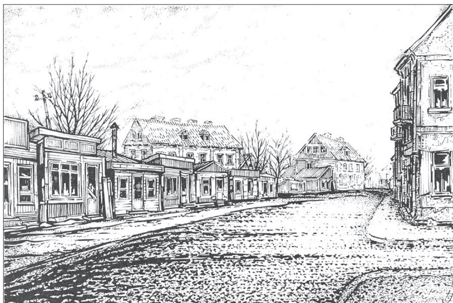
Fragment Siennego Rynku Autor: J. Lengiewicz [Tarasewicz 1983]