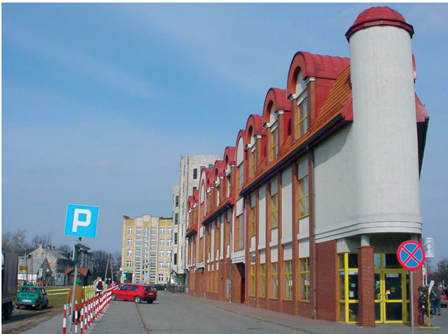
„Rynek Sienny” przy Ryнку Siennym (A. Kiluk) Fot. autorka

„Sienny Market” at Sienny Market (A. Kiluk)