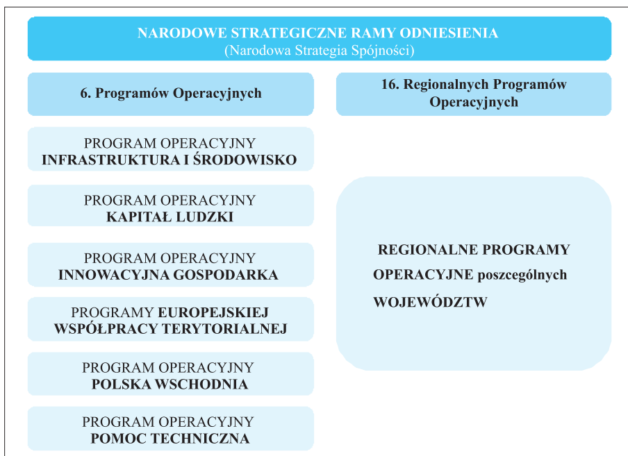
Rys. 3. Struktura wdrażania funduszy strukturalnych poprzez programy operacyjne w Polsce w latach 2007-2013 * Programy współpracy transgranicznej, transnarodowej, i międzyregionalnej

środków Funduszu Spójności oraz funduszy strukturalnych: Europejskiego Funduszu Rozwoju Regionalnego i Europejskiego Funduszu Społecznego. Polska opracowała projekty programów operacyjnych (PO), w których zawarto opisy priorytetów i działań, określających sposób osiągnięcia celów i strategii zapisanych w NSRO. Po konsultacjach społecznych i zakończeniu negocjacji z UE, dotyczących zapisów PO 5) [11], zostaną opublikowane tzw. Uszczegółowienia (w l. 2004-2006 zwane Uzupełnieniami PO), zawierające opis szczegółowych elementów na poziomie działań wdrażających poszczególne priorytety danego programu. W latach 2007-2013 środki z funduszy strukturalnych będą w Polsce wdrażane na dwóch równoległych poziomach: centralnym i regionalnym, w postaci 6 Programów Operacyjnych, zarządzanych przez Ministerstwo Rozwoju Regionalnego oraz 16 Regionalnych Programów Operacyjnych, zarządzanych przez zarządy województw.