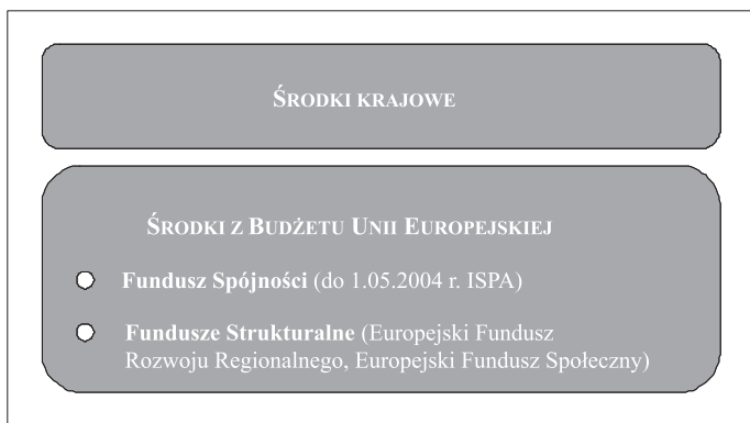
Rys. 1. Źródła finansowania przedsięwzięć z zakresu ochrony środowiska, w tym: edukacji ekologicznej, w latach 2007-2013

Źródła finansowania ochrony środowiska, w tym edukacji ekologicznej, są w Polsce zgrupowane w systemie, na który składają się przede wszystkim środki budżetu państwa, środki funduszy ekologicznych, EkoFunduszu i Banku Ochrony Środowiska. Od kilku lat są także do dyspozycji środki finansowe z budżetu Unii Europejskiej, traktowane zgodnie z zasadami Wspólnoty jako uzupełnienie środków krajowych. Warto podkreślić, że uzupełnienie bardzo znaczące.