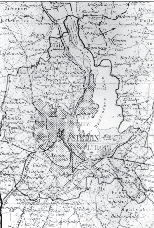
Administrative borders of Stettin from 1939