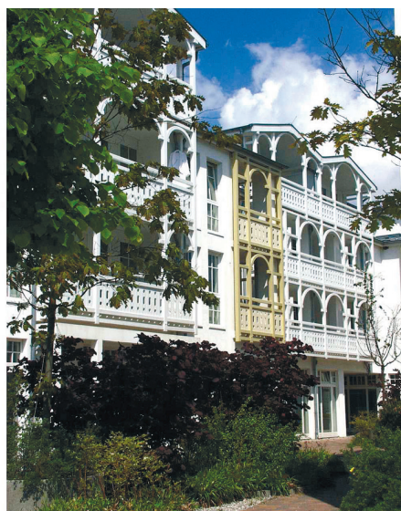
Wyspa Rugia: historyczna zabudowa przy Wilhelmstrasse w Sellin oraz nowo wybudowane osiedle Seepark na trasie: Sellin – Baabe