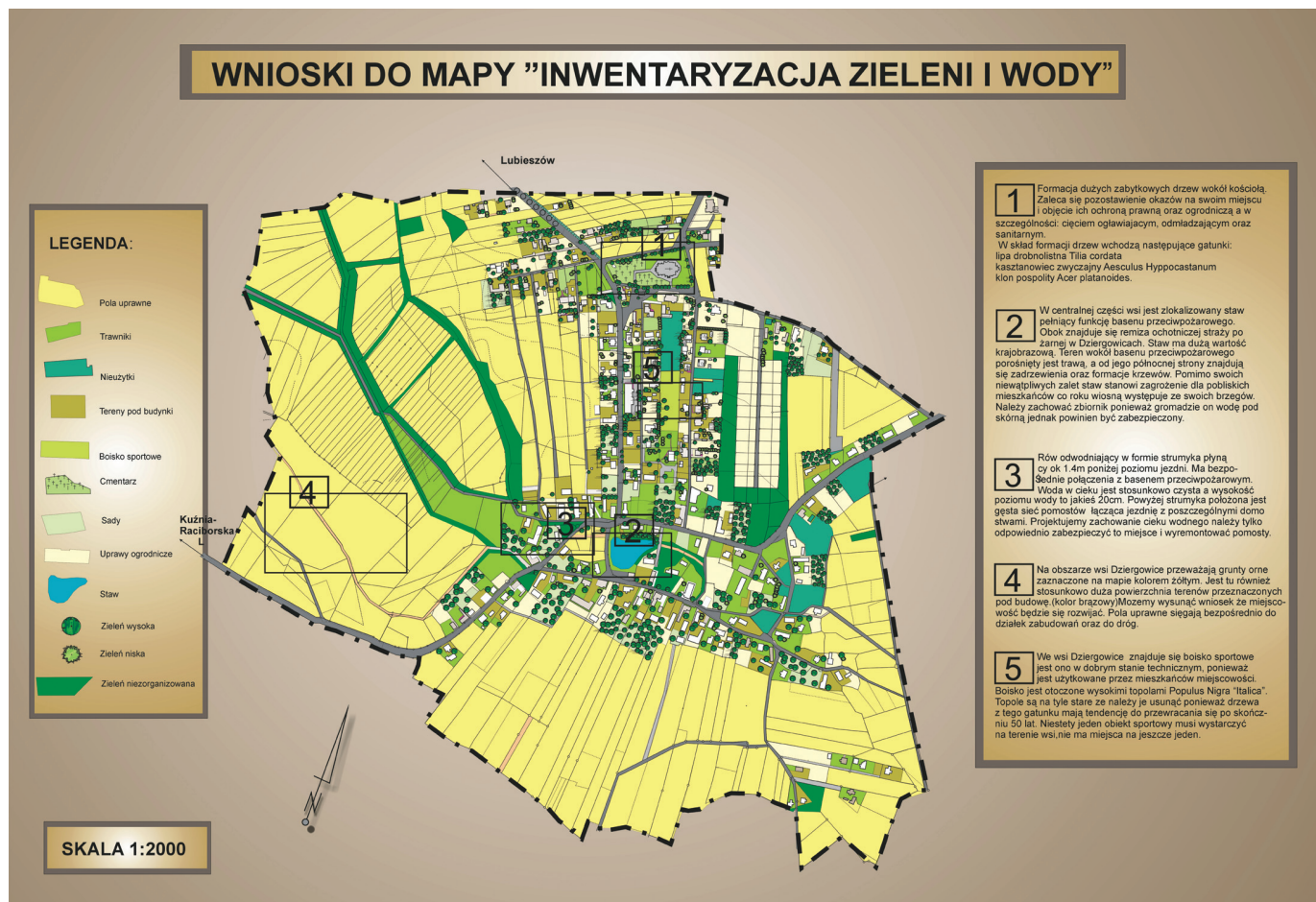
Wieś Dziergowice (gmina Bierawa). Jedna z plansz zawierająca analizy. Opracowanie studenckie