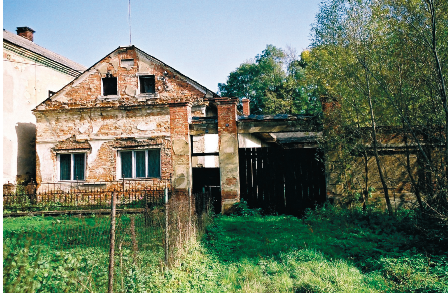
Stan obecny niektórych obiektów we wsi Pilszcz

Current state of some objects in Pilszcz village