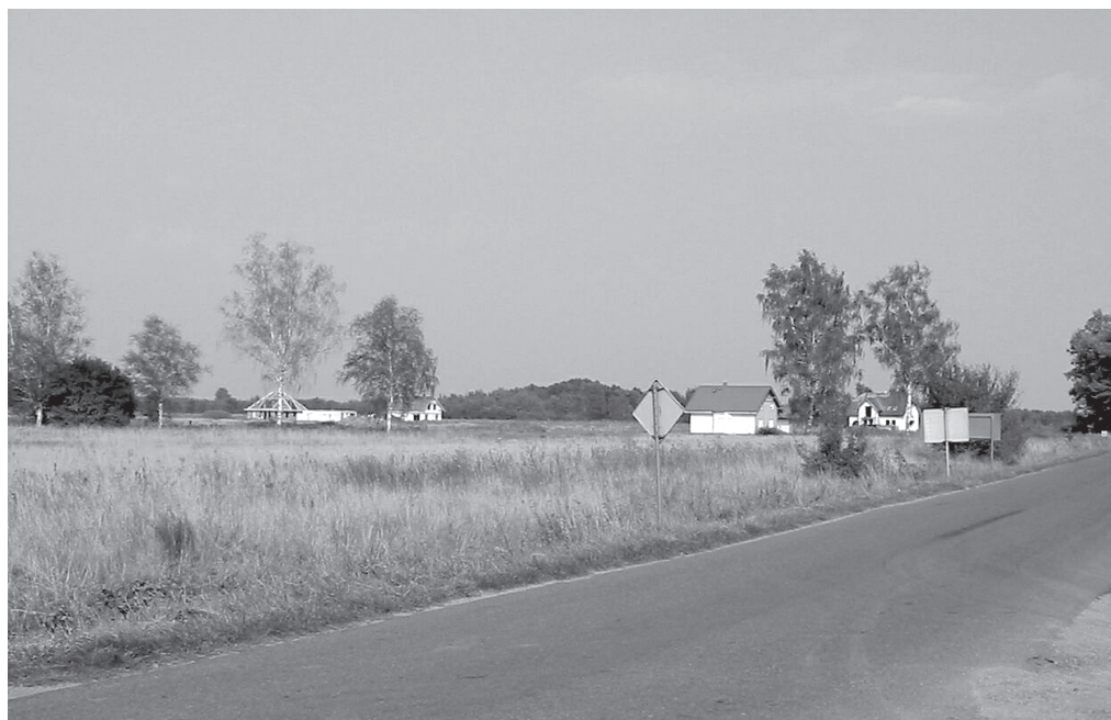
Droga Nadolice Wlk. – Chrzastawa: północne pasmo rozwoju sieci osadniczej na obszarze gminy Czernica.

Powstawanie nowych budynków w pobliżu ciągu północnego