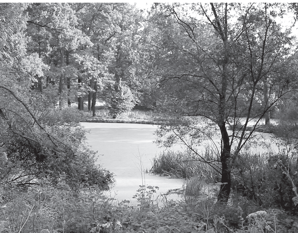
Rezerwat przyrody Eacha Jelcz : jeden z turystycznych i krajobrazowych walorów środowiska naturalnego w rejonie Jelcza-Laskowic.

Na obszarze obu omawianych gmin nie ma zakładów przemysłowych negatywnie oddziałujących na zanieczyszczenie wody i powietrza, a samorządy lokalne powiększają istniejącą infrastrukturę techniczną (budowa nowych sieci wodociągowych i kanalizacyjnych).