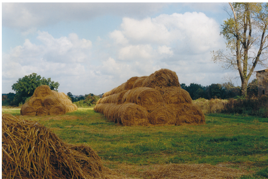
Słoma zwijana w kształcie walców pozostaje na polu przez zimę, widok w październiku we wsi Chróśnik k. Lubina

Straw furlled in the shape of a roll standing in a field during winter, a view in October in Chróśnik village near Lublin