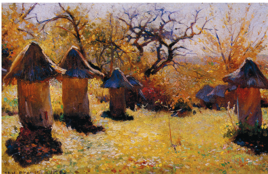
Jan Stanisławski: Ule na Ukrainie , ok. 1895 r.

Niektóre dawne obiekty wiejskie jeszcze zachowały się; w jednych rejonach w większym stopniu, w innych już tylko jako nieliczne relikty. Część z nich otoczona jest fachową opieką konserwatorską, na innych zaś widnieją tabliczki informujące o przyznaniu im rangi zabytku. W większości jednak ulega-