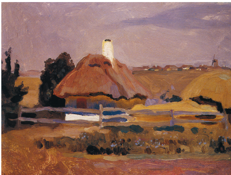
Jan Stanisławski: A hut in Popówka , about 1903