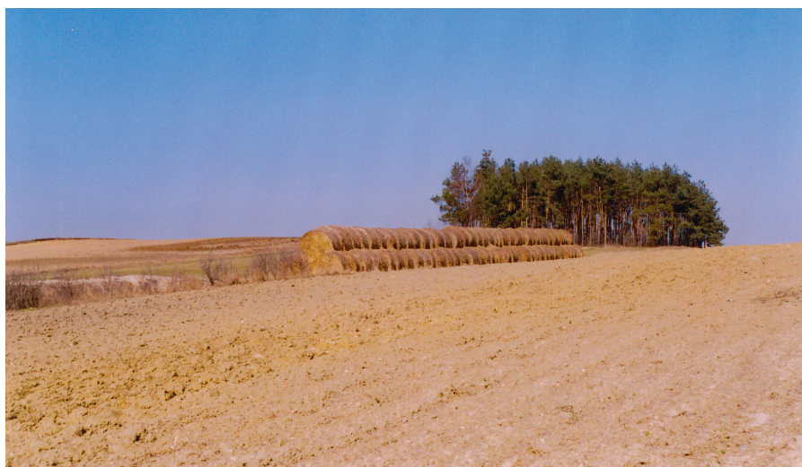
Składowanie słomy na polu, widok w kwietniu we wsi Parzynów (powiat ostrzeszowski w Wielkopolsce)

Istotną rolę w kształtowaniu krajobrazu wsi powinny odegrać miejscowe plany zagospodarowania przestrzennego. Z racji swoich uprawnień administracyjnych mogą