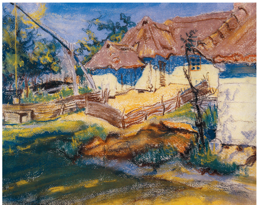
Stanisław Wyspiański: Chaty w Grębowie , 1900 r.

Szereg wsi było niegdyś niewielkimi osadami miejskimi, które w wyniku rozmaitych uwarunkowań podpadły z biegiem lat i utraciły swoje prawa miejskie. Obecnie można je wyróżnić spośród innych wsi ze względu na zachowany układ urbanistyczny uliczek rozchodzących się z centralnie usytuowanego rynku. Niektóre z tych wsi odzyskują obecnie swoje dawne prawa miejskie wykazując się odpowiednimi warunkami, m.in. rozwojem infrastruktury, liczbą ludności itp. Zdarza się też, że wsie, które tradycji miejskich nie miały otrzymują status miasta, przeważnie w oparciu o rozwój zakładów przemysłowych lub funkcji uzdrowiska.