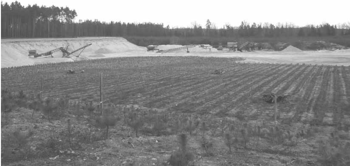
Rys. 2 Widok na infrastrukturę techniczną kopalni piasku na obszarze wyrobiska Novosedly nad Nežárkou

The first group is represented by small-scale intentions of extraction of sand (Fig. 2, Lapčík, 2008) and stone (Fig. 3, Lapčík, 2010); the second group is then represented by large-scale intentions. It is mostly the case of expanding the brown coal mining in opencast mines (Lapčík, 2005).