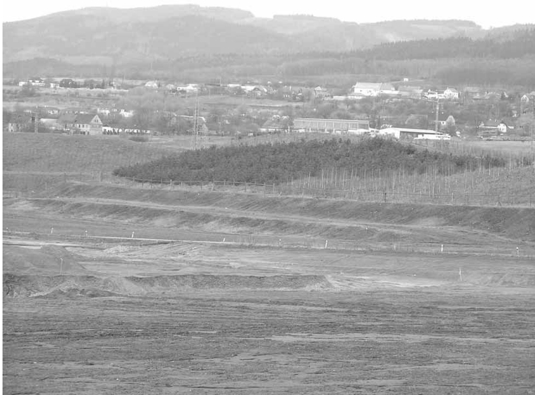
Rys. 4 Ziemne wały ochronne w mieście Černovice (północne Czechy)