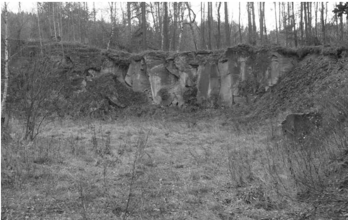
Rys. 3 Widok na wyrobisko poeksploatacyjne piaskowca w Chotěvicích