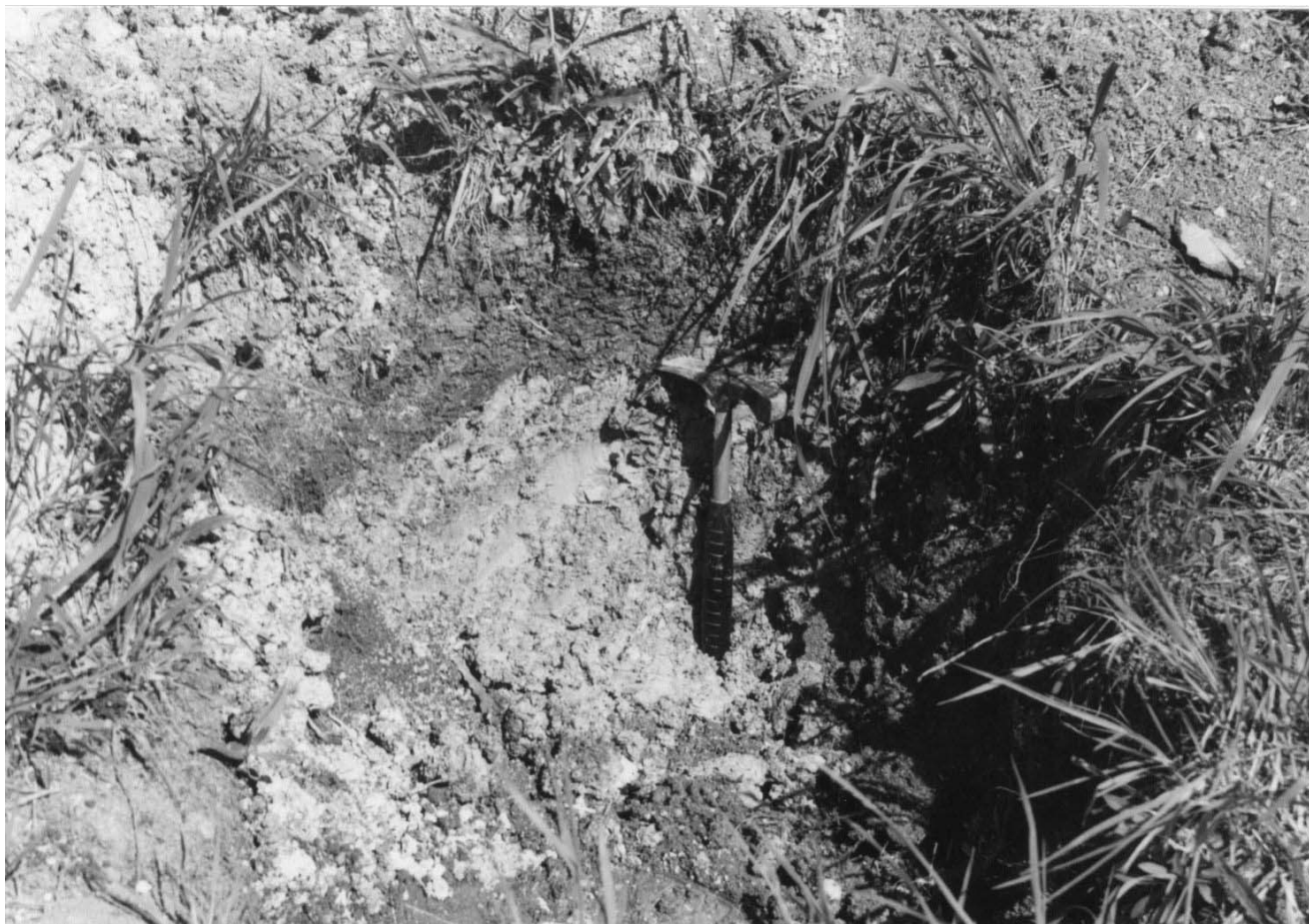
Rys. 3 Rekultywacja powierzchni (rejon Radovesice)

originally ploughed in marlite and the final mixture is increased by a real depth 0.6 – 1.0 metres.