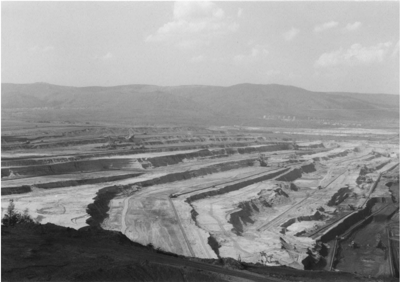
Rys. 2 Eksploatacja nadkładu w kopalni odkrywkowej Bilina