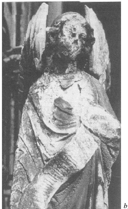
Rys. 1 Mikrobiologiczna deterioracja posągu anioła z portalu katedry w Kolonii, Niemcy; porównanie z dokumentacją z 1880 r. ( http://www.nd.edu/~ssaddawi/Course499.htm )