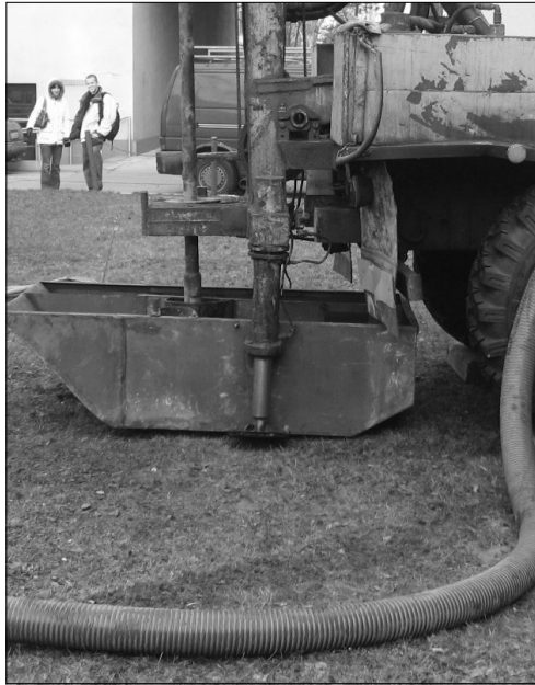
Rys. 3. Zbiornik na płuczkę powracającą z otworu wiertniczego

Użycie płuczki do wiercenia wymaga należytej staranności zwłaszcza podczas obsługi armatury płuczkowej, w tym zwrócenia szczególnej uwagi na stan szczelności połączeń (rys. 3). Rozszczelnienie przewodów może skutkować nieprzewidzianym gwałtownym wypływem płuczki pod wysokim ciśnieniem.