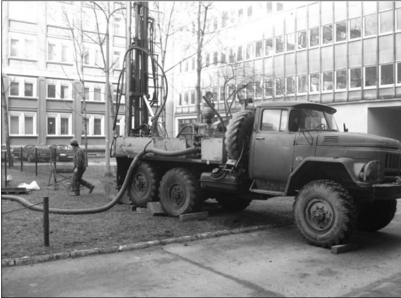
Rys. 1. Wykonywanie otworowego wymiennika ciepła otwór AGH LG2

Wymienione zagrożenia występujące podczas wykonywania otworowych wymienników ciepła (rys. 1) są nierozdzielnie związane z prowadzeniem prac wiertniczych i nie ma możliwości całkowitego ich wyeliminowania. Niebezpieczeństwom w czasie eksploatacji można zapobiegać m.in. przez odpowiednie i staranne wykonanie otworowych wymienników ciepła.