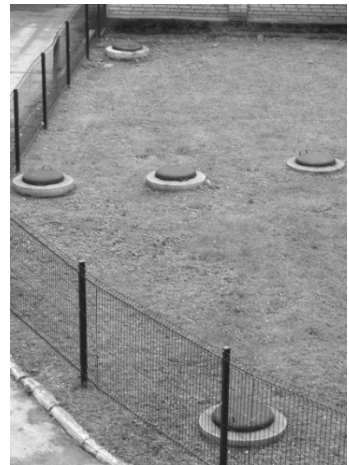
Rys. 2. Miejsce wykonania wymienników otworowych przed zakończeniem (a) i po zakończeniu prac (b)