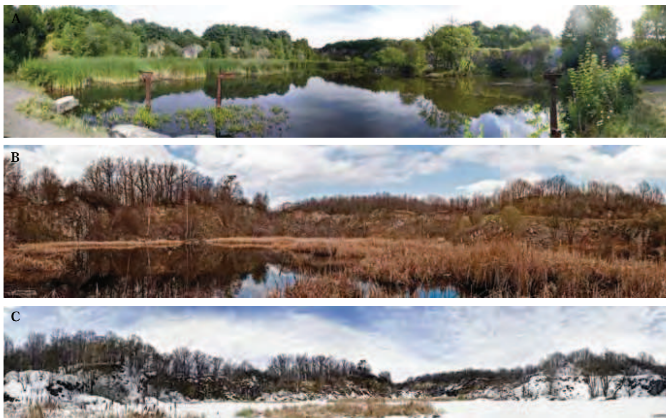
Fig. 3. Stan obecny kamieniołomu bazaltu w Strzegomiu – po rekultywacji wykonanej przez naturę, 3a – fot. K. Skolak, 3b, c – fot. S. Dzieniszewski • Recent state of basalt quarry in Strzegom after natural recultivation, 3a – phot. K. Skolak, 3b, c – phot. S. Dzieniszewski

Często są to tereny gminne, zaś gminy szukając możliwości zwiększenia budżetu, sprzedają takie tereny. W zależności od tego, jakie cele ma nowy inwestor, obszar ten może zostać przekształcony w składowisko odpadów (Fig. 4) lub wykorzystany zgodnie z jego potencjałem, czego przykładem jest dawny kamieniołom wapienia na Malcie (Skoczyła 2008) czy też doskonale zaprojektowane i wykonane, nowe zagospodarowanie kamieniołomu granitu w Hanzenberg w Niemczech (Fig. 5).