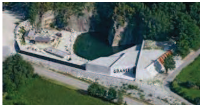
Fig. 5. Muzeum Centrum Granitu w Hanzenberg – przykład doskonałego wykorzystania nieczynnego wyrobiska • The museum Granite Center in Hanzenberg – an example of a perfect use of an abandoned quarry

Jak wspomniano na początku, od 2010 roku kamieniołom jest własnością prywatną. Obecnie opiekę nad tym miejscem sprawuje firma Granex Sp. z o.o. ze Strzegomia, najbliższy sąsiad kamieniołomu bazaltu. Rozpoczęły się działania nad powołaniem fundacji, której najważniejszym celem statutowym będzie adaptacja terenu nieczynnego kamieniołomu i nadanie mu funkcji użytkowych. Założenie podstawowe adaptacji kamie-