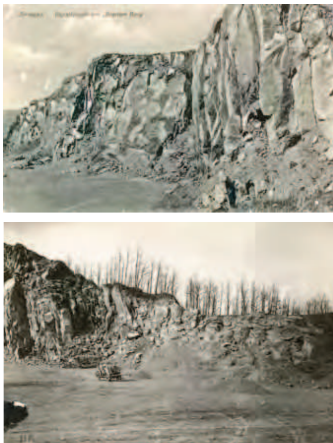
Fig. 2. Kamieniołom bazaltu na historycznych fotografiach, fot. ze zbiorów K. Skolaka • Historic photographs of the basalt quarry, phot. from the K. Skolak collection

Minerały nieprzezroczyste rozproszone są w obrębie całej skały. Drobne (0,3–0,8 mm) kryształki oliwinu dominują wśród fenokryształów. Nieco mniejsze, równie świeże fenokryształy augitu wykazują wyraźną strukturę strefową (Birkenmajer et al. 2004).