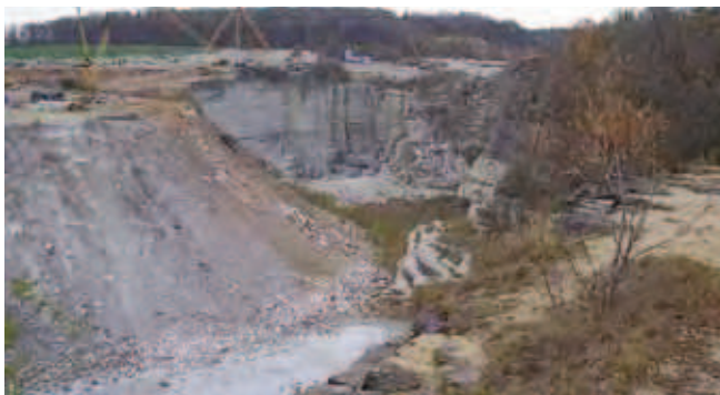
Fig. 4. Kamieniołom Barcz, niegdyś jeden z najgłębszych kamieniołomów granitu i świadectwo przemysłowego krajobrazu górniczego, obecnie zasypywany i dewastowany przez odpady budowlane, fot. E. Szczepański • The Barcz quarry, in the past one of deepest granite quarries and evidence of the industrial mining landscape, recently is successively filled and devastated by industrial waste, phot. E. Szczepański

Zagospodarowywanie tego ekosystemu jest jak najbardziej możliwe i celowe, powinno jednak zapewnić stan względnej równowagi ekologicznej systemów przyrodniczych.