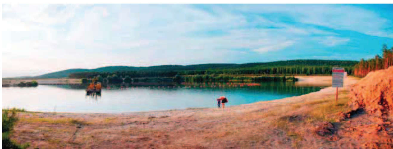
Fig. 6. Mosty – interesująca lokalizacja piaskowni w miejscowości Mosty, na tle wzgórz „Grzywy Korzeczkowskie”. Eksploatacja piasku czwartorzędowego spod wody, w okresie letnich upałów nielegalne kąpielisko • Mosty village – interesting location of sandpit in Mosty village, on the background “Grzywy Korzeczkowskie” hills. Underwater exploitation of the Quaternary sand. In the summer illegal bathing beach

Unikatowe walory, głównie w zakresie przyrody nieożywionej, zdecydowały o ustanowieniu tu aż ośmiu rezerwatów przyrody nieożywionej, w których obowiązuje ochrona częściowa. Są to rezerваты: „Karczówka”, „Góra Zelejowa”, „Góra Miedzianka”, „Jaskinia Raj”, „Miechowy”, „Biesak-Białogon”, „Góra Rzepka”, „Moczydło”, „Chelosiowa Jama”, „Góra Żakowa”.