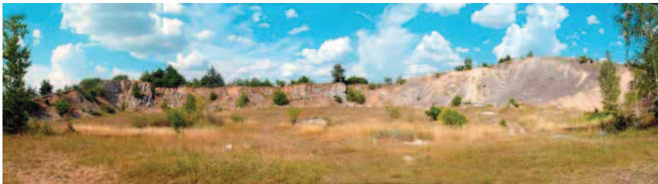
Fig. 5. Leśna Góra – Bardzo interesujący nieczynny kamieniołom na obszarze Leśnej Góry koło Podzamcza. Wzgórze zbudowane z wapieni górnourajskich (kimerydy), czasem zawierających krzemienie, fot. J. Nita • Very interesting abandoned quarry in Leśna Góra near Podzamcze. Hill is built by upper Jurassic limestone with flints, phot. J. Nita