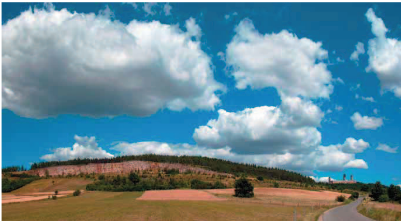
Fig. 4. Góra Rzepka – widok na nieczynny kamieniołom w okolicy Chęciny. Unikatowe wartości naukowe, dydaktyczne i krajobrazowe. Od roku 1981 rezerwat. Wzgórze zbudowane ze skał środkowo- i górnodewońskich dolomitów oraz wapieni. W szczytowej części wzniesienia występują pozostałości dawnego górnictwa kruczcowego rud ołowiu. Z prawej strony widoczne ruiny zamku w Chęcinach • Rzepka Hill – view on the abandoned quarry in Chęciny surroundings. Unique scientific, teaching and landscape values. Since 1981 reserve. Hill is built by middle and upper Devon dolomites and limestone. In the top hill remains of former mining (ores of lead). On the right – ruins of the castle in Chęciny

Brak odpowiedniego nadzoru ze strony służb ochrony przyrody i krajobrazu – tzw. ochrona bierna – może doprowadzić do zarastania kamieniołomów w wyniku naturalnych procesów sukcesji roślinności, przez co obiekty takie stają się niewidoczne w krajobrazie, np. Góra Zelejowa (Pietrzyk-Sokulska 2001, 2004; Stawicki 2003). Drugi przypadek dotyczy obiektów geologiczno-górnictwowych o unikatowych formach skalnych chronionych w postaci rezerwatów przyrody nieożywionej (dawniej rezerwatów geologicznych). W celu ochrony zasobów georóżnorodności możliwe jest tworzenie geostanowisk ( http://www.geosilesia.pl/295,geostanowiska_województwa_slaskiego ).