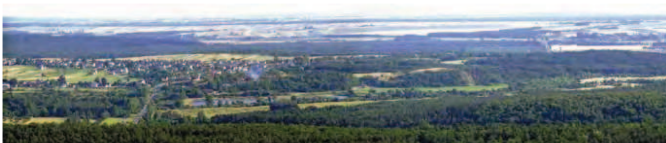
Fig. 3. Dolina Czarnej Nidy z zatopioną piaskownią oraz zwałowiskiem nieczynnego kamieniołomu w Tokarni • The Black Nida River valley with sunk sandpit and debris of the abounded quarry in Tokarnia

Georóżnorodność jest wartościowa z punktu widzenia różnorodności geologicznej, geoekologicznej, ekologicznej, dziedzictwa naturalnego, a nawet z punktu widzenia wartości naukowych, edukacyjnych, społecznych, kulturowych, turystycznych itd. Z tego względu georóżnorodność (jako krajobrazowa całość) powinna podlegać geoochronie w postaci geostanowiska lub geoparku dla obecnych i przyszłych pokoleń (Alexandrowicz 2006; Cañadas, Flaño 2007; Kostrzewski 1998; Kozłowski 1997; Rago 2008; Wróblewski 1999, 2000a,b; Zouros 2008; Zwoliński 2004, 2010). W tym kontekście za walory geoturystyczne należy uznać zespół elementów środowiska geograficznego powiązanych z budową geologiczną danego obszaru, które wspólnie lub każde z osobna mogą stać się przedmiotem zainteresowań turystów i mogą stanowić cel ruchu turystycznego.