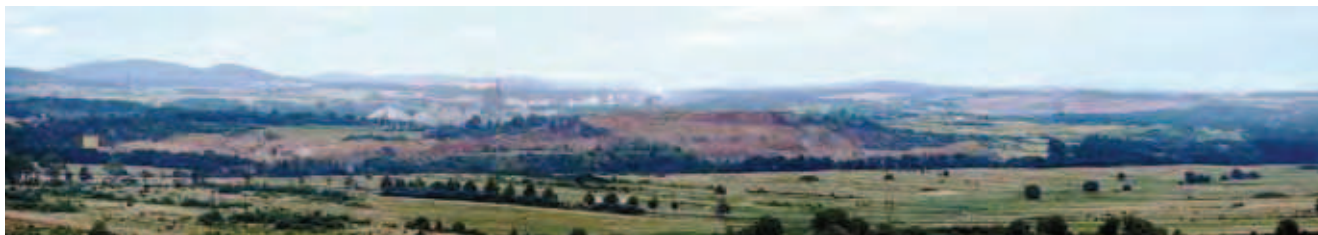
Fig. 2. Widok na największe kamieniołomy w okolicy Chęcińsko-Kieleckiego Parku Krajobrazowego; pierwszy plan Jaźwica, drugi plan z lewej – Trzuskawica, z prawej – Kowala, w dali Kielce, fot. J. Nita • View on the biggest quarries near Chęciny-Kielce Landscape Park; Jaźwica – the foreground, the background from left Trzuskawica, from right Kowala; on the horizon – Kielce, phot. J. Nita