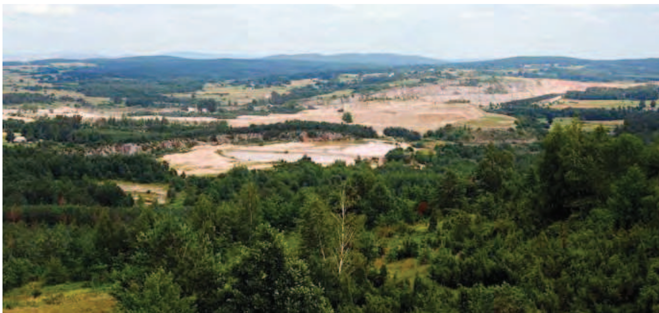
Fig. 7. Góra Ołowianka i Ostrówka – widok z Góry Miedzianka na nieczynny kamieniołom Ołowianka i kopalnię rud miedzi (Górki Sowie, kopalnia Zofia) oraz kamieniołom Ostrówka, za nią Góra Skałka w Gałęzicach • Ołowianka i Ostrówka hills – view from the Miedzianka hill on abandoned query Ołowianka and copper ores mine (Górki Sowie, mine Zofia) and Ostrówka query. On the background Skałka Hill in Gałęzice

Wszystkie te cele i rozwiązania reprezentuje region chęcińsko-kielecki. Pod względem dziedzictwa geologicznego region ten należy do najbogatszych w Polsce. Wielowiekowa działalność eksploatacyjna surowców skalnych wykształciła tu unikatowy krajobraz. Przedstawione powyżej przypadki dokumentują występujący w regionie potencjał mogący posłużyć rozwojowi turystyki i dydaktyki geologicznej oraz szeroko rozumianego krajoznawstwa. Wiele z miejsc czeka także na zagospodarowanie w kierunkach bardziej awangardowych i komercyjnych (przestrzenie kreatywne), w celu rozwoju szerszego spektrum funkcji np. wypromowania na ich terenie funkcji rekreacyjnej, sportowej, rozrywkowej, wypoczynkowej (np. tereny zieleni urządzonej – parki, ogrody botaniczne, amfiteatry itp.), a nawet budownictwa jednorodzinnego. Pod tym względem analizowany obszar ma szansę stać się modelowym w Polsce. Jego promocji służyć będzie na pewno projektowany geopark Dolina Kamiennej, którego rola może okazać się istotnym impulsem w aktywizacji gospodarczej całego regionu. □