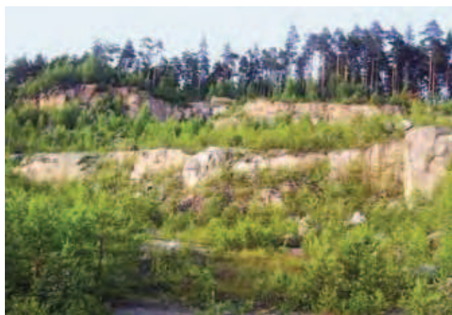
Fig. 11. Dobrze zaznaczony strop ławicy piaskowca w kamieniołomie w Szczytniej. Widok z wyżej leżącej ławicy • Very well marked top of the sandstone bed in the Szczytna quarry. A view from the upper bed

zać się niebezpieczna i nadzór kopalni wcale nie musi się na nią zgodzić.