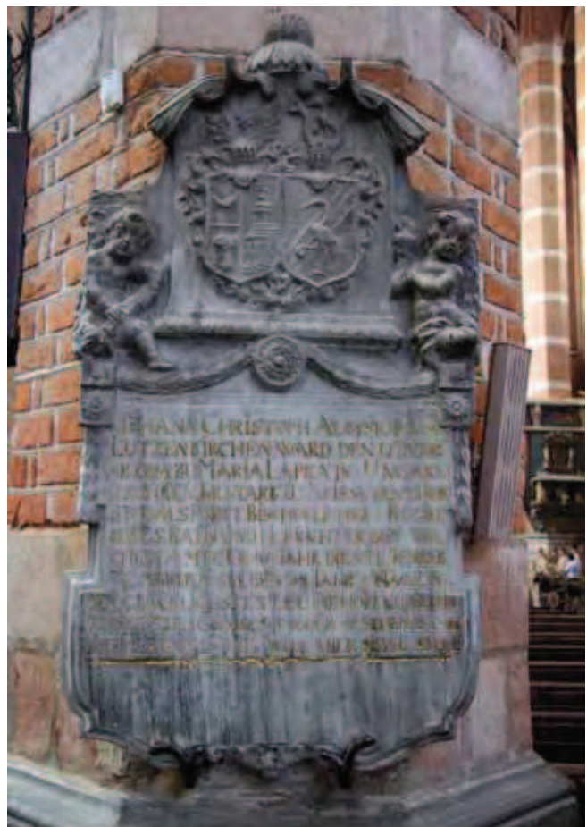
Fig. 6. Epitafium w katedrze w Nysie wykonane z marmuru sławniowickiego • Epitaph made of the Plawniowice marble in the Nysa Cathedral