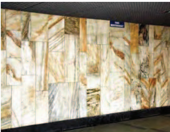
Fig. 5. Ściana przejścia dla pieszych pod placem Dominikańskim we Wrocławiu wyłożona jest marmurem „Marianna” • Wall of the pedestrian path under the Dominikański Square in Wrocław covered with the „Marianna” marble