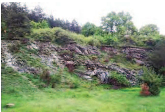
Fig. 16. Kamieniołom serpentynitu w Przemilowie • Serpentinite quarry in Przemilów