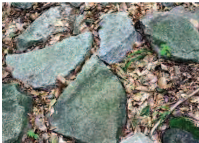
Fig. 8. Kamieniołom starożytny na zboczu Ślęzy i leżące w pobliżu fragmenty rozbitych kamieni żarnowych • Abandoned quarry on the Ślęża Hill slope. Note fragments of the broken mill-stones