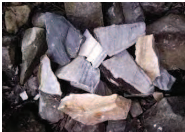
Fig. 14. Marmur z Przeworna, fot. S. Mazurek • The marble from Przeworno, phot. S. Mazurek

Do zdecydowanej większości z nich trudno dotrzeć, a dojazd w bezpośrednie sąsiedztwo jest wręcz niemożliwy i trzeba w końcowym etapie zdecydować się na kilkudziesięcominutową, pieszą wycieczkę. Tektonikę kredowych piaskowców Gór Stołowych proponujemy podziwiać w nieczynnym dziś kamieniołomie w Szczytniej, choć tak naprawdę, administracyjnie, położony on jest już na terenie Polanicy Zdrój. Dojazd do tego kamieniołomu jest bardzo dobry i trafić do niego łatwo. Ze Szczytniej, z drogi krajowej nr 8, skręcamy w ulicę Sienkiewicza, w kierunku Polanicy Zdrój. Po przejechaniu ok. 4 km, tuż za mostem nad wijącym się wzdłuż lewej strony drogi strumieniem, skręcamy ostro w lewo,