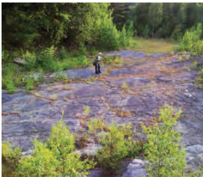
Fig. 12. Kamieniołom piaskowca w Szczytnie • The sandstone quarry in Szczytna