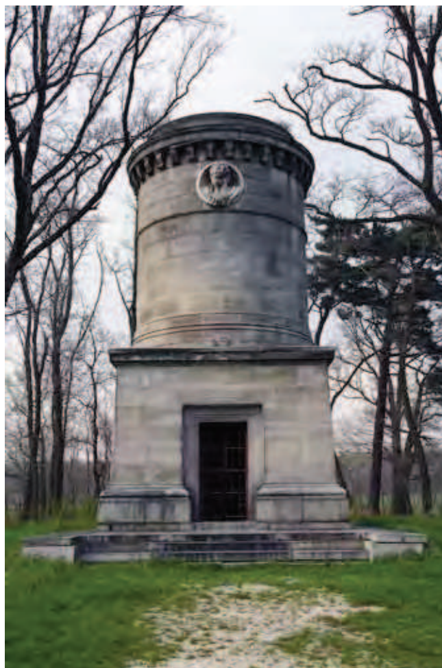
Fig. 10. Mauzoleum Blüchera w Krobielowicach, fot. M. W. Lorenc • The Blücher's mausoleum in Krobielowice, phot. M. W. Lorenc

Trudno dzisiaj zwykłemu turyście wejść w dowolnym czasie do czynnego kamieniołomu bez uprzedniego uzgodnienia tego z kierownictwem kopalni. Wycieczka taka może oka-