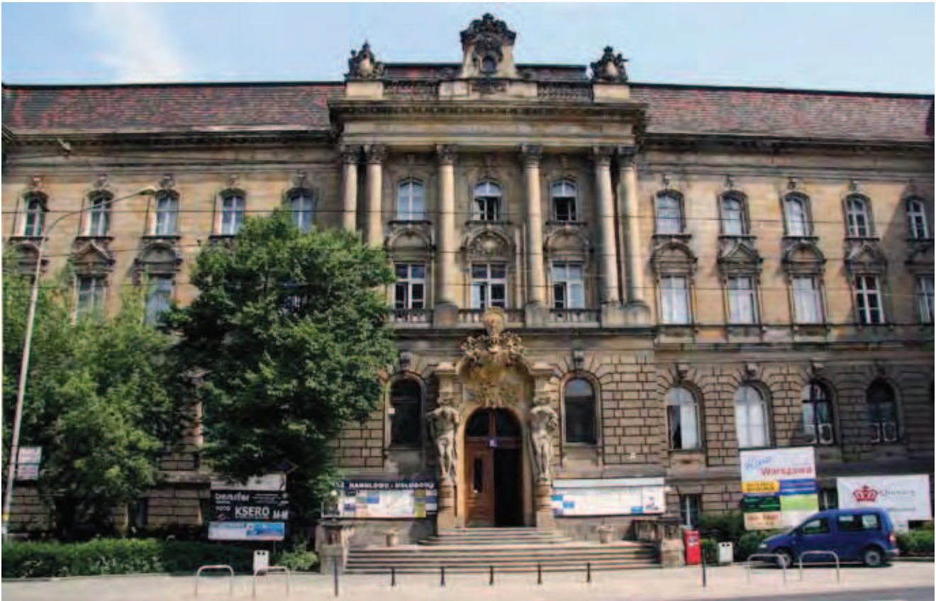
Fig. 4. Elewacja budynku NOT, Wrocław, ul. Piłsudskiego 74. Piaskowiec na budowę w latach 1894–1896 dostarczała firma Zeidler & Wimmel i określiła go jako „piaskowiec śląski” • Facade of the NOT building in Wrocław, Piłsudskiego Str. 74 made of so-called “Silesian sandstone” delivered by Zeidler & Wimmel firm in 1894–1896