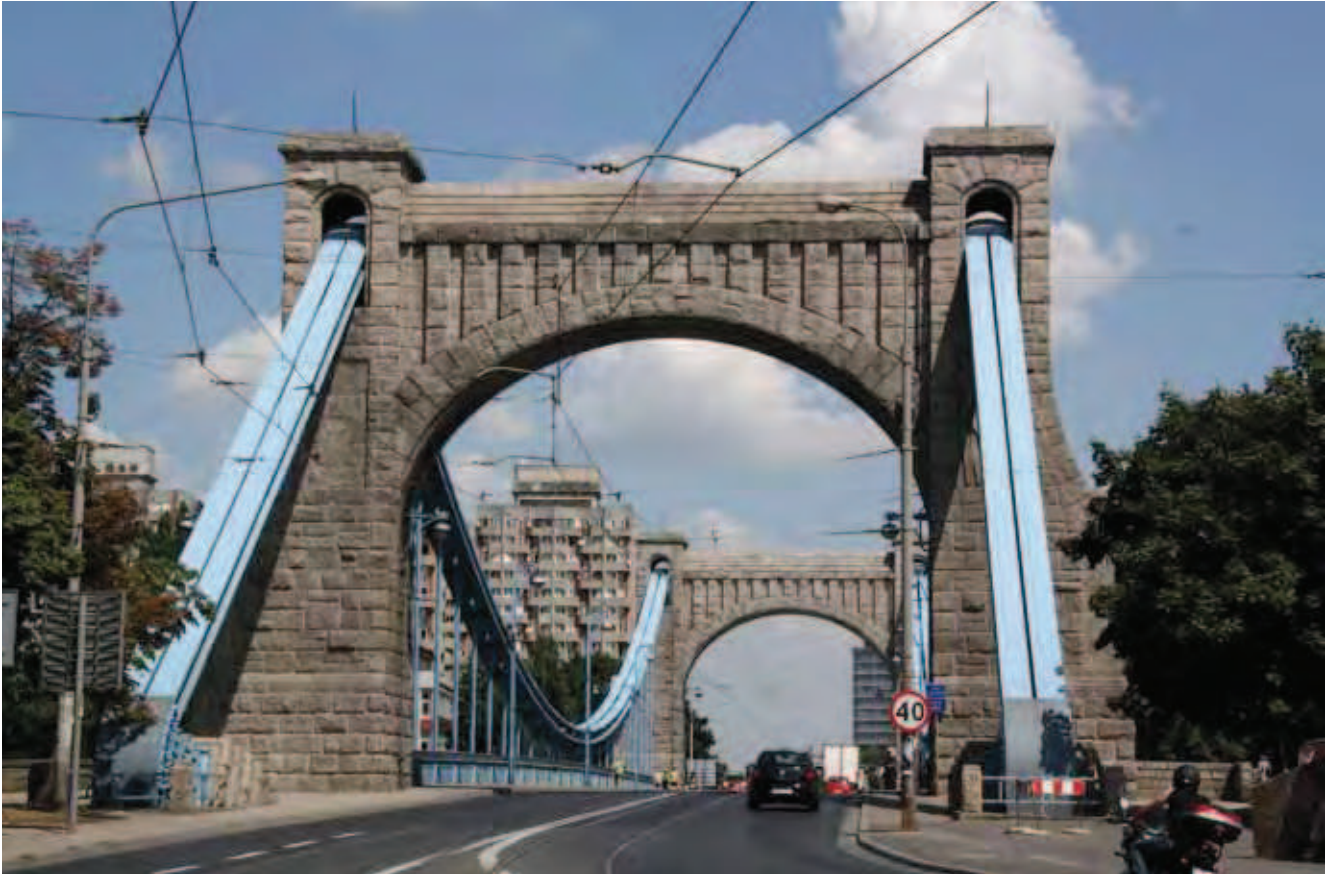
Fig. 2. Most Grunwaldzki we Wrocławiu. Pylony wykonane z granitu karkonoskiego • Pylons of the Grunwald Bridge in Wrocław built of the Karkonosze granite