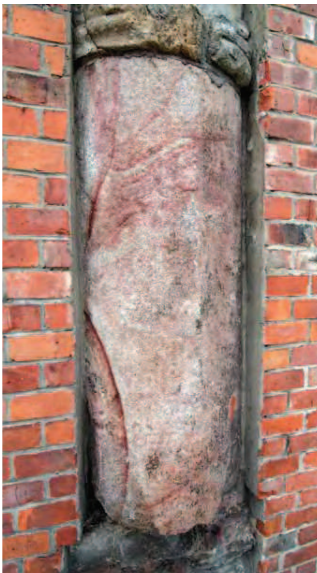
Fig. 9. Pochodząca z XIII w. kolumna z granitu ślęzańskiego w elewacji wschodniej budynku głównego Uniwersytetu Wrocławskiego, fot. S. Mazurek • 13th Century Ślęża granite column in the eastern wall of the Wrocław University building, phot. S. Mazurek

Bardzo wytrzymały czerwony piaskowiec, tzw. „Ślązak” od wieków wydobywa się w okolicach Nowej Rudy-Słupca koło Wałbrzycha. Wspaniałym przykładem zastosowania tego piaskowca jest wrocławski most Zwierzyniecki wybudowany w latach 1895–1897. Karl Klimm, projektant mostu, zastosował ten piaskowiec w czterech narożnych, potężnych obeliskach zdobionych secesyjnymi ornamentami (Fig. 3) (Encyklopedia Wrocławia 2000).