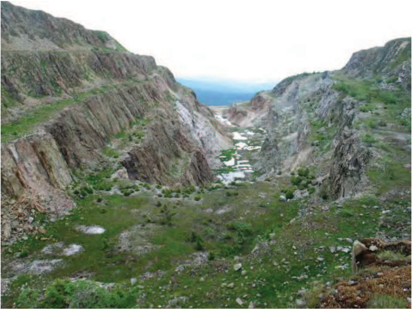
Fig. 19. Kamieniołom kwarcu w Górach Iżerskich • Quartz Quarry in the Iżera Mountains

Łatwo do niego trafić, gdyż położony jest w samym środku wsi, tuż przy drodze wiodącej z Sobótki przez Księginice Małe do Łagiewnik.