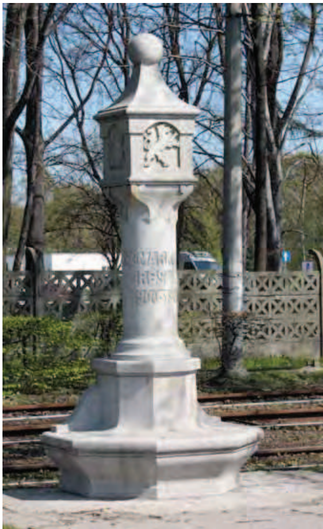
Fig. 1. „Gemarkung Breslau” – słup graniczny miasta. Jedna z trzech ocalałych, ustawionych na przełomie XIX i XX w., rogatek Wrocławia • „Gemarkung Breslau” – city border mark. One of three survived Wrocław border marks erected on the break of 19th and 20th century

Przyjmuje się, że kamieniołomy granitu istniały tu już od XII w. p.n.e. i funkcjonowały aż do XIII w. (Domański 1965). Dzisiaj eksploatuje się w tym rejonie kilka odmian granitu, których nazwy pochodzą od nazw miejscowości: „Strzegom”, „Borów”, „Rogoźnica”, „Morów”, „Kostrza”, „Strzeblów” czy „Zimnik”.