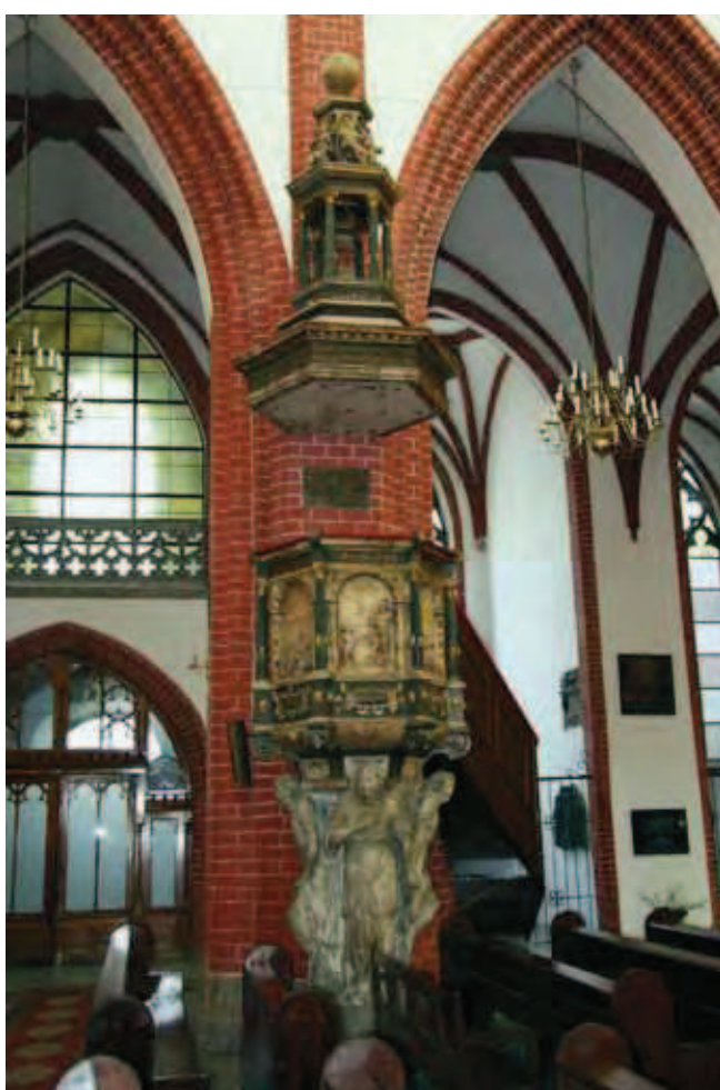
Fig. 17. Ambona w kościele św. Marii Magdaleny we Wrocławiu • Pulpit in the Wrocław St. Mary Magdalene church

W kamieniołomie doskonale widać ławice piaskowców od kilku do kilkunastu metrów grubości, o wyraźnej oddzielności ciosowej, tak charakterystyczne dla kredowych piaskowców z Gór Stołowych (Fig. 11). Z górnego pokładu piaskowca w kamieniołomie możemy przyjrzeć się rozległej powierzchni stropowej ławicy dolnej (Fig. 12).