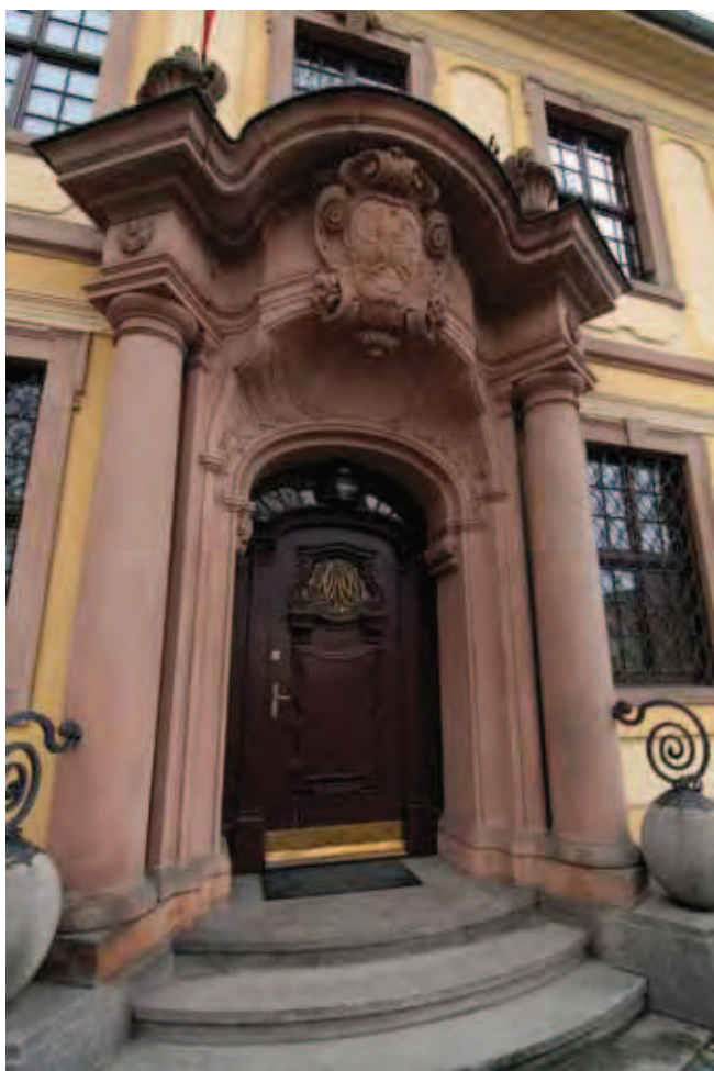
Fig. 13. Portal z czerwonego piaskowca z Gór Stołowych (Heuscheuer Sandstein) w budynku dziekanatu Wydziału Filologicznego Uniwersytetu Wrocławskiego od strony ul. Grodzkiej. Dziś taki piaskowiec czasami wydobywa się w kamieniołomie w Radkowie, fot. S. Mazurek • Portal made of the red Stołowe Mountains sandstone (known as Heuscheuer Sandstein. Faculty of Filology, Wrocław University, Grodzka Str. Recently such sandstone is exploited in some parts of the Radków quarry, phot. S. Mazurek

Aktualnie nie są to obiekty przygotowane na potrzeby masowej turystyki, więc wymagana jest wyjątkowa ostrożność i zachowanie elementarnych zasad bezpieczeństwa.