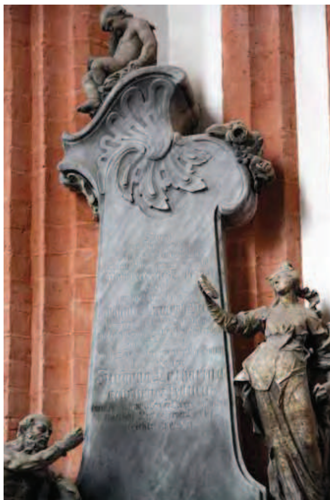
Fig. 15. Epitafium z marmuru Przeworno w bazylice św. Elżbiety we Wrocławiu • Przeworno marble epitaph in the Wrocław St. Elizabeth church

w tył, w polną drogę, która wiedzie już bezpośrednio do kamieniołomu. Do samego kamieniołomu nie dojdziemy samochodem, gdyż drogę zastawiono potężnym blokiem z piaskowca. Ostatnie 200 m pokonamy pieszo. Ta odmiana piaskowca z Gór Stołowych jest cenionym materiałem kwasoodpornym i ze względu na bardzo drobne uziarnienie była wykorzystywana także do produkcji tarcz szlifierskich.