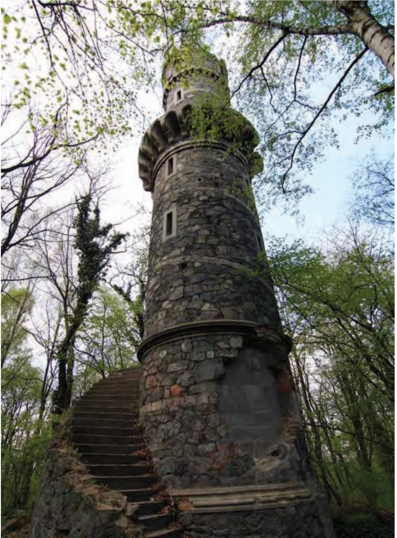
Fig. 18. Wieża Bismarcka na Jańskiej Górze wzniesiona z serpentynitu • The Bismarck Tower built of the serpentinite on the top of the Jańska Mountain