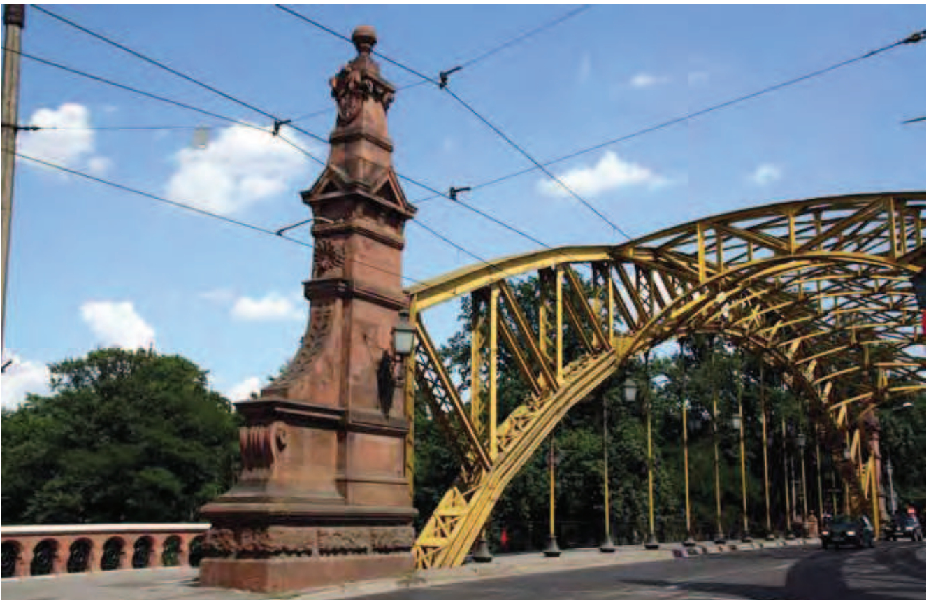
Fig. 3. Obelisk wykonany z czerwonego piaskowca noworudzkiego przy Moście Zwierzynieckim, fot. M.W. Lorenc • Obelisk by the Zwierzyniecki Bridge in Wrocław are built of the red Nowa Ruda sandstone, phot. M.W. Lorenc