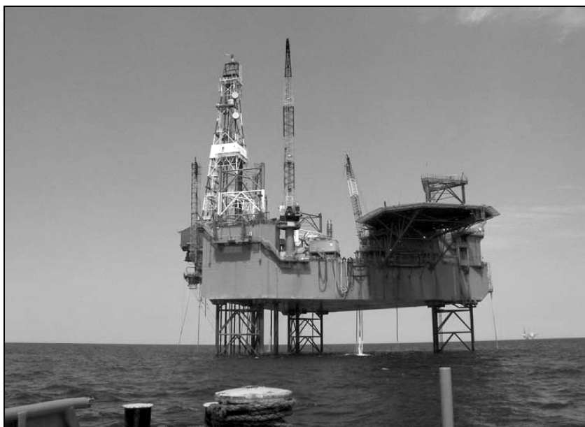
Rys. 3. Platforma eksploatacyjna „Baltic Beta”

Szacuje się, iż największe polskie złożo ropy naftowej B3, położone jest w odległości około 70 km na północ od przylądka Rozewie. Zalega pod 80-metrową warstwą wody, na głębokości około 1500 metrów. Powierzchnia złoża wynosi ponad 36 km 2 , a jego zasoby geologiczne szacowane są na ponad 25 mln m 3 . Przedsiębiorstwo Poszukiwań i Eksploatacji Złóż Ropy i Gazu „Petrobaltic” wydobywa aktualnie ropę naftową ze złoża B3, będąc w posiadaniu dwóch załogowych oraz jednej bezzałogowej platformy wydobywczej (rys. 3). Przedsiębiorstwo pokrywa obecnie około 3% zapotrzebowania krajowego na ropę naftową. Roczne wydobycie kształtuje się na poziomie 320–350 tysięcy ton.