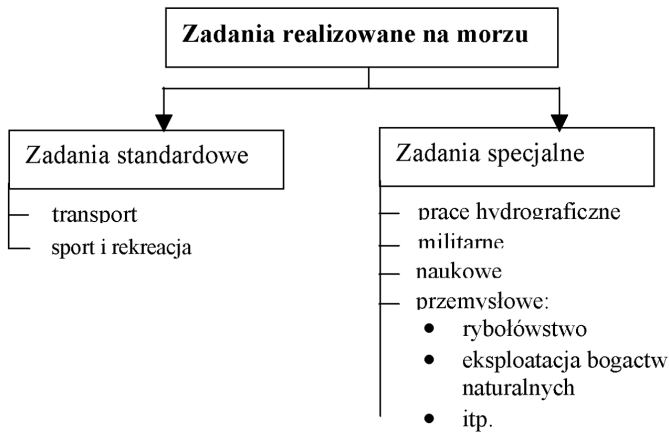
Rys. 1. Zadania realizowane na morzu

Odpowiednio do rodzajów zadań buduje się różne rodzaje statków. Biorąc pod uwagę sposób zarządzania statkiem można, na każdym z nich wydzielić jednorodne podprocesy (funkcje) (rys. 2).