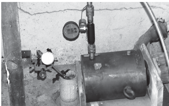
Rys. 2. Układ obciążający i układ pomiarowy

Stanowisko badawcze przedstawiono na rysunku 2. Siła pozioma (reakcja) przenoszona była na drugi mikropal, którego głowica była trwale utwierdzona w betonowej posadzce pomieszczenia.