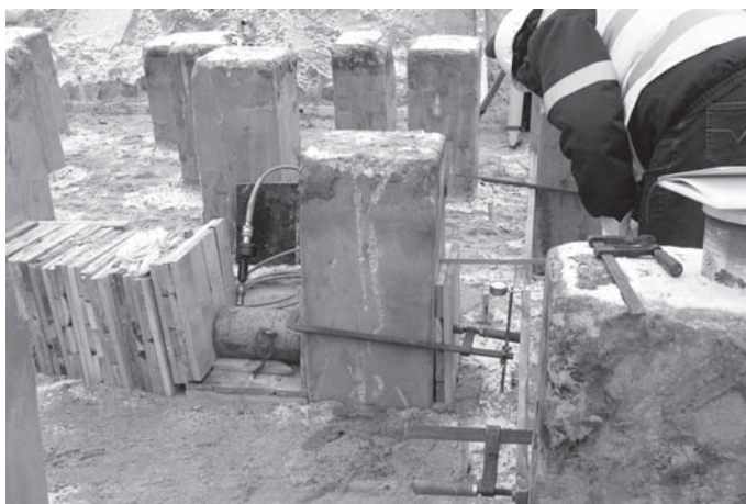
Rys. 1. Przykładowe stanowisko do badań nośności bocznej

Typowe konstrukcje stosowane do wywierania obciążenia bocznego na pal działają na zasadzie „rozpierania” lub „ściągnięcia” sąsiednich pali siłownikiem hydraulicznym. Przykładowe rozwiązanie przedstawiono na rysunku 1. Technika taka ma zasadnicze wady polegające na nieadekwatności sposobu obciążenia sąsiednich pali w stosunku do ich pracy pod konstrukcją (gdzie ich obciążenie boczne ma jednakowy zwrot). Pewnym problemem jest również swobodna głowica pala obciążanego (rys. 1), która w rzeczywistej pracy pala jest utwierdzona w konstrukcji oczepu. W niniejszej pracy przedstawiono wyniki obliczeń statycznych i ich weryfikację doświadczalną w odniesieniu do pala o małej średnicy (mikropala iniekcyjnego). Obliczenia przemieszczeń wykonano metodą normową wg [1] z uwzględnieniem rzeczywistej sztywności mikropala i przy założeniu, że głowica jest neutwierdzona.