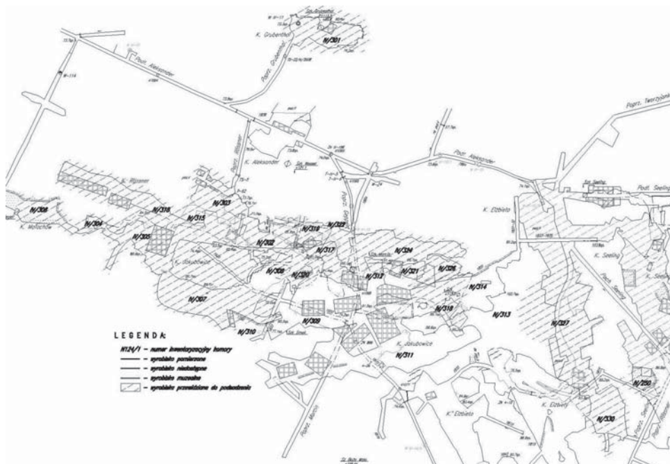
Rys. 3. Wyrobiska zespołu komór Jakubowice na poziomie IV