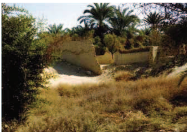
Fig. 1. Oaza na pustyni • The oasis on the desert

Key words: Sahara, Egypt's deserts, Farafra, White Desert