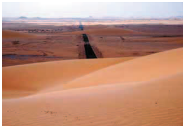
Fig. 3. Wędrujące wały wydymowe przecinające drogę koło El Kharga • Shifting sand dunes cross the road near El-Kharga

W Egipcie znajdziemy wszystkie klasycznie opisywane rodzaje krajobrazów pustynnych: pustynie piaszczyste, ka-