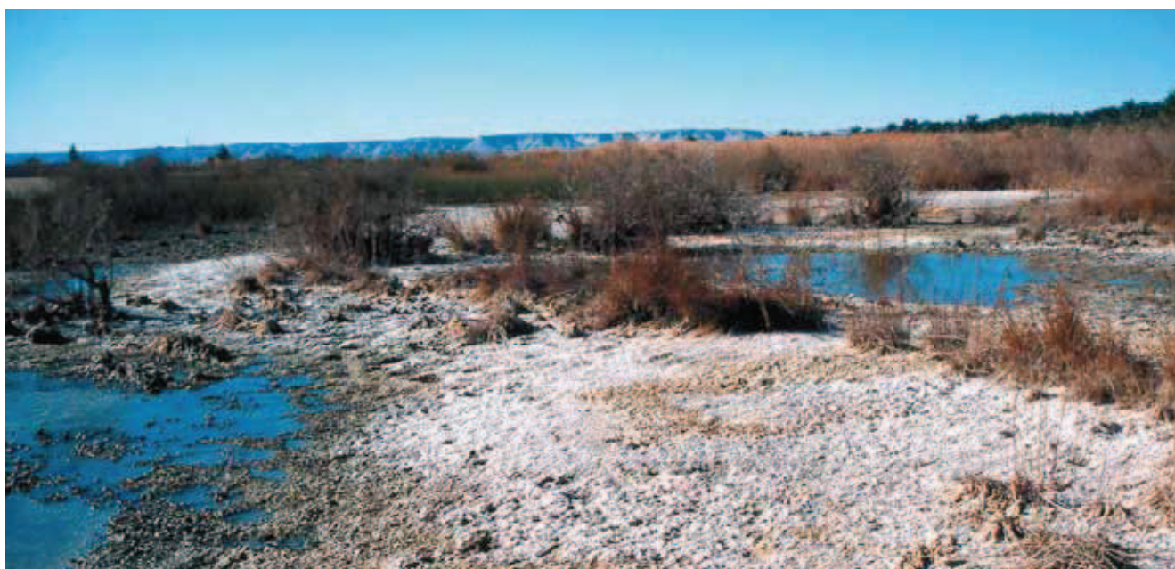
Fig. 11. Szott koło oazy Siwa • Shott near the Siwa oasis