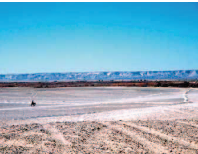
Fig. 6. Trzynaście lat temu były w tym miejscu urodzajne pola, dziś są solniska • Thirteen years ago at this place were fertile crop fields, now it is an alkali flat.

piasek skutecznie utrudnia wykonanie ostrego zdjęcia. Dobre fotografie udaje się zrobić jedynie o wschodzie lub zachodzie słońca (gdy dominuje oświetlenie boczne) i tylko wtedy gdy nie wieje wiatr.