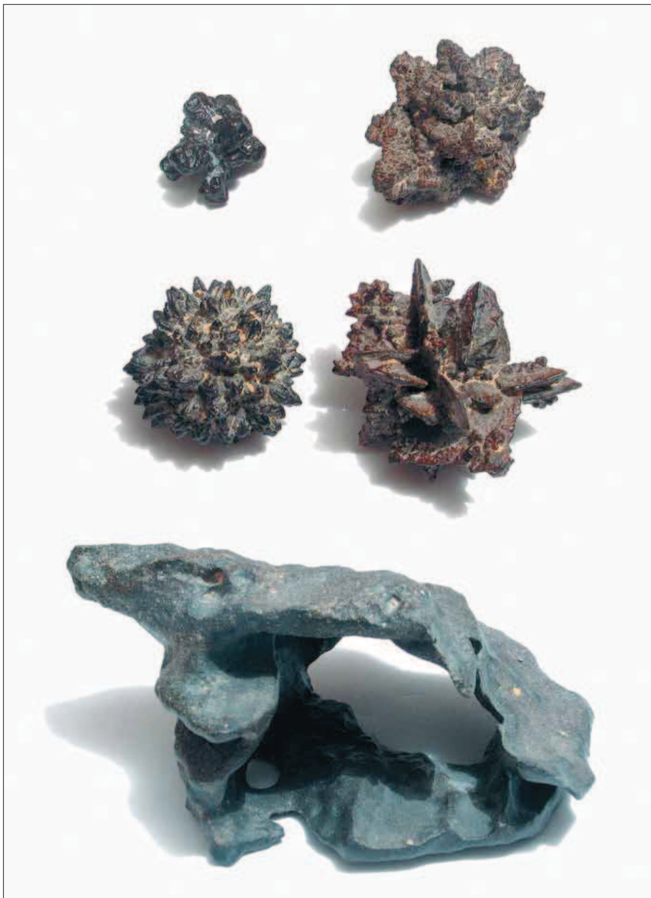
Fig. 11. Pustynne konkretje getytowe i polewa pustynna • Desert goethite concretions