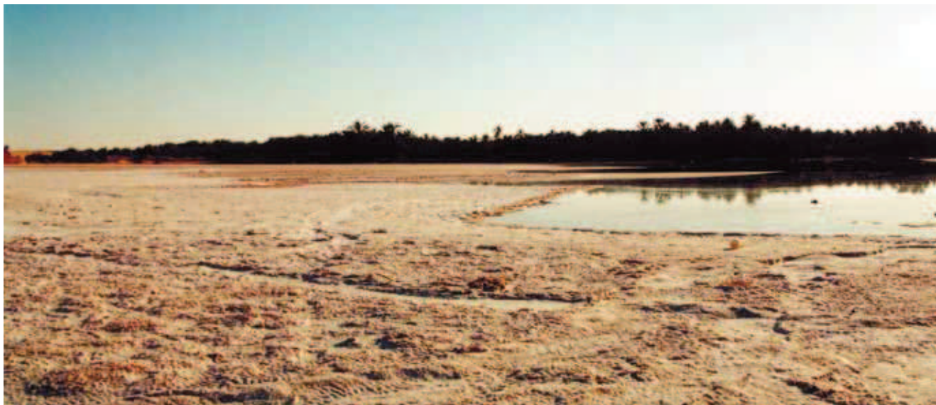
Fig. 7. Serir u podnóża Questa Abu Said koło Farafrы • Serir et the foot of the Abu Said Questa near Farafra.

światło niczym lustro. Brzegi szottów oraz zagłębienia terenu, gdzie często pojawiają się wysięki wody, porośnięte są przez zbiorowiska roślinności wodnej (sity i trzciny) oraz słonolubnej (zwłaszcza krzewy tamaryszków) Fig. 11. Na Saharze zwarcie roślinności na pustyni ilastej jest największe, choć bogactwo gatunkowe nie jest duże. Mało zasolone fragmenty pustyni ilastych są żyzne, chętnie bywają brane pod uprawę. Ogrody w większości oaz usytuowane są na ilastym podłożu.