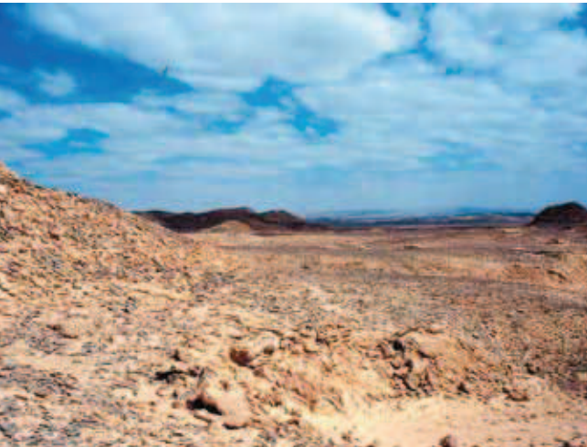
Fig. 5. Hamada między Dakhla a Charga . Hamada between Dakhla and Charga .