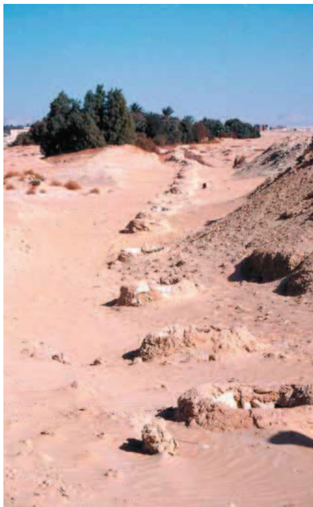
Fig. 9. Funkcjonująca od setek lat foggara jest atrakcją turystyczną • The foggara operating since hundreds of years is a significant tourist attraction

Na Białej Pustyni, a także, acz rzadziej, w bezpośrednim pobliżu miasta Farafra, występują (dość gęsto i równomiernie rozsiane) konkrety żelaziste, przybierające rozmaite kształty. Wśród znalezionych okazów dominowały bezpostaciowe, ciężkie okazy o wydłużonym kształcie, niekiedy przypominające formą kuliste „jeże”, o średnicy 1 – 3,5 cm (Fig. 11). Po analizie laboratoryjnej okazało się, że są to rozmaite pustynne konkrety getytu \text{FeO}(\text{OH}) . Wstępnie minerał krystalizował w formie koncentrycznie ułożonych igielek, następnie, pod wpływem gorącego klimatu, rekrystalizował, przyjmując zaskakujące kształty. □