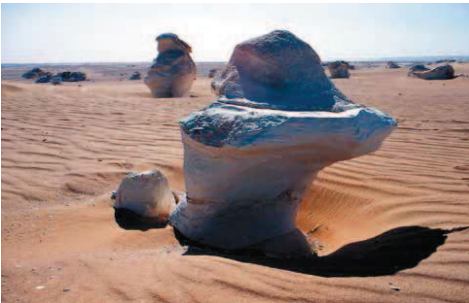
Fig. 10. a i b. Fantastyczne formy wy- rzeźbione przez wiatr • Fantastic form carved by the wind