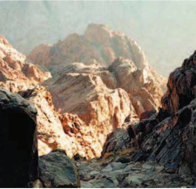
Fig. 4. Góry Gabel El Tih na półwyspie Synaj • The Gabel El Tih mts on Sinai Peninsula.