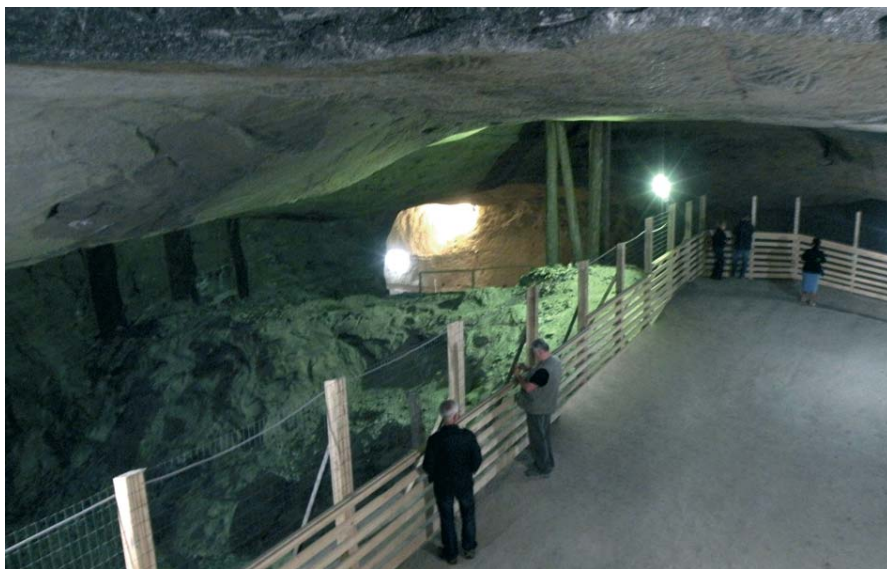
Fig. 6. Komory solne na trasie turystycznej w kopalni Kaczyka

Kopalnia od momentu założenia wydobywała sól kamienną w postaci brył solnych oraz solankę. W wyniku modernizacji techniki eksploatacji, transportu, pompowania solanki i in. przeprowadzonej pod koniec XVIII w. kopalnia Cacica stała się jedną z najbardziej nowoczesnych w Europie. W 1886 r. jej produkcja wynosiła 2380 t soli kamiennej i 2926 t soli warzonej.