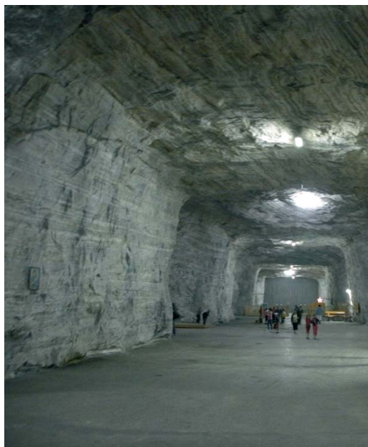
Fig. 5. Komory na trasie turystycznej kopalni Târgu Ocna

W latach 1967–1970 sól wydobywano w kopalni Pilot, gdzie zastosowano nowy system eksploatacji komorowo-filarowy, którym do dziś prowadzi się eksploatację w złożu komorami o wymiarach: szerokość 8.2 m, wysokość 8.6 m, długość maksymalna 1600 m, i o filarach kwadratowych o boku 8.2 m lub 8.6 m. W kopalni Pilot znajduje się centrum sanatoryjno-turystyczne i małe muzeum na głębokości 130 m.