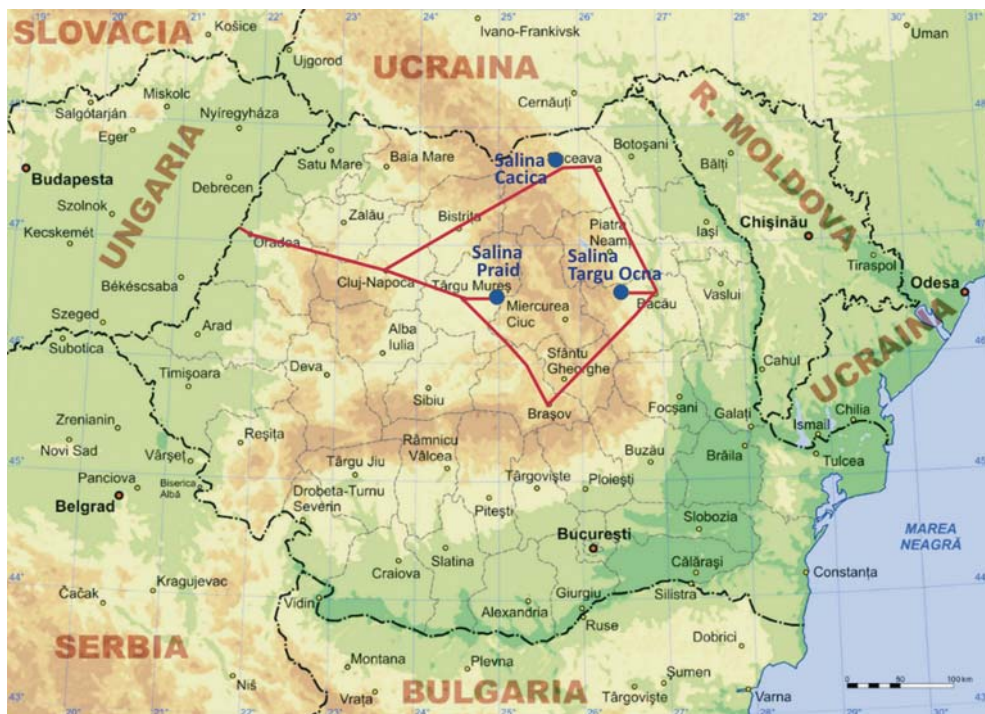
Fig. 1. Seminarium geologiczno-górniczne PSGS w Rumunii – trasa przejazdu ( http://pl.wikipedia.org/wiki/Plik:Physical_map_of_Romania.jpg )

W artykule przedstawiono charakterystykę działalności trzech kopalń soli odwiedzonych przez członków Polskiego Stowarzyszenia Górnictwa Solnego podczas terenowego seminarium geologiczno-górniczego, jakie odbyło się w Rumunii w dniach od 10 do 14 czerwca 2009 roku (Fig. 1).