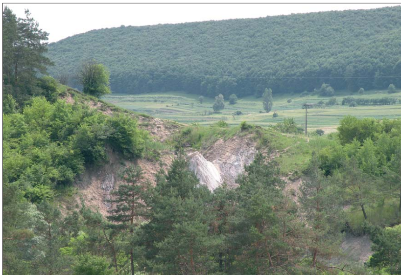
Fig. 3. Wychodnia złoża soli kamiennej Praid w kanionie solnym rzeki Corund