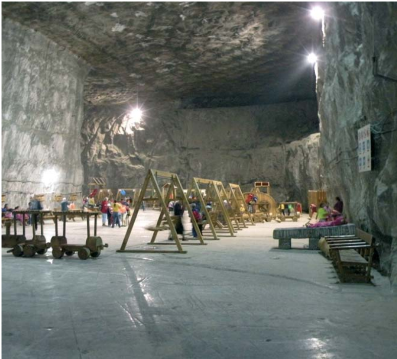
Fig. 2. Komora na trasie turystycznej w kopalni Praid