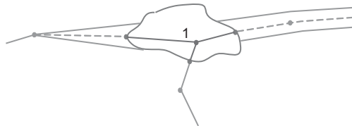
Rys. 1. Punkt matematyczny osnowy kartograficznej (1) wyznaczony w osi cieków w obrębie zbiornika wodnego

Przykład punktu matematycznego osnowy kartograficznej zaprezentowano na rysunku 1.