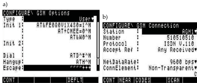
Rys. 1. Konfiguracja telefonu GSM: a) parametry, b) połączenie

Konfiguracja telefonu komórkowego w odbiorniku GPS wymaga ustawienia: parametrów portu zgodnie z punktem poprzednim, z wartością opcji Flow Control wynoszącą RTS/CTS, parametrów GSM dotyczących komend AT (rys. 1a), parametrów połączenia (rys. 1b) oraz wpisania kodów PIN i PUK. Sekwencje inicjalizujące różnią się istotnie nawet w różnych modelach tego samego producenta. Komend AT jest bardzo dużo. Znaczenie wybranych komend AT (wszystkich z konfiguracji domyślnej) zawiera tabela 1.