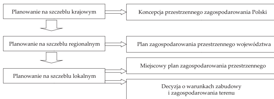
Rys. 1. System planowania przestrzennego w Polsce

Planowanie przestrzenne w Polsce odbywa się zgodnie z przepisami Ustawy z dnia 27 marca 2003 r. o planowaniu i zagospodarowaniu przestrzennym [2]. Całość zagadnienia, obejmująca problematykę planowania przestrzennego na szczeblu krajowym, regionalnym i lokalnym (rys. 1), została ujęta w jednym akcie normatywnym. Ustawodawca dokładnie określił organy odpowiedzialne za planowanie przestrzenne na poszczególnych szczeblach, a także szczegółowość i treść poszczególnych planów zagospodarowania.