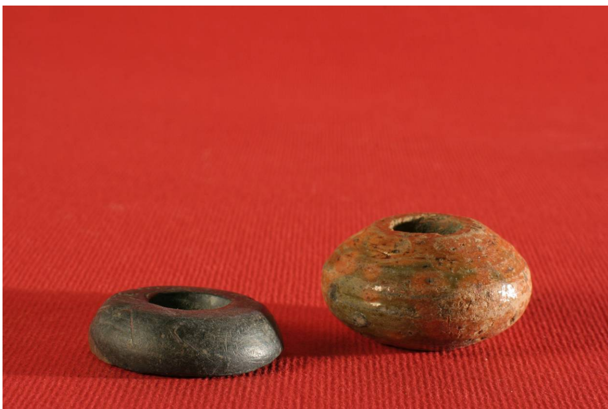
Fot. 12. Przędliki z kamienia i łupku datowanie średniowiecze