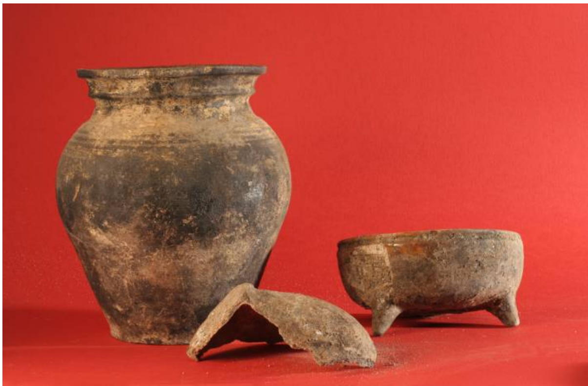
Fot. 9. Naczynia gliniane z XV w.