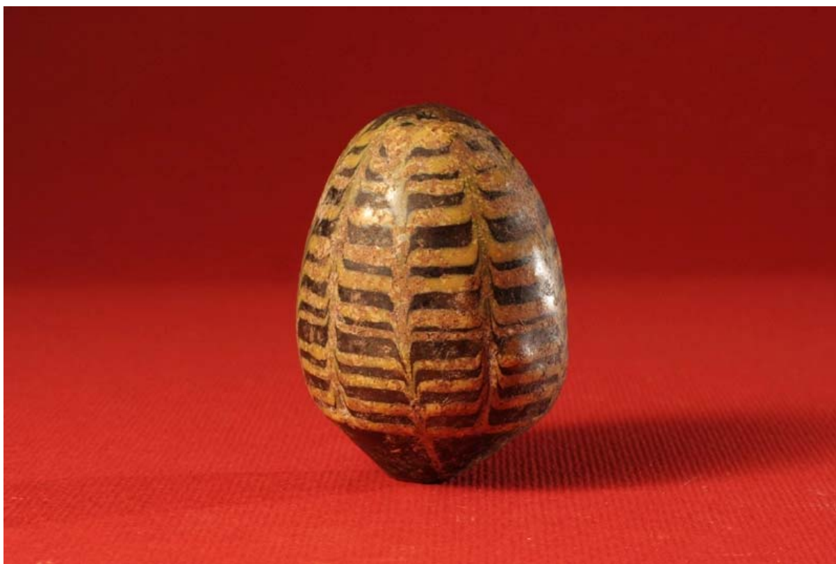
Fot. 1. Pisanka Kijowska z XII-XIII wieku (Obiekt wypożyczony przez Muzeum Historyczne Miasta Krakowa na wystawę: „Kraków w chrześcijańskiej Europie X-XIII w.”)