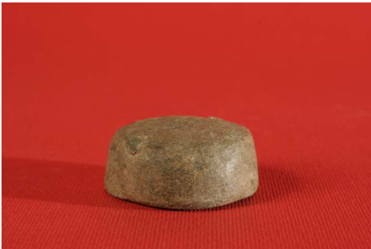
Fot. 13. Ciężarek ołowiany