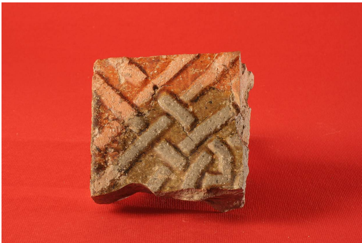
Fot. 6. Fragmenty płytek posadzkowych tzw. typu wawelskiego z połowy XII w.