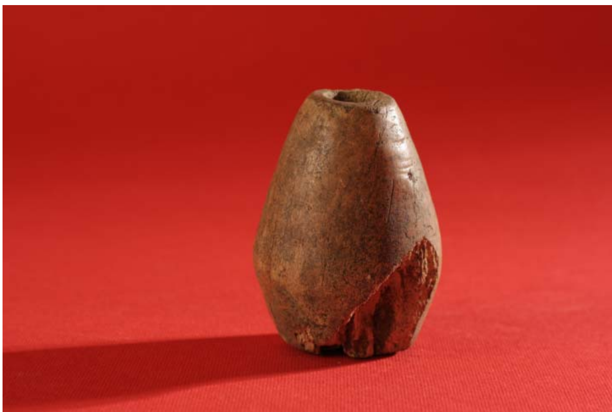
Fot. 14. Kościany detal mebla gotyckiego