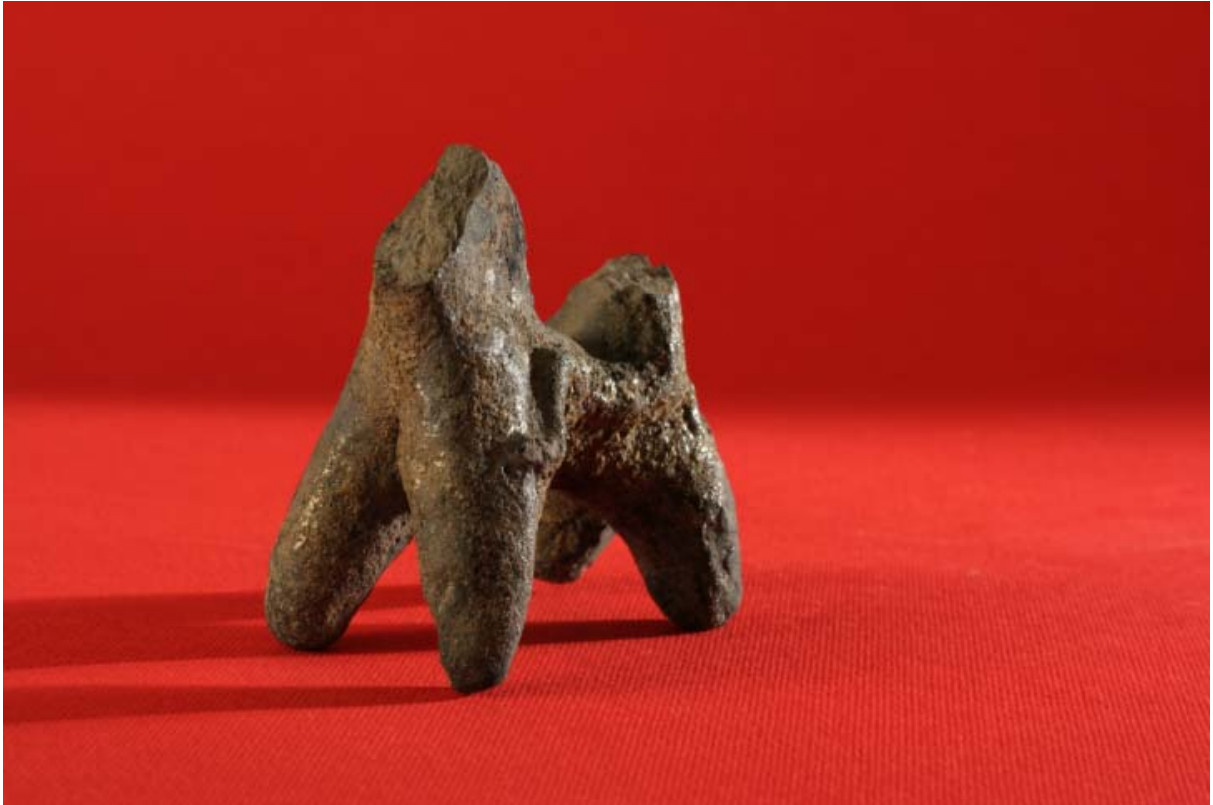
Fot. 2. Figurka jeźdźca z połowy XIII wieku