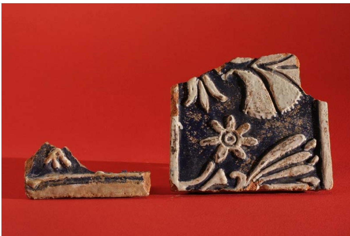
Fot. 7. Kafel nowozytny