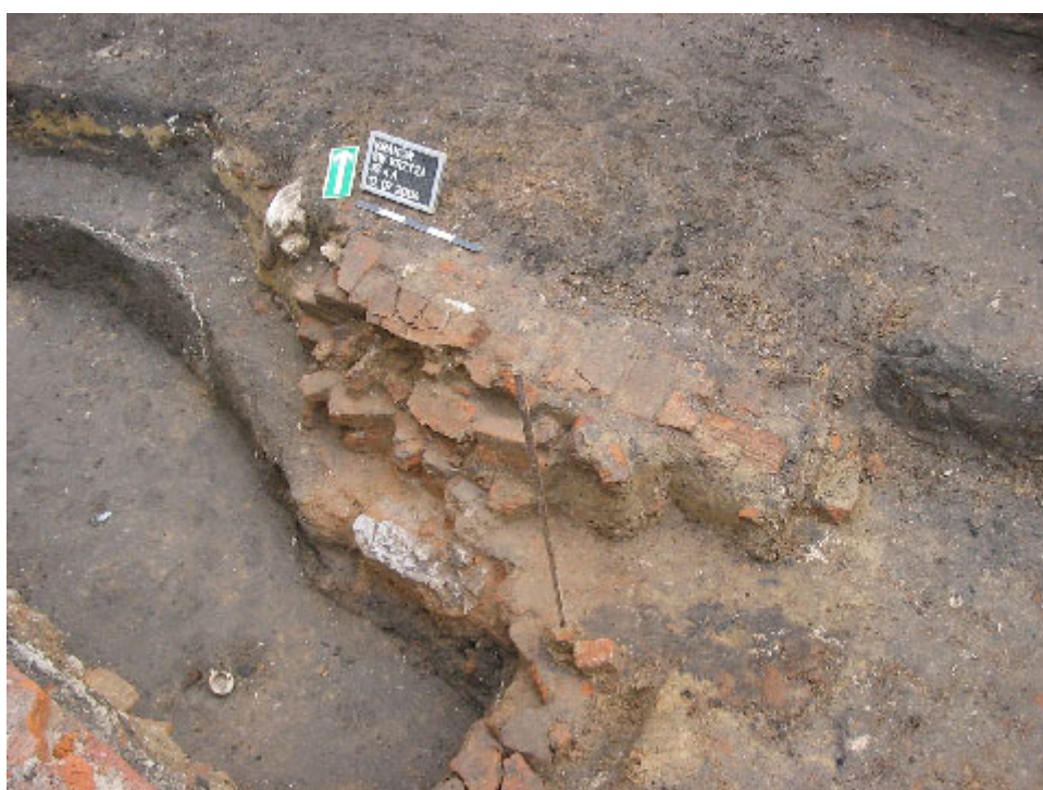
Fot. 4. Relikty nowożytnego pieca browarniczego