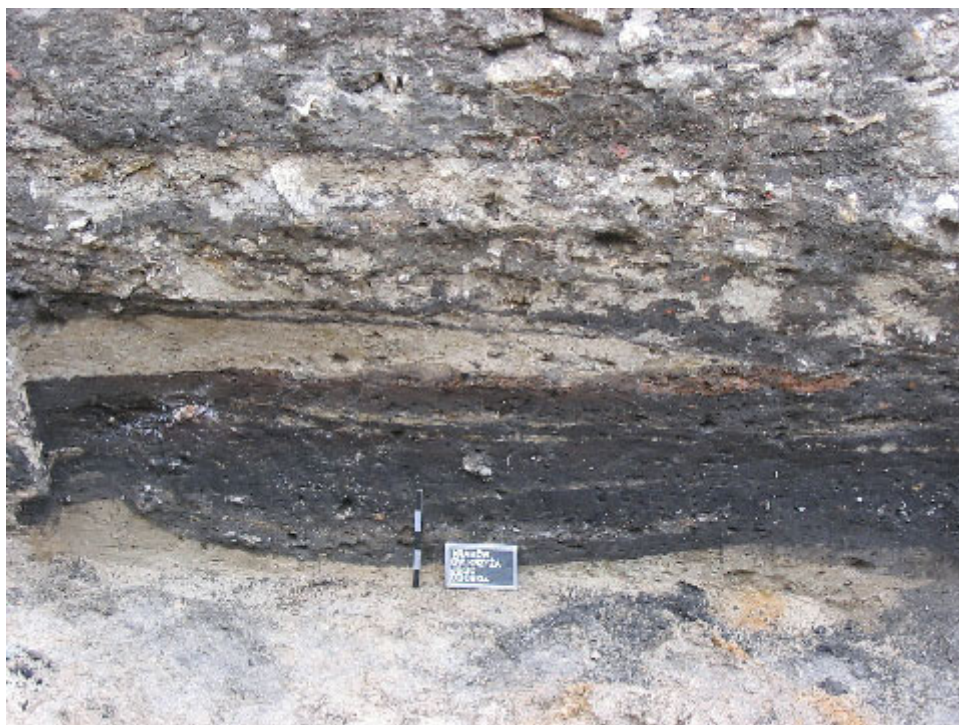
Fot. 3. Profil XI-wiecznego budynku mieszkalnego