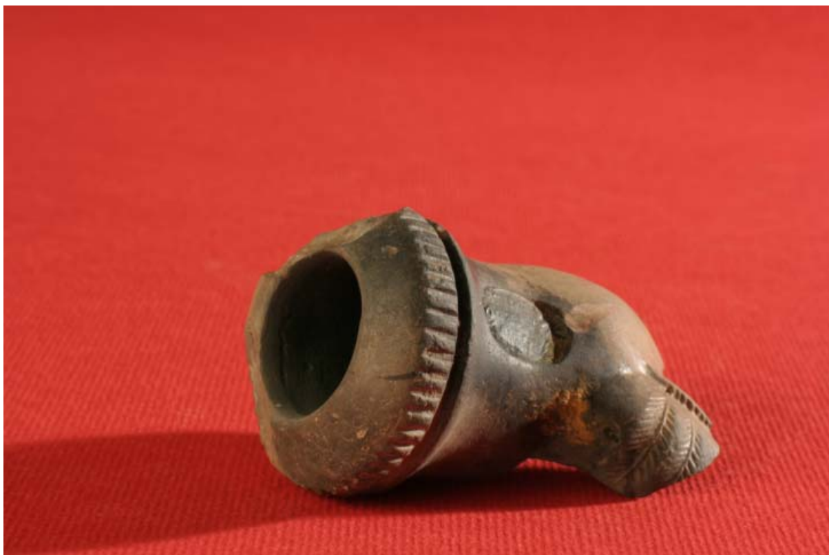
Fot. 11. Nowożytna fajka gliniana