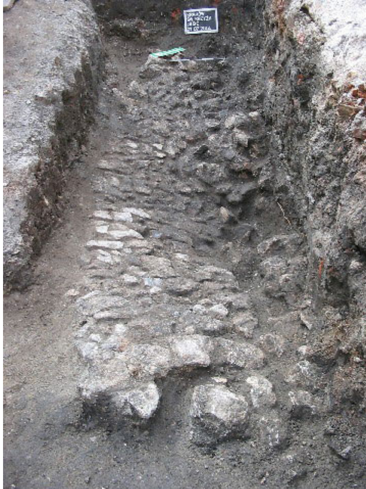
Fot. 2. Bruk z około połowy XIV w.