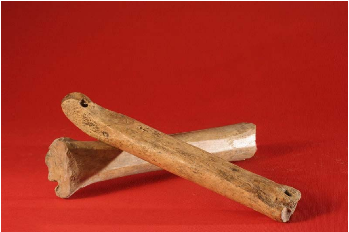
Fot. 3. Łyżwy kościane z XII wieku