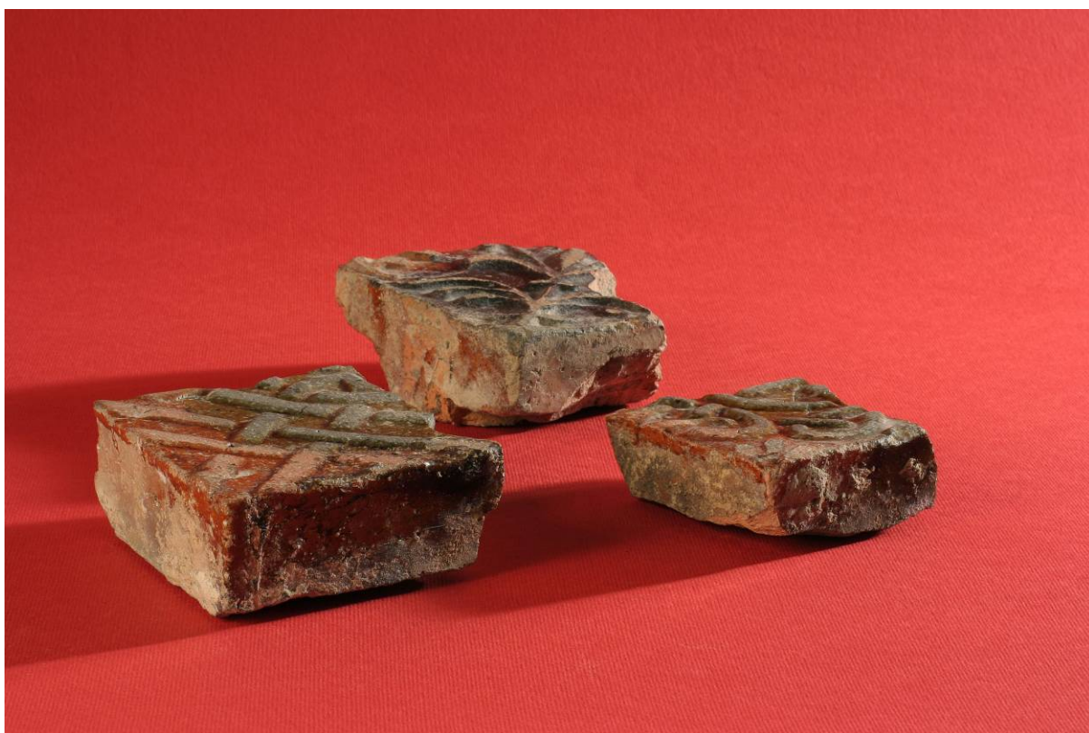
Fot. 5. Fragmenty płytek posadzkowych tzw. typu wawelskiego z połowy XII w.