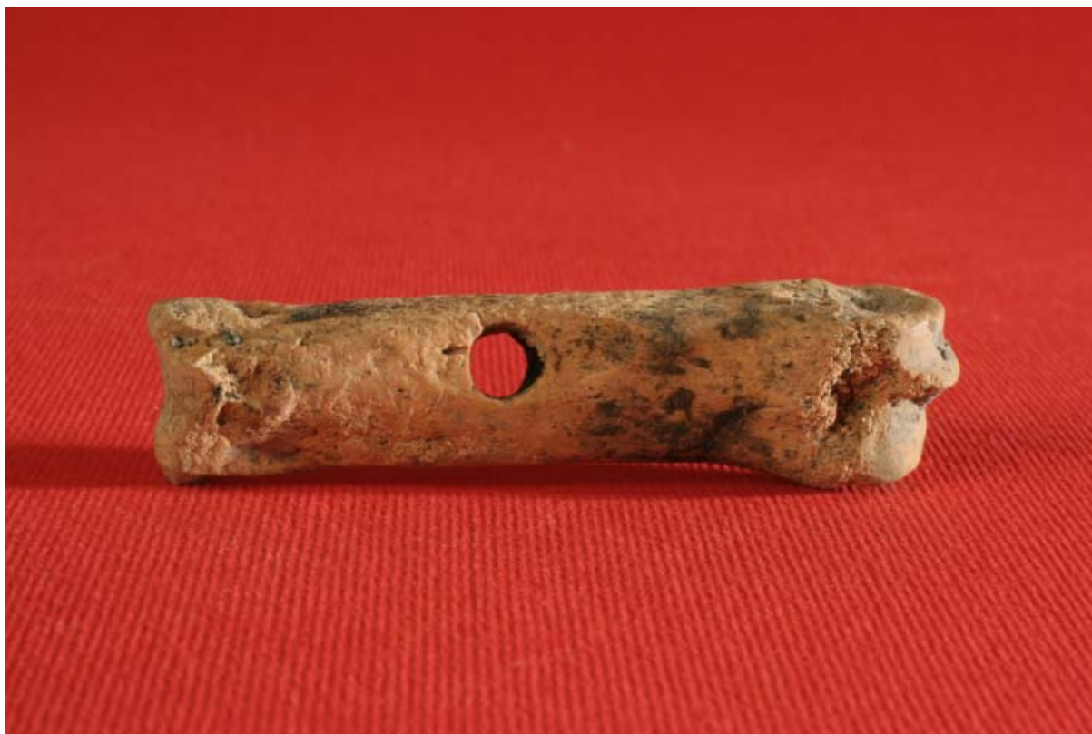
Fot. 4. Hetka kościana z XII wieku