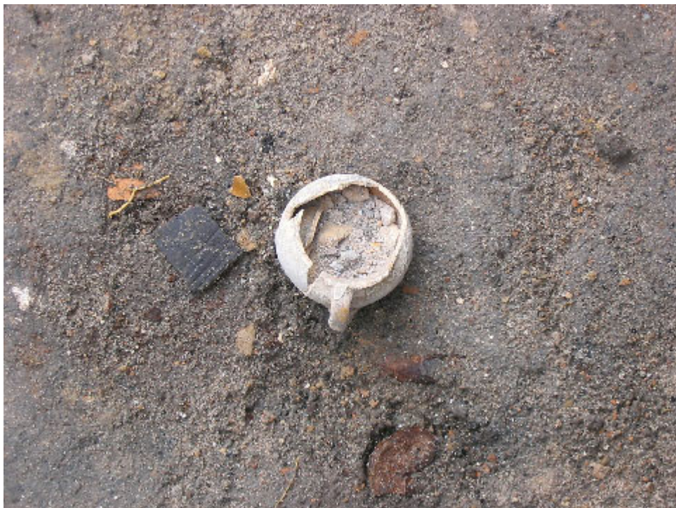
Fot. 6. Dzbanuszek z monetą w zrujnowanym piecu browarniczym