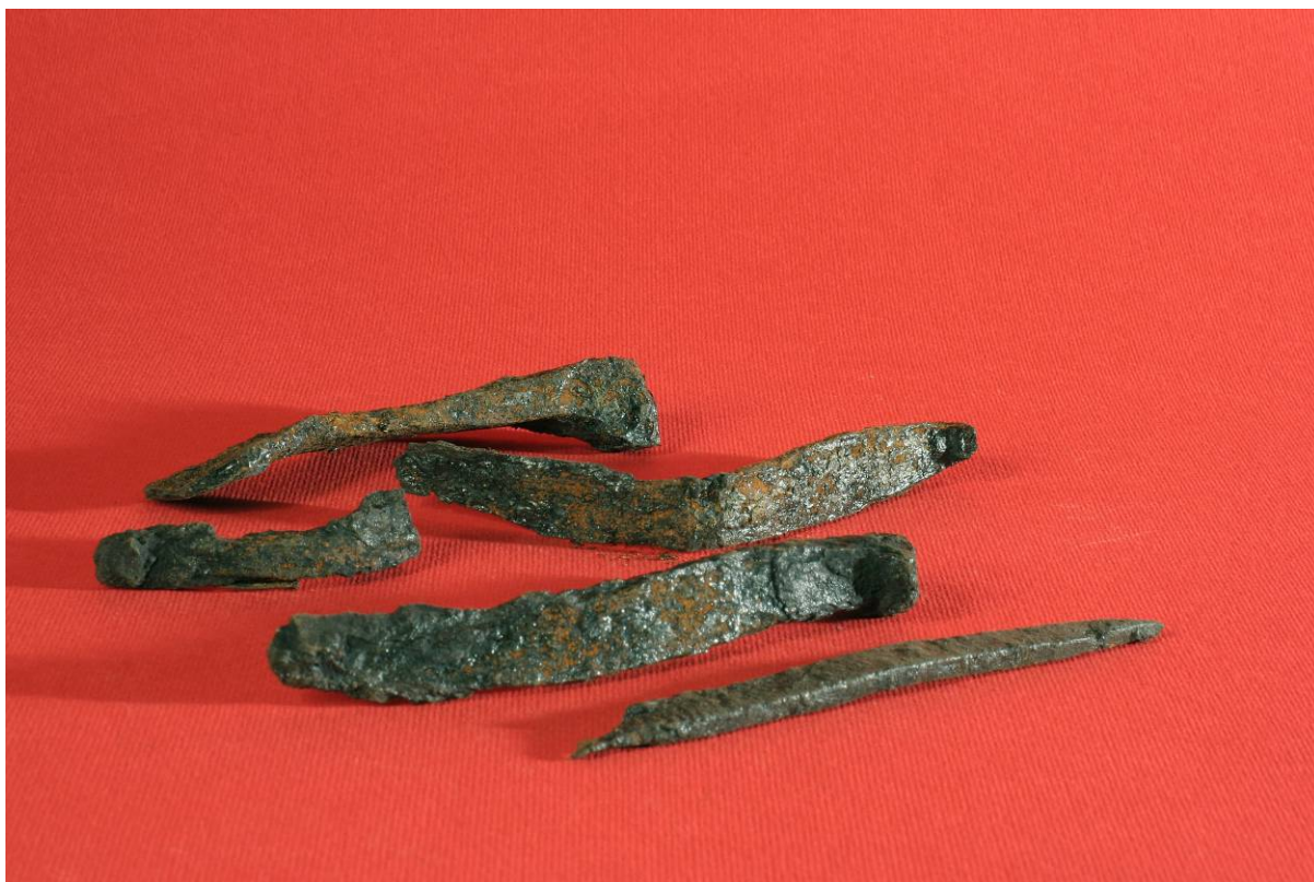
Fot. 15. Przedmioty żelazne z badań 2004