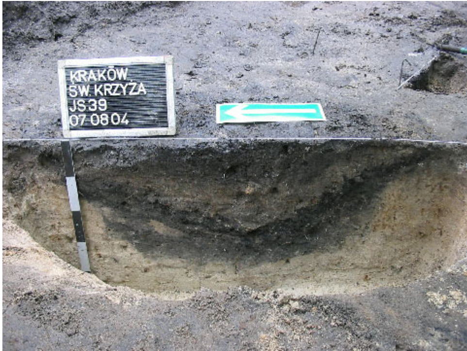
Fot. 5. Przekrój XII-wiecznego paleniska