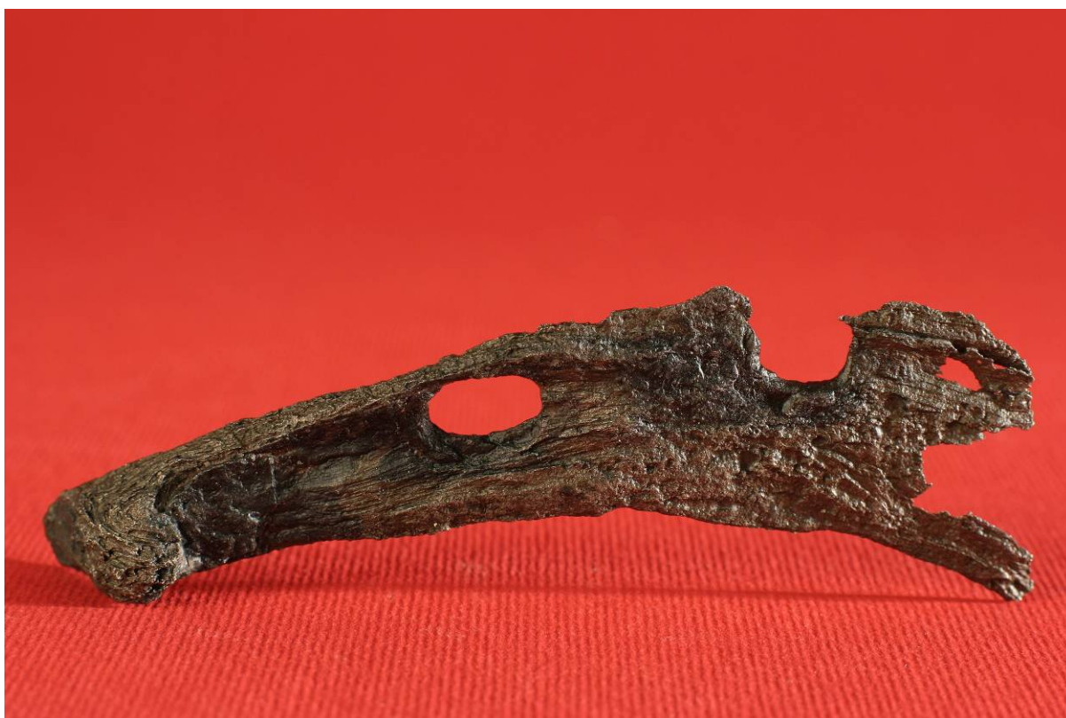
Fot. 16. Podkowa z badań 2004