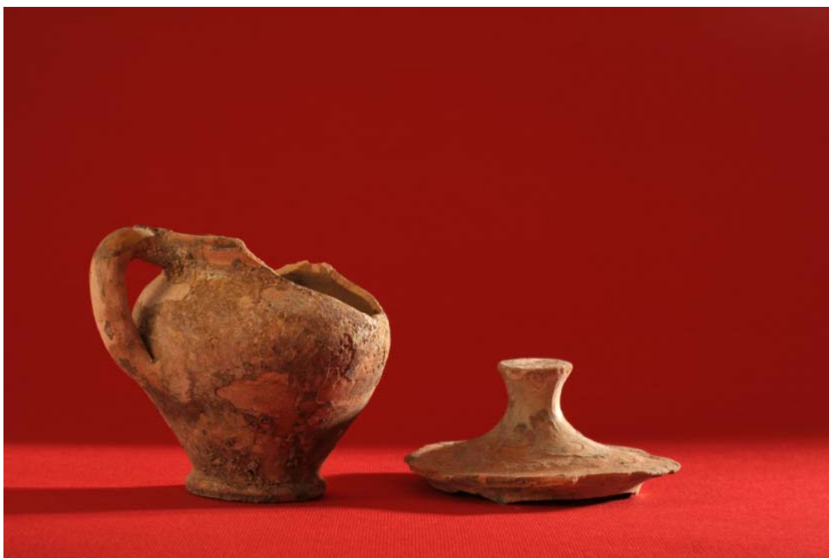
Fot. 10. Naczynia gliniane z XV w.