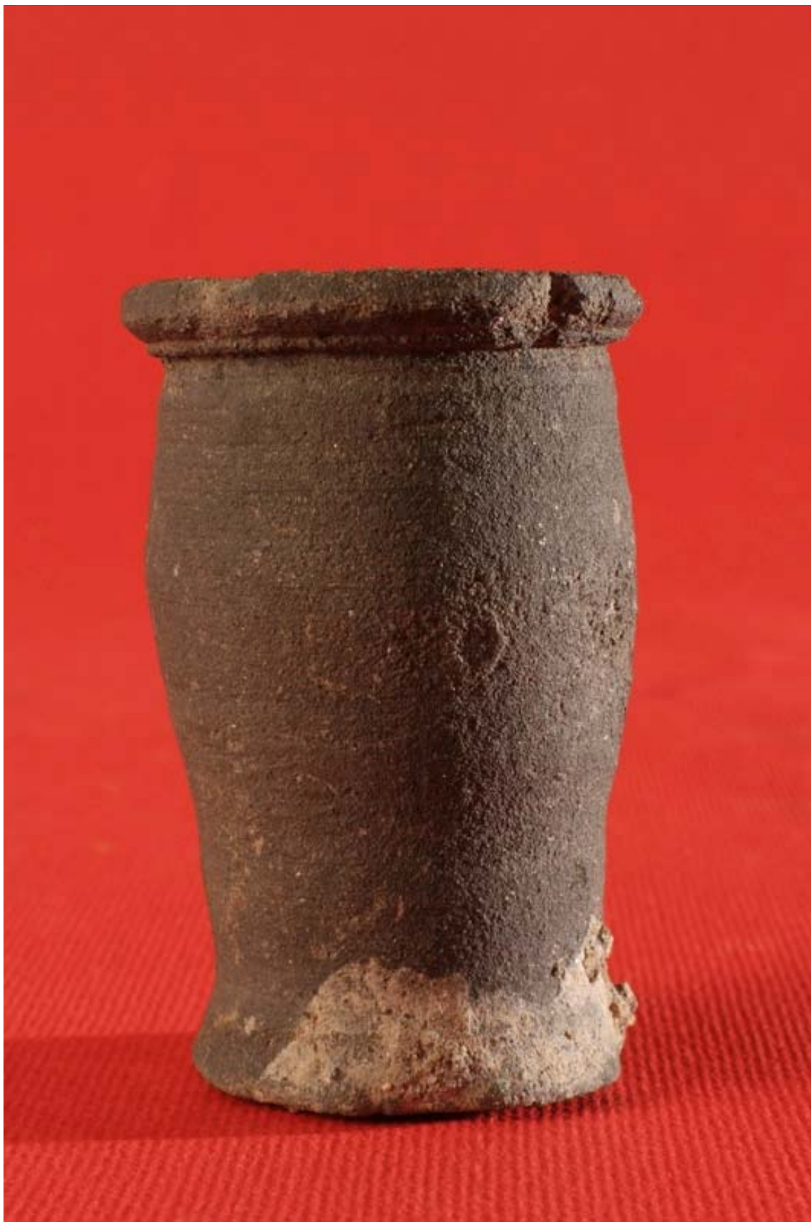
Fot. 8. Naczynie gliniane z XV wieku