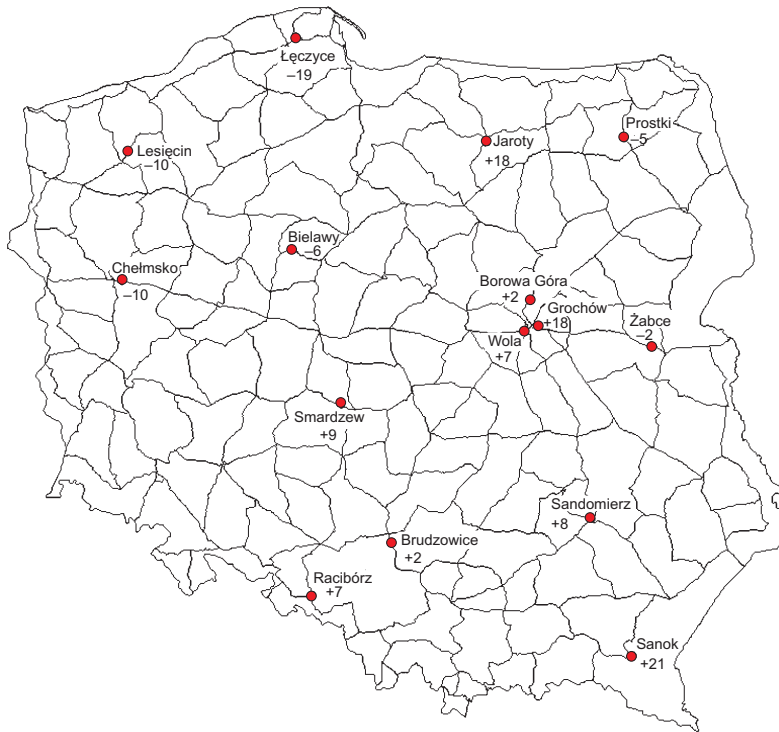
Rys. 1. Izolinie błędów średnich wyrównanych wysokości punktów węzłowych przy założeniu, że punktem o znanej wysokości jest reper węzłowy Warszawa – Wola (skok: 1 mm)