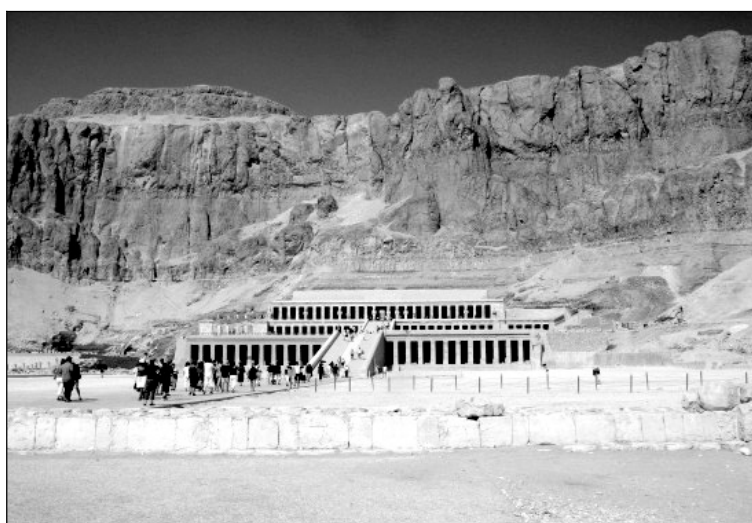
Rys. 2. Tarasowa świątynia królowej Hatszepsut (1473–1458 p.n.e.) w Deir el-Bahari