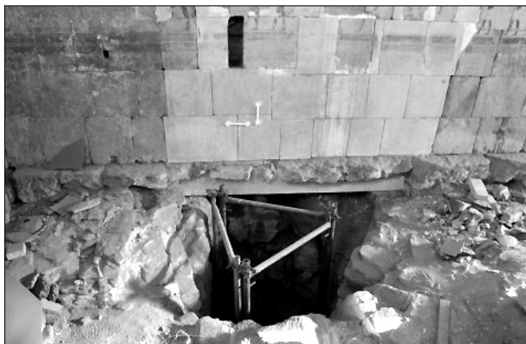
Rys. 4. Przekute przez ławicę wapienia zejście wydrążone w łupkach esna do grobu w kaplicy Hatszepsut. Otwór wejściowy usytuowany częściowo pod ścianą kaplicy

Z obserwacji wynika, że górny taras świątyni wraz z sanktuarium Hatszepsut oraz otaczającymi kaplicami usytuowano na ławicy spękanego wapienia tkwiącego wśród łupków esna. Taras ten uzyskano poprzez wcięcie się w stropową partię tych łupków i częściowe obcięcie wyżej leżącego klifu zbudowanego z wapieni tebańskich. Pod tarasem tym występują groby, w tym m.in. ostatnio odkopywane w kaplicy królowej Hatszepsut (rys. 4). Obserwacje wskazują, że groby te wykonywano w ten sposób, że przebijano ławicę wapienia, a następnie po dostaniu się do miękkich łupków drażono w nich komory grobowe. Niektóre z tych komór znajdują się pod ścianami świątyni.