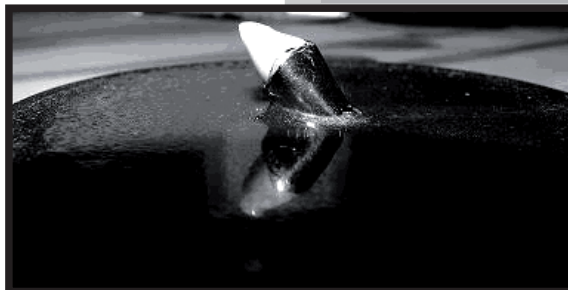
RYS.4. Koronka osadzona na trzpieniu przed próbą ściskania. FIG.4. The crown set on an arbour before the compression test.

W próbie ściskania koronka uległa zniszczeniu przy sile 350N, a wolnozmiennemu zmęczeniu w