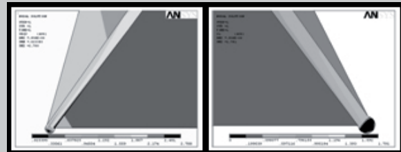
RYS.2. Naprężenia zredukowane w lewej przyszyjkowej stronie korony oraz rozciągające w prawej przyszyjkowej stronie korony.

Cutting stresses extend as far as the secant of a tooth. Ce-