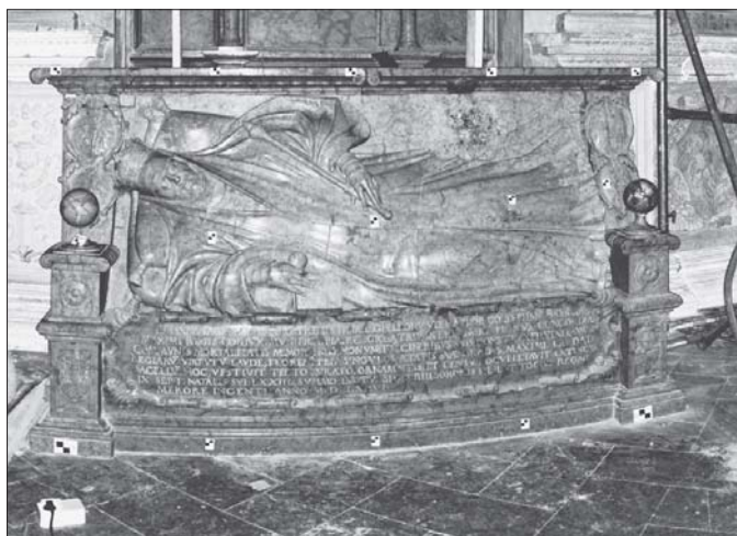
Rys. 2. Wizualizacja (na powierzchni cylindrycznej) chmury punktów pomierzonej skanerem z lewego stanowiska. Skala szarości odpowiada natężeniu promieniowania laserowego odbitego od obiektu

Prace terenowe przebiegały w następujący sposób: zasygnalizowano 15 punktów osnowy fotogrametrycznej i pomierzono je w dwóch seriach biegunowo tachimetrem bezlustrowym Trimble 3305 DR. Następnie wykonano dwa szeregi zdjęć, po sześć zdjęć każdy, kalibrowaną kamerą cyfrową Canon EOS 300D wyposażoną w obiektyw o ogniskowej 20 mm. Osnowa fotogrametryczna została zasygnalizowana takimi biało-czarnymi tarczami, jakimi sygnalizuje się punkty osnowy służące do orientacji chmur punktów. Zatem tarcze te posłużyły do orientacji zdjęć i efektu skanowania laserowego – chmur punktów. Skanowanie odbyło się z dwóch stanowisk w celu wygaszenia powstających martwych pól – cieni. Rozdzielczość skanowania ustalono na średnią ( high ). Rysunek 2 przedstawia widok chmury punktów na powierzchni cylindrycznej pomierzonej z lewego stanowiska.