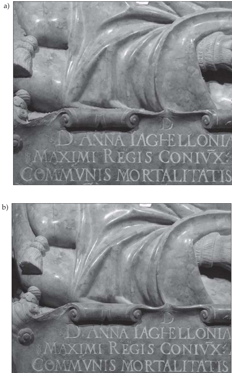
Rys. 7. Porównanie ortofotogramów wygenerowanych metodami integracji danych oraz metodą fotogrametryczną bazującą na pomiarze modelu powierzchni na stacji cyfrowej: a) fragment produktu integracji danych – ortorektyfikacja oparta na chmurze punktów; b) fragment ortofotogramu powstałego w sposób klasyczny – ortorektyfikacja oparta na pomiarze na fotogrametrycznej stacji cyfrowej