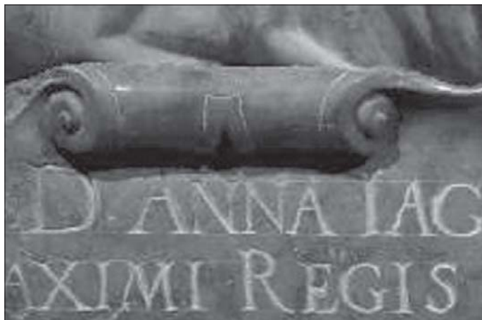
Rys. 6. Powiększenie fragmentu ortofotogramu wygenerowanego z wykorzystaniem chmury punktów jako numerycznego modelu powierzchni, po zastosowaniu filtrów geometrycznych – w porównaniu z rysunkiem 3 widoczne są spodziewane efekty działania filtrów ( scvclearscan , scvsmoother ). Cały pierwszy plan zakrywa elementy dalsze, litery mają proste krawędzie

Pierwszy to jakość obrazu. Początkowo niedostateczna, po zastosowaniu filtrów osiągnęła w przybliżeniu poziom obrazu fotograficznego. Pojawiają się jeszcze drobne nieciągłości na krawędziach, wyeliminowanie ich wymagałoby zastosowania algorytmu krawędziującego. Do oceny jakości ortofotogramów można wykorzystać teorię falkową [10].