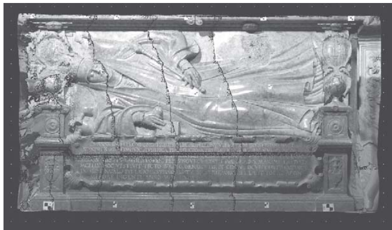
Rys. 8. Ortofotogramy cząstkowe przed zmozaikowaniem – zastosowanie na całym polu testowym ortorektyfikacji metodą integracji danych

Podstawowym celem publikacji jest przedstawienie możliwości integracji danych i zapowiedź publikacji na ten temat dalszych badań oraz wyników.