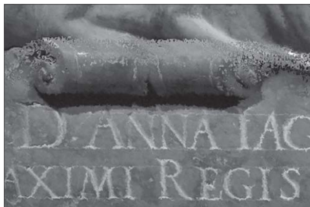
Rys. 3. Powiększenie fragmentu ortofotogramu wstępnie wygenerowanego z wykorzystaniem chmury punktów jako numerycznego modelu powierzchni – efekt pierwszych prób integracji danych, przed zastosowaniem filtrów geometrycznych. Na wolutie widać ubytki obrazu pierwszego planu – pojawia się informacja obrazowa odpowiadająca części zasłoniętej. Litery napisów zostają „poszarpane” na skutek błędów w pomiarze odległości przez skaner

Pierwsze niekorzystne zjawisko polega na tym, że ortofotogram posiada informację obrazową nie tylko związaną z pierwszym planem, ale również z częściami zasłoniętymi, ale objętymi skanowaniem i fotogramami. Wynika to z różnic pomiędzy kierunkiem rzutowania w trakcie skanowania i fotografowania (rzuty środkowe) a kierunkiem projekcji ortogonalnej. Zjawisko to widać na rysunku 3 w górnej części woluty.