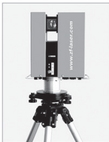
Rys. 1. Skaner laserowy Z+F LARA 53500

i zapisane w pliku chmury punktów. Efektem pracy instrumentu jest zgrubnie spoziomowana chmura punktów zarejestrowana z każdego ze stanowisk skanera. Stanowiska dobiera się tak, aby zminimalizować liczbę martwych pól (cieni) w chmurze i otrzymać zakładaną rozdzielczość terenową chmury punktów. Warto dodać, że skaner Z+F oprócz rejestracji położenia punktu zapisuje „czwartą współrzędną” – jest to wartość określająca natężenie promieniowania laserowego powracającego od obiektu skanera, tzw. refleksyjność. Zależy ona od materiału, koloru, temperatury i oświetlenia celu. Wobec tego pojawia się możliwość generowania widoków chmur punktów, w projekcji ortogonalnej, które mogą stanowić wartościowy materiał mapowy np. dla konserwatorów [3].