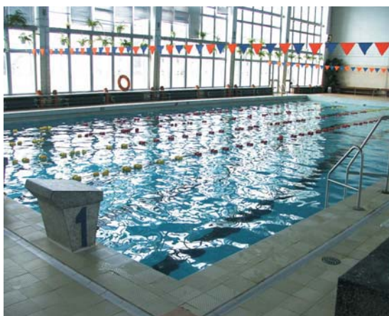
Rys. 4. Niecka basenowa na krytej pływalni w Krośnie

Kryta pływalnia (rys. 4) zasilana jest w ciepło z kotłowni znajdującej się w pobliskiej bursie szkolnej. Kotłownia dostarcza nośnik ciepła w postaci pary wodnej, która zasila węzły ciepła: c.o., c.w.u. i c.t. (woda w niecce basenu, wymiennik – rys. 5). Ciepło jest także produkowane na potrzeby wentylacji. Rozliczanie kosztów za dostarczone ciepło jest realizowane na zasadzie umownej. Wynika z niej, iż kryta pływalnia ponosi 67% opłat związanych z dostarczeniem mediów. I tak w przypadku gazu ziemnego, stanowi to średnio 286 tys. zł na rok. Roczny koszt energii elektrycznej dla krytej pływalni stanowi także 67% kosztu całkowitego (razem z bursą), co stanowi 7300 zł; podobnie roczny koszt wody na potrzeby kotłowni wynosi 2000 zł (67%).