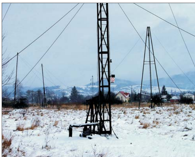
Rys. 1. Odwierty złoża ropy naftowej Turaszówka w rejonie krytej pływalni w Krośnie

W złożu ropy naftowej Turaszówka (rys. 1), położonym w granicach miasta Krosna, zasoby ropy są już na ukończeniu.