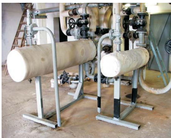
Rys. 5. Wymiennik ciepła na technologiczne potrzeby ogrzewania wody w niecce basenu