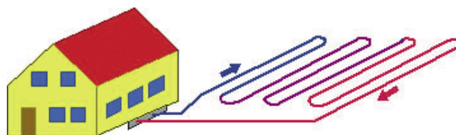
Rys. 2. Gruntowy wymiennik ciepła jako źródło zasilania pompy ciepła w energię niskotemperaturową (połączenie szeregowe)

Funkcję gruntowego wymiennika ciepła może pełnić istniejąca sieć wodociągowa. Jednym z argumentów przemawiających za stosowaniem takich rozwiązań, gdzie tylko to jest możliwe, jest fakt, iż instalacje wodociągowe powinny być tak zaprojektowane, aby w każdym odcinku przewodu trwał ciągły przepływ wody. Rury wodociągowe wykonywane są z żeliwa, stali ocynkowanej, polichlorku winylu, stali izolowanej oraz tak jak rurki wymienników gruntowych z polietylenu.