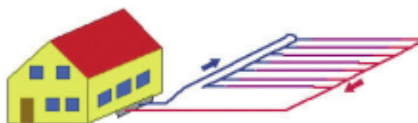
Rys. 1. Gruntowy wymiennik ciepła jako źródło zasilania pompy ciepła w energię niskotemperaturową (połączenie równoległe)

Pompa ciepła jest urządzeniem umożliwiającym wykorzystanie rozproszonego ciepła o niskiej temperaturze. Jedną z możliwości pozyskiwania ciepła niskotemperaturowego jest wykonanie w gruncie układu rurek [3], przez które przepływa nośnik ciepła (rys. 1 i 2). Odpowiednio niska temperatura nośnika ciepła powoduje, że ciepło słoneczne i geotermalne zgromadzone w gruncie przenika do wnętrza rurek. Nośnik transportuje energię do pompy ciepła, która podnosi jej stan energetyczny na wyższy, użyteczny poziom poprzez podniesienie temperatury.