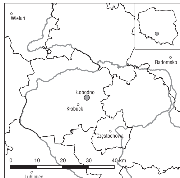
Ryc. 1. Lokalizacja terenu badań Fig. 1. Location of the study area

Na terenie ujęcia Łobodno utwory czwartorzędowe uległy praktycznie całkowitej redukcji i od powierzchni występują tu utwory mezozoiczne. Najstarszymi utworami mezozoiku w rejonie Łobodna są utwory triasu, których strop występuje na głębokości ok. 400 m. Na utworach triasu zalegają osady jury dolnej, które są bardzo zróżnicowane litologicznie. Powyżej występują ilaste osady jury środkowej: aalen i bajos dolny (warstwy kościeliskie – seria piaskowcowa), bajos górny i baton (iły, iłowce, łupki ilaste, piaski i piaskowce) oraz piętra kelowej (wapienie piaszczyste). Zalegające na wapieniach kelowej utwory jury górnej są wykształcone w facji węglanowej. Partie spągowe to osady dolnego oksfordu – warstwa stromatolitowa z cienką warstwą łu marglistego oraz wapienie i margle gąbkowe (tzw. warstwy jasnogórskie i zawodziańskie),