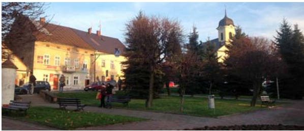
Ryc. 14. Widok od północnego zachodu na rynek w Brzostku obecnie, fot. D. Kuśnierz-Krupa, 2013

Fig. 12. View from the north-west of the market square in Brzostek in the 1920s and ruins of town hall, photo [in:] Archive of WUOZ in Przemysł, Rzeszów Branch, s.v.