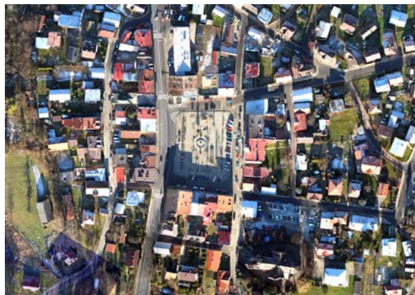
Ryc. 10. Widok na rynek w Kołaczycach z lotu ptaka obecnie, fot. M. Macner, 2013