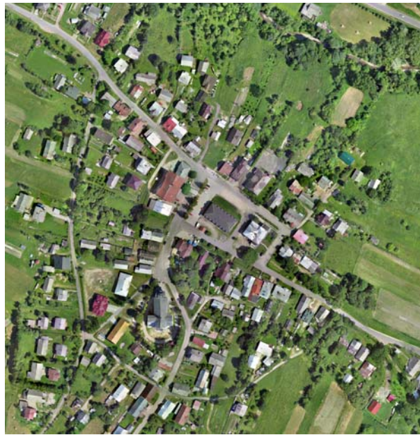
Ryc. 20. Zdjęcie lotnicze Jaślisk, fot. W. Gorgolewski 2013

Zaprezentowane wyżej przykłady trzech miast z terenu południowo-wschodniej Małopolski pokazują szereg problemów, jakie wiążą się z rewaloryzacją centrów lokalnych ośrodków miejskich. W większości przypadków miasta te po II wojnie światowej zatraciły swoje wartości kulturowe. Część z nich stara się je odzyskać, a następnie wykorzystać w procesie odbudowywania lokalnego patriotyzmu oraz ożywienia turystycznego. Istotnym jest jednak, aby rewaloryzacja i rewitalizacja tych zabytkowych miast przebiegała zgodnie z wymogami konserwatorskimi i nie zafałszowywała ich pierwotnego charakteru i piękna. Do tego oczywistego celu należy dążyć poprzez właściwe regulacje w procesie planowania przestrzennego i w ramach