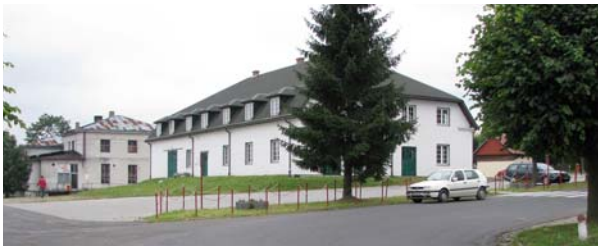
Ryc. 19. Widok od południowego zachodu na rynek w Jaśliskach obecnie, fot. D. Kuśnierz-Krupa, 2013

Fig. 19. View from the south-west onto the market square in Jaśliska currently, photo: D. Kuśnierz-Krupa, 2013