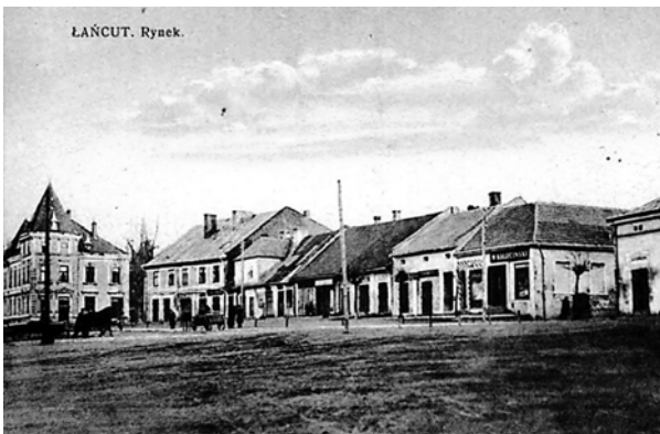
Ryc. 2. Rynek w Łańcutie w 1 połowie XX wieku, fot. [w:] Archiwum KHAUiSzP WA PK, s.v.