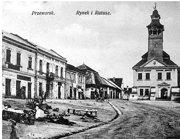
Ryc. 4. Rynek w Przeworsku w 1 połowie XX wieku