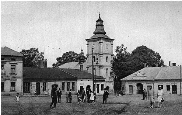
Ryc. 1. Rynek w Żmigrodzie Nowym w 1 połowie XX wieku