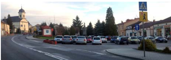
Ryc. 15. Widok od północnego wschodu na rynek w Brzostku obecnie

Fig. 14. View from the north-west of the market square in Brzostek, nowadays