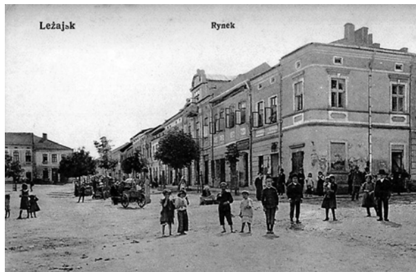
Ryc. 5. Rynek w Leżajsku w 1 połowie XX wieku