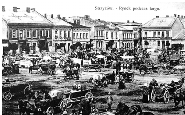
Ryc. 6. Rynek w Strzyżowie na początku XX wieku, fot. [w:] Archiwum KHAUiSzP WA PK, s.v.