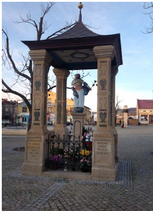
Ryc. 11. Widok na kapliczkę Matki Bożej Niepokalanej obecnie, fot. D. Kuśnierz-Krupa, 2013