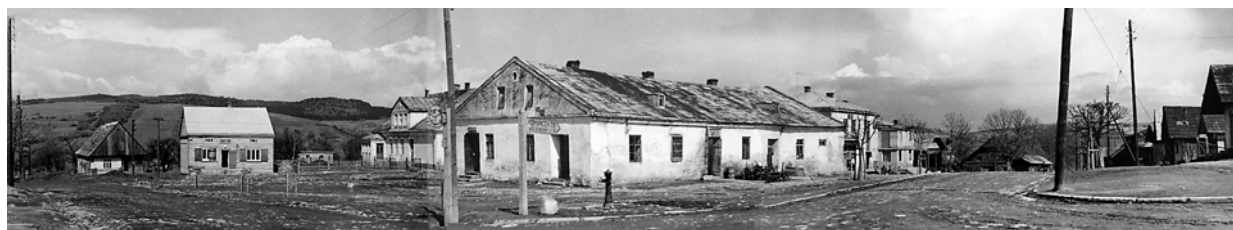
Ryc. 18. Widok rynku i ratusza w Jaśliskach w latach 60. XX wieku, fot. L. Kozakiewicz [w:] Jaśliska. Studium Historyczno-Urbanistyczne do planu zagospodarowania przestrzennego miasteczka , L. Kozakiewicz (red.), P.P. PKZ, O. Warszawa, mpis, Warszawa 1964, neg. PKZ, 44064/66

analiza metrologiczna reliktywów podziałów ewidencyjnych w centrum miasta nasuwa dwie hipotezy. Pierwsza dotyczy zastosowania przy rozmierzeniu miasta siatki metrologicznej opartej na module sznura dużego 17 . Druga, opracowana po pogłębionej analizie podziałów bloków zabudowy, działek siedliskowych, a także kształtu placu rynkowego, sugeruje, że w Jaśliskach po zniszczeniach spowodowanych licznymi napadami i pożogami (być może najazdem Węgrów pod wodzą Tomasza Tarczaya w 1474 roku) 18 pierwotny układ urbanistyczny uległ wtórnemu rozmierzeniu 19 . Zabudowa przyrynkowa, jak w większości średniowiecznych miast, była pierwotnie kalenicowa. W wyniku podziału działek na półkuryjne zabudowa zmieniła swój charakter na szczytową – drewniane domy zwrócone były wówczas szczytem do rynku lub ulicy głównej z niego wychodzącej.