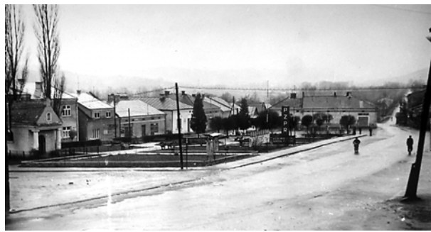
Ryc. 13. Widok od południowego wschodu na rynek w Brzostku w latach 60. XX wieku, fot. [w:] Archiwum Katedry HAUiSzP WA PK s.v.

Trzecim miastem, o którym należy wspomnieć w świetle poruszonego tematu, są Jaśliska, niegdyś ważny