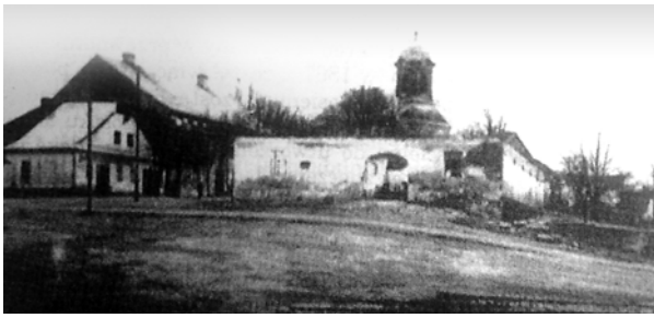
Ryc. 12. Widok od północnego zachodu na rynek w Brzostku w latach 20. XX wieku i ruiny ratusza, fot. [w:] Archiwum WUOZ w Przemysłu, Delegatura Rzeszów, s.v.

Fig. 12. View from the north-west of the market square in Brzostek in the 1920s and ruins of town hall, photo [in:] Archive of WUOZ in Przemysł, Rzeszów Branch, s.v.