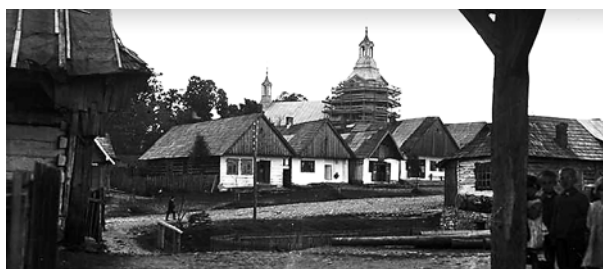
Ryc. 17. Widok rynku w Jaśliskach w latach 30. XX wieku

Miasto zostało rozmierzone według wzorca modelu turbinowego. Centrum zajął rynek o kształcie zbliżonym do trapezu, o wymiarach 110 do 135 m po dłuższych bokach oraz 67,5 do 90 m po bokach krótszych. Szczegółowa