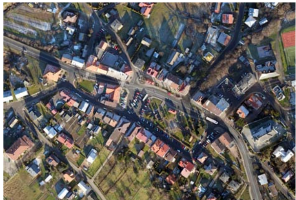
Ryc. 16. Widok na rynek w Brzostku z lotu ptaka obecnie, fot. M. Macner, 2013

Fig. 13. View from the south-east of the market square in Brzostek in the 1960s, photo [in:] Archive of the Institute HAUiSzP WA PK s.v.