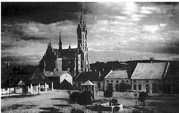
Ryc. 7. Widok na rynek w Kołaczycach od strony północno-zachodniej na początku XX wieku Fig. 7. View of the market square in Kołaczycach from the north-west at the beginning of the 20 th century