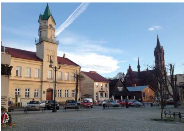
Ryc. 9. Widok na rynek w Kołaczycach od strony północno-zachodniej obecnie, fot. D. Kuśnierz-Krupa, 2013