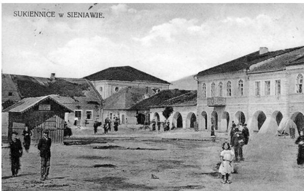
Ryc. 3. Rynek w Sieniawie w 1 połowie XX wieku, fot. [w:] Archiwum KHAUiSzP WA PK, s.v.