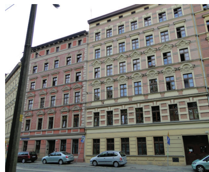
Fot. 7., 8. Restauracja kompleksu kamienic, pl. Stanisława Staszica 12-28, Wrocław