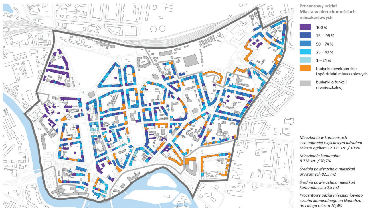
Fot. 2. Plan Przedmieścia Odrzańskiego z przedstawionym procentowym udziałem miasta w nieruchomościach mieszkaniowych

Szlachetne wyprawy tynkowe, typowe dla początków architektury XX-wiecznej, zarówno z czasów modernizmu, jak i powojenne, wciąż stanowią wyzwanie dla mniej doświadczonych firm zajmujących się remontem elewacji. Wymaga to bowiem wiedzy, doświadczenia, a także indywidualnego potraktowania każdego obiektu zabytkowego.