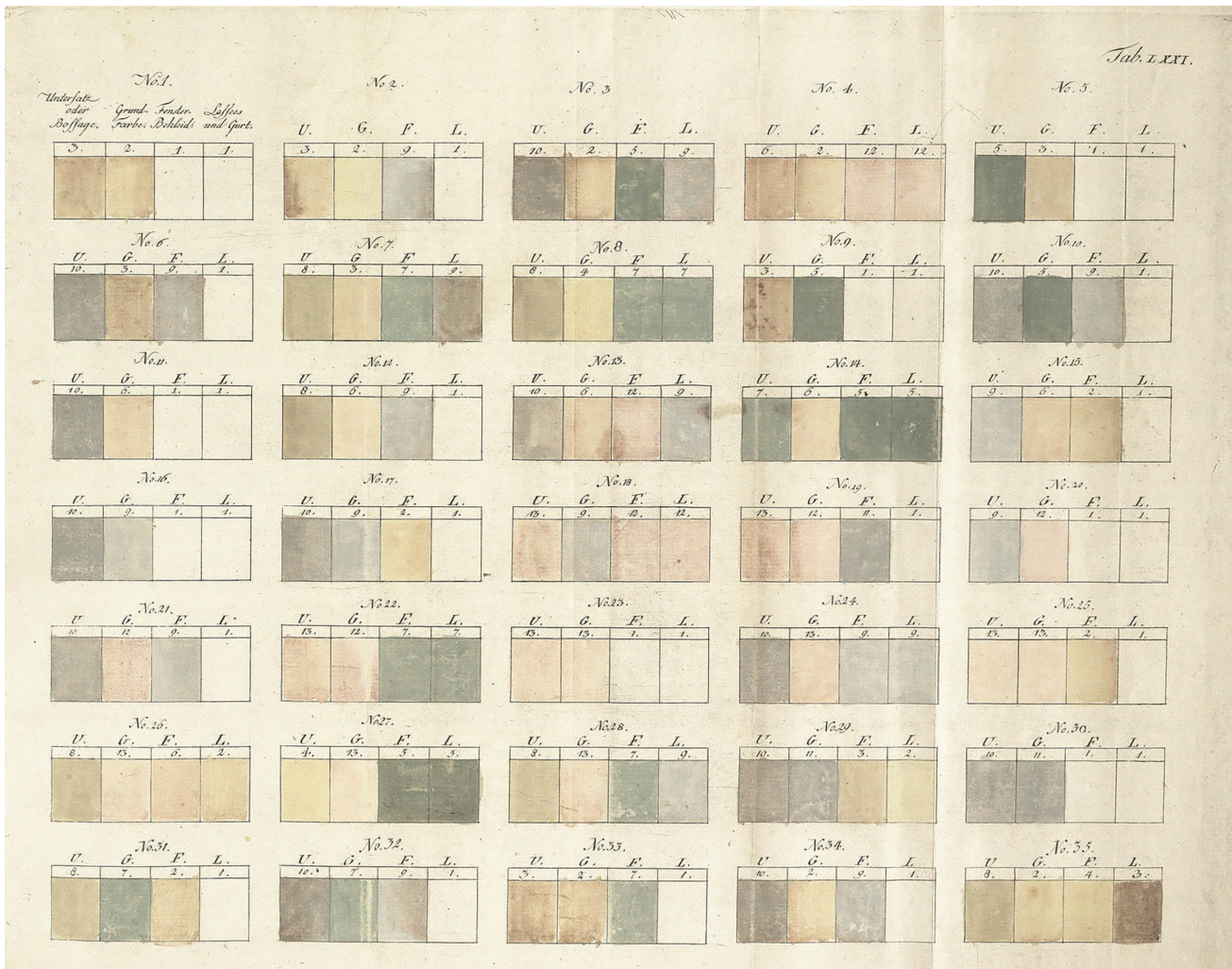
Fot. 1. Wzornik kolorystyczny F. Ch. Schmidta, Der burgerliche Baumeister z 1790 r.

rygodniejszymi źródłami w tej kwestii są kompletne badania stratygraficzne powłok malarskich, przeprowadzone przed wykonaniem zaplanowanych prac remontowych lub konserwatorskich. Już w wieku XVIII na terenach pozostających pod wpływami saskimi używano wzorników farb elewacyjnych, będących wzorem zarówno dla jednej kamienicy, jak i całej pierzei. Mogą one stanowić cenne źródło do analiz porównawczych, jednak nie zastąpią badań ikonograficznych i archiwalnych.