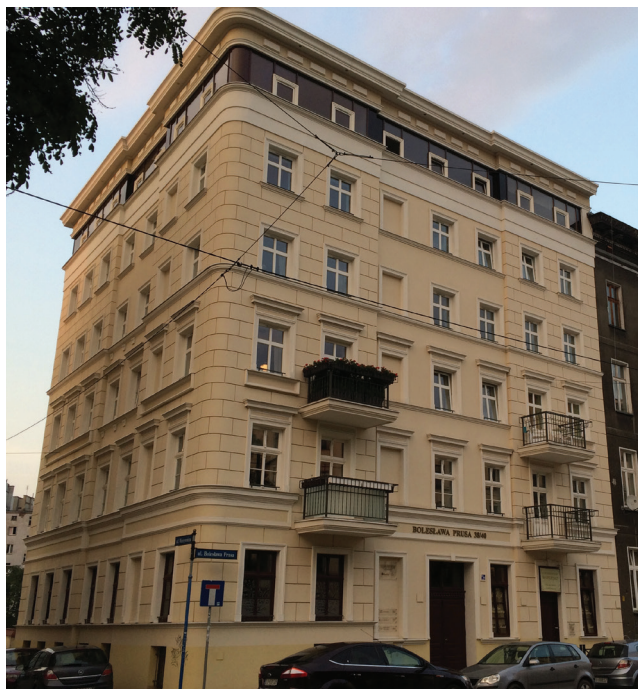
Fot. 6. Kamienica przy ul. Bolesława Prusa 38-40 po rewaloryzacji 2012 r., Wrocław