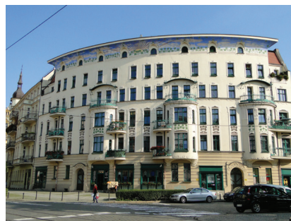
Fot. 4. Kamienica przy ul. Bolesława Prusa 5 po rewaloryzacji, Wrocław

Kamienicę objęto pilotażowym programem wrocławskich rewitalizacji. W 2006 r. ukończono remont obiektu finansowany przez Gminę Wrocław oraz Kogenerację SA Forum Wrocław SA. Odtworzono kolorystykę elewacji, malując część przyziemia ugrebem, a pozostałą część elewacji w kolorze écru, elementy kute balustrady balkonowych utrzymano w odcieniu zieleni, podobnie potraktowano stolarkę okienną.