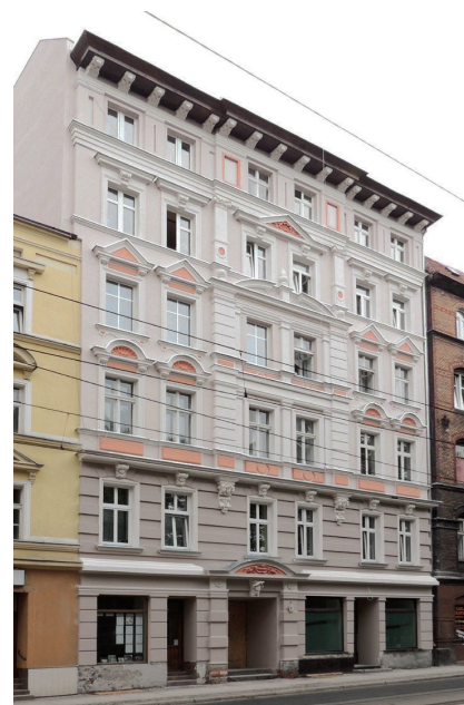
Fot. 13. Kamienica przy ul. Poniatowskiego 1A po pracach rewaloryzacyjnych; fot. z sierpnia 2013 r.

Rewaloryzacja kamienic czynszowych stanowi kompromis między rewaloryzacją obiektu a jego kreacją. W opisanych obiektach odtworzono i wyeksponowano detal architektoniczny oraz pierwotną fakturę i kolorystykę, co zostało poparte rzetelnymi badaniami konserwatorskimi. Dotyczy to głównie wzorcowej rewaloryzacji pierzei kamienic przy ul. Staszica 12-28 oraz kamienicy przy ul. Prusa 5 i ul. Prusa 35-40. Dwie z 15 badanych kamienic były wpisane do rejestru zabytków (ul. Staszica 12; nr rej. A/2268/579 z dn. 25.11.1997 r., oraz ul. Prusa 5; nr rej. A/4228/284 z dn. 21.02.1972), pozostałe obiekty są ujęte w Gminnej Ewidencji