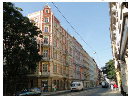
Fot. 9., fot. 10. Rewaloryzacja kompleksu kamienic, ul. Księcia Józefa Poniatowskiego 6-14, Wrocław