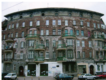
Fot. 3. Kamienica przy ul. Bolesława Prusa 5, Wrocław; 2004 r.

W latach 2007–2010 Zarząd Zasobu Komunalnego we Wrocławiu wprowadził projekt remontowy pod nazwą „Program 100 Kamienic”, który od 2011 r. funkcjonuje pod zmienioną nazwą „Program Rewitalizacji Wrocławskich Kamienic”. Do remontów zakwalifikowano kamienice o interesującej architekturze, położone w ważnych punktach miasta oraz będące w 100% własnością miasta Wrocławia [fot. 2].