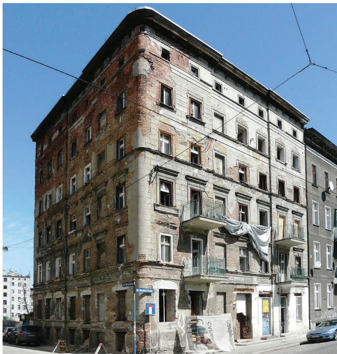
Fot. 5. Kamienica przy ul. Bolesława Prusa 38-40, Wrocław; 2004 r.