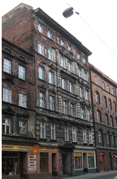
Fot. 11. Kamienica przy ul. Księcia Józefa Poniatowskiego 1A we Wrocławiu; fot. z października 2012 r.

staurowano klatki schodowe, przywracając sztukaterię w holach wejściowych, a także wykonano nowe elementy schodów: balustrady, stopnice, oraz zamontowano ujednolicone drzwi wejściowe do mieszkań (wszystkie wspomniane detale odwzorowano na podstawie zachowanych elementów).