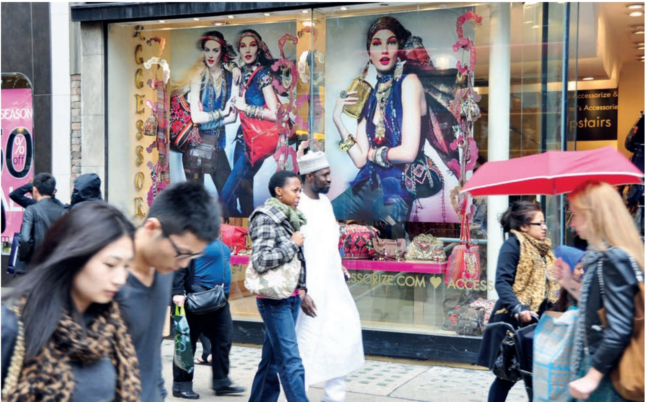
Il. 3. Ulica w mieście wielokulturowym. Oxford Street, Londyn, 2010