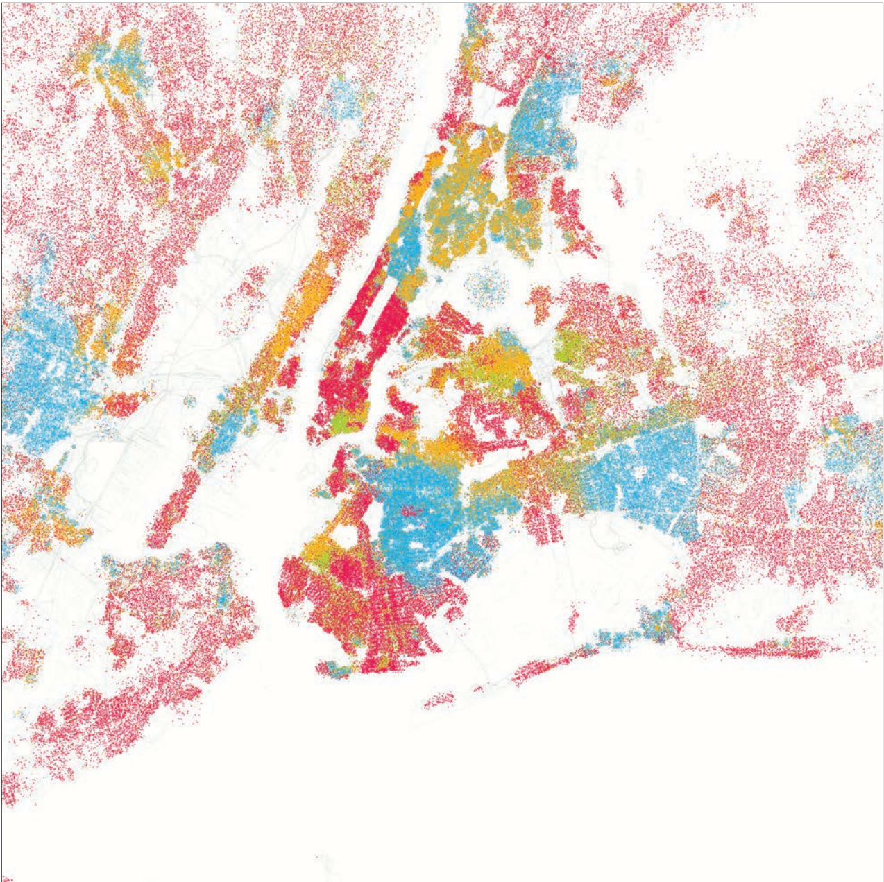
Il. 1. Rozproszenie grup etnicznych w Nowym Yorku, Źródło: Legend: Each dot is 25 people. White Black Asian Hispanic Other https://en.wikipedia.org/wiki/Demographics_of_New_York_City, [Accessed 15.08.2015] Source: Legend: Each dot is 25 people. White Black Asian Hispanic Other https://en.wikipedia.org/wiki/Demographics_of_New_York_City, [Accessed 15.08.2015]

uchodźców. W odwecie z arabskich miast Bliskiego Wschodu wygnani zostali sefardyjscy Żydzi, opróżnione zostały stare dzielnice żydowskie. Większość z nich trafiła do Izraela, zasiedlając głównie łańcuch tzw. Nowych Miast ( Development Towns ), zbudowanych naprędce na przełomie lat 40-tych i 50-tych XX wieku przez rząd izraelski. Miasta bliskowschodnie opuścili też Europejczycy, a w ślad za nimi inne mniejszości narodowo-etniczne. Wraz z postępującą modernizacją zaniknęły stare, tradycyjne zawody, ograniczeniu uległ uliczny handel. Zabudowa miast pozostała nienaruszona, lecz całkowicie zmienił się ich charakter: językiem handlowym stał się