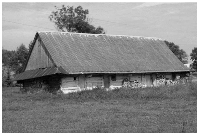
Rys. 4. Bartne 27. Chałupa z 1906r. Widok na elewację tylną. Autor: A. Mikrut, 06.2016

Fig. 3. Bartne 40. Cottage from 1927. View at the front. Author: A. Mikrut, 06.2016