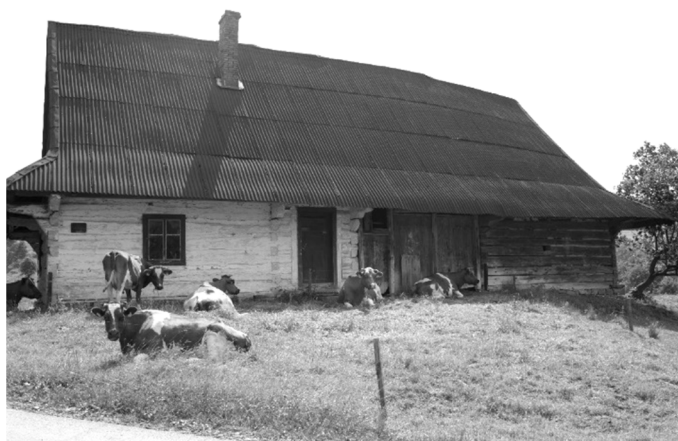
Rys. 3. Bartne 40. Chałupa półtoratraktowa z 1927 roku. Widok od frontu.

Na obszarze środkowej Łemkowszczyzny sieni i boisko były zazwyczaj osobne. W układzie, znajdowały się obok siebie (np. Bartne 40, 24) lub były rozdzielone pomieszczeniami gospodarczymi, najczęściej stajnią z komorą (Bartne 44). W wielu budynkach jedno pomieszczenie pełniło zarówno funkcję sieni jak i boiska. Pomieszczenie to znajdowało się pośrodku, dzieląc chałupę na część mieszkalną po stronie wschodniej i gospodarczą po stronie zachodniej. Łączenie funkcji sieni i boiska w jednym pomieszczeniu nie było powszechne w Komańczy.